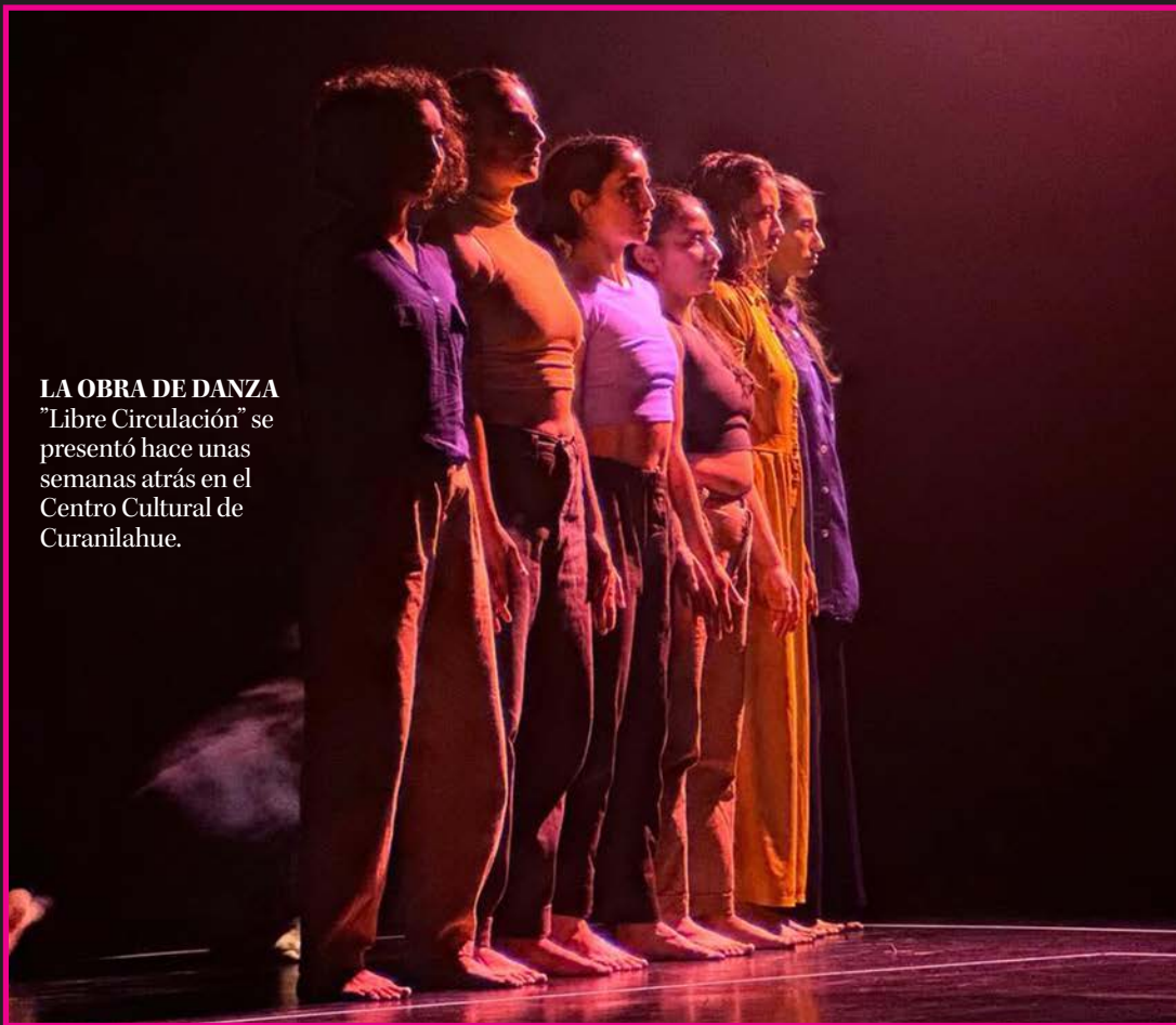
LA OBRA DE DANZA "Libre Circulación" se presentó hace unas semanas atrás en el Centro Cultural de Curanilahue.