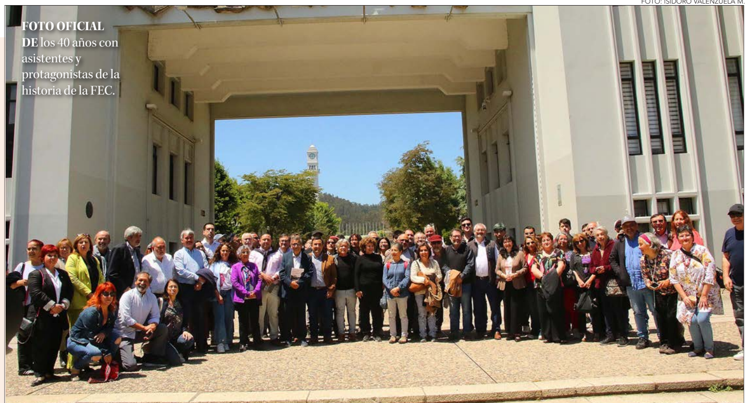
FOTO OFICIAL DE los 40 años con asistentes y protagonistas de la historia de la FEC.

Entre las 12.30 y las 15.30 horas se realizaron visitas al Campanil, a la Casa del Arte José Clemente Orozco y recorridos patrimoniales al Campus UdeC. Luego a las 16 horas el conversatorio “El protagonismo de las