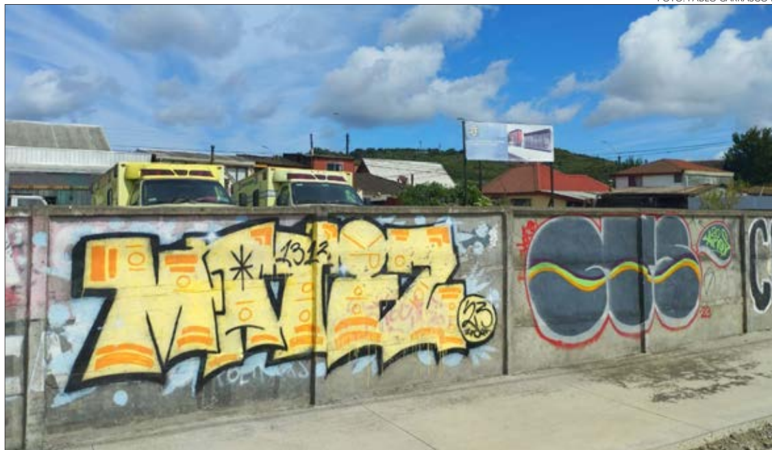
EN COLÓN frente al actual cuartel, bomberos de la Novena Compañía tiene un terreno donde buscan construir su “nueva casa”.