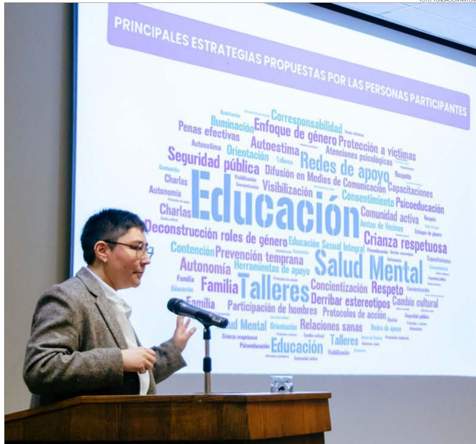
ESTUDIO DE LA FUNDACIÓN ANTONIA EN BIOBÍO