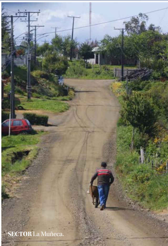
SECTOR La Muñeca.