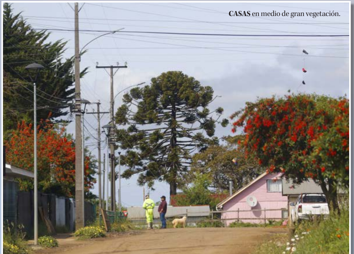
CASAS en medio de gran vegetación.