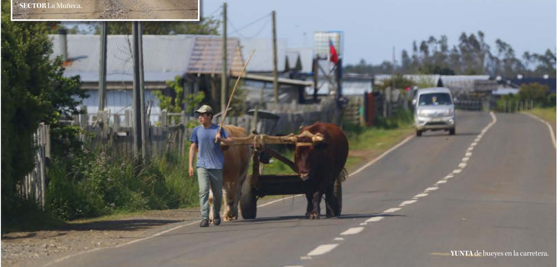
YUNTA de bueyes en la carretera.