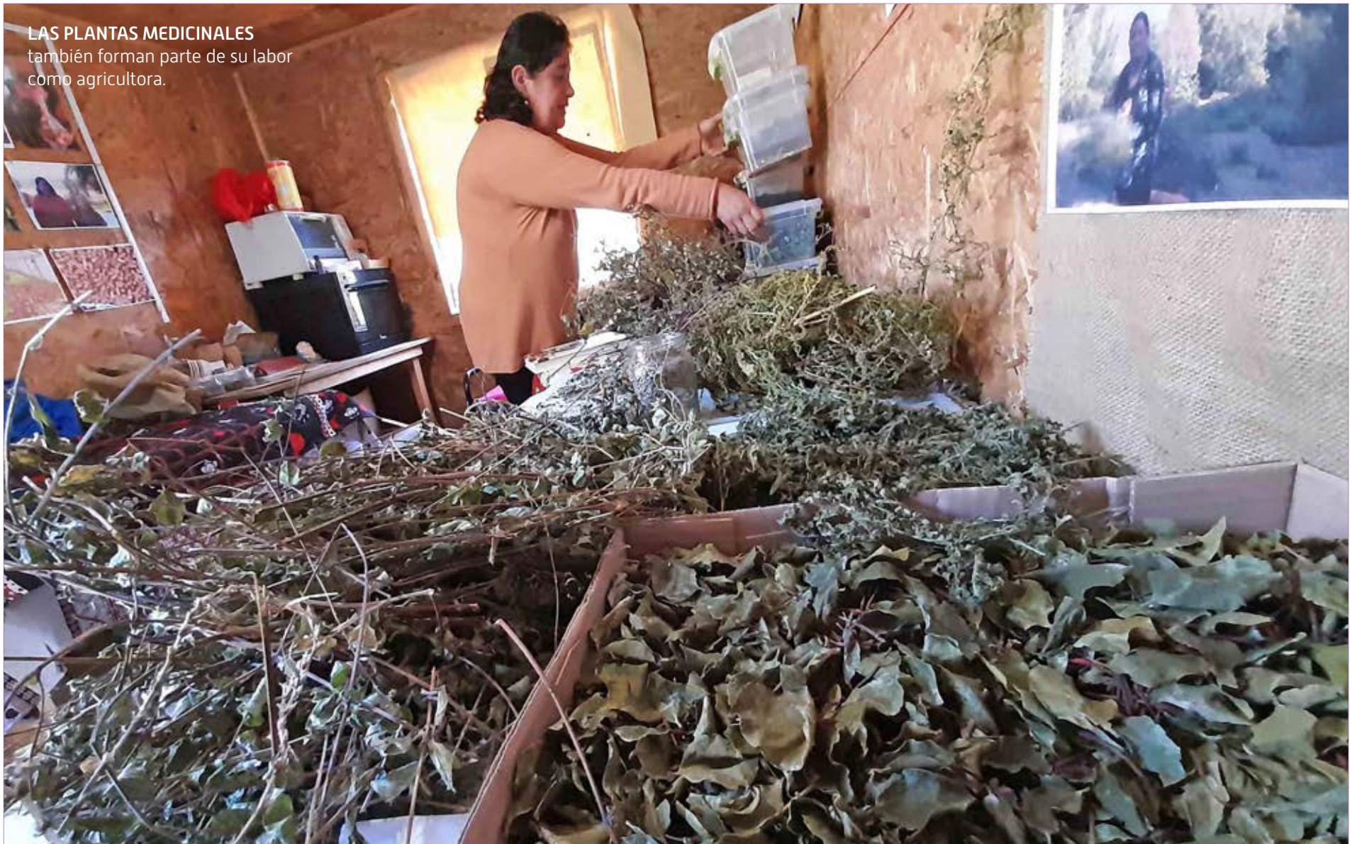
LAS PLANTAS MEDICINALES también forman parte de su labor como agricultora.