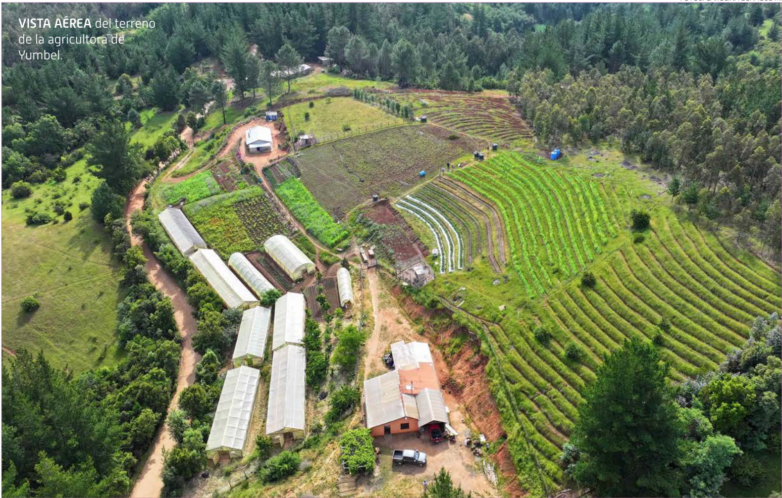
VISTA AÉREA del terreno de la agricultora de Yumbel.

de la herencia que le entregó su madre sobre cultivar la tierra y vivir de ella.