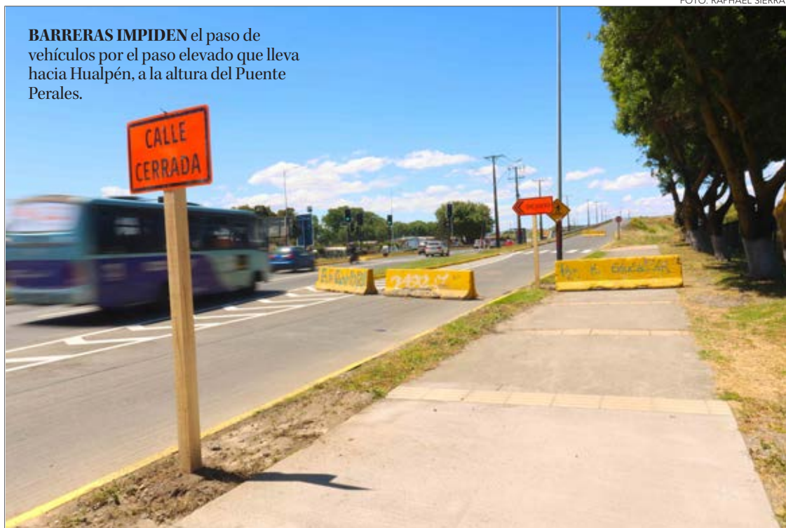
BARRERAS IMPIDEN el paso de vehículos por el paso elevado que lleva hacia Hualpén, a la altura del Puente Perales.