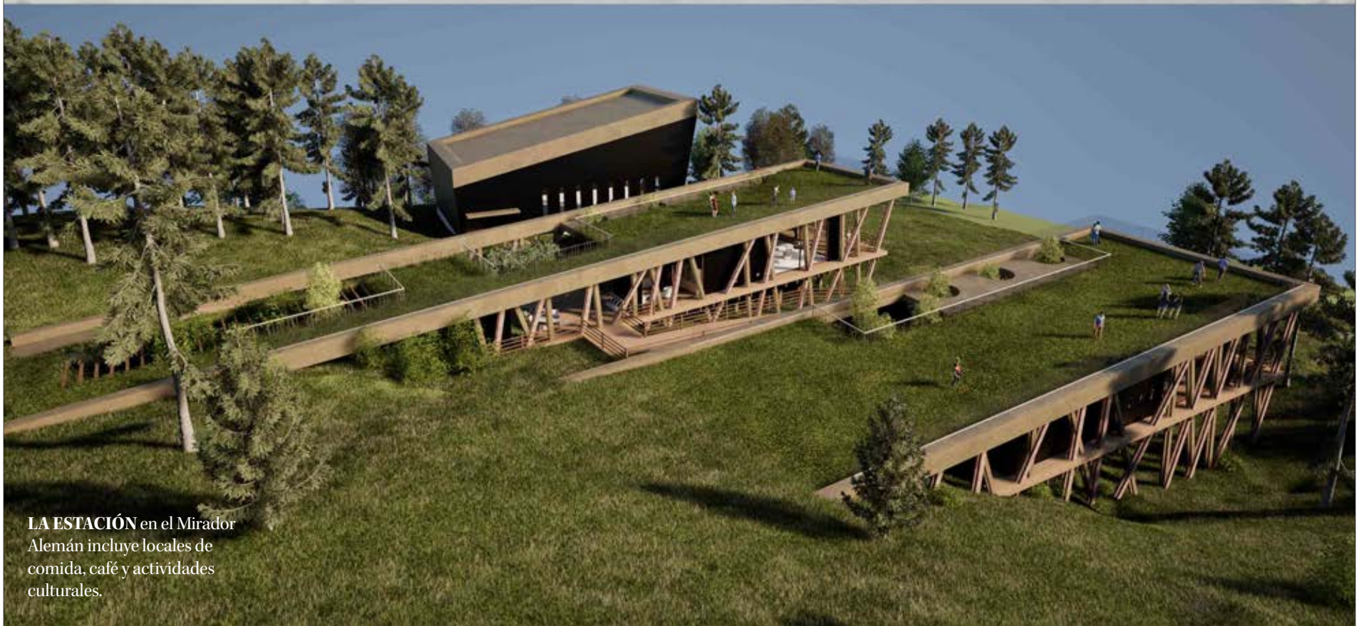
LA ESTACIÓN en el Mirador Alemán incluye locales de comida, café y actividades culturales.