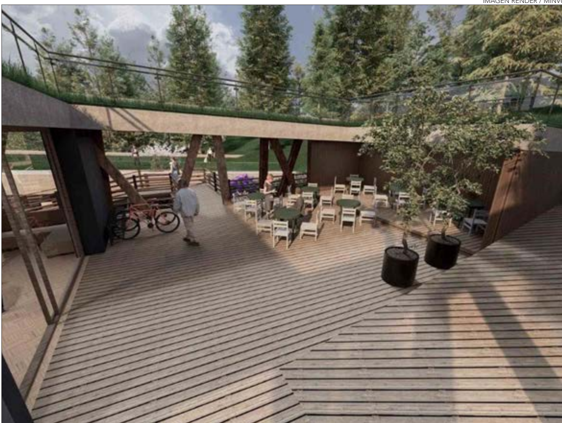
IMAGEN RENDER / MINVU

Twitter @DiarioConcepcion contacto@diarioconcepcion.cl