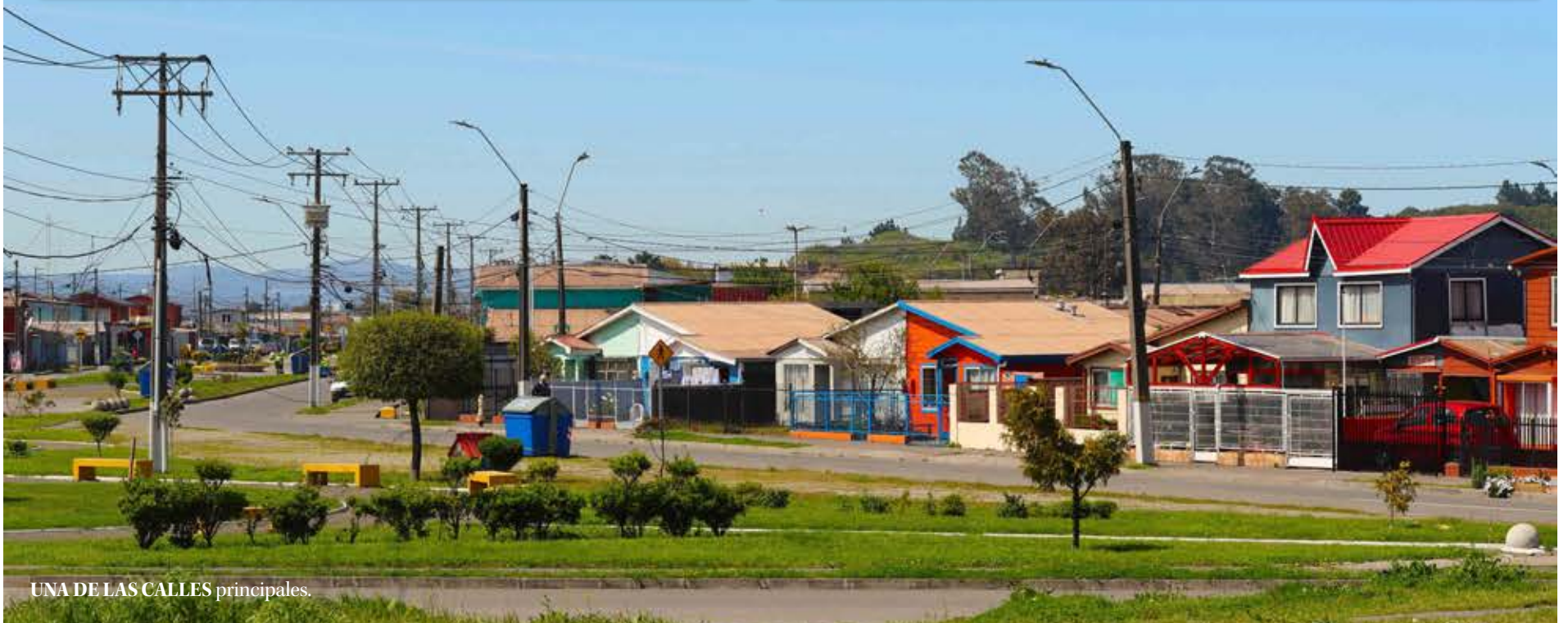
UNA DE LAS CALLES principales.