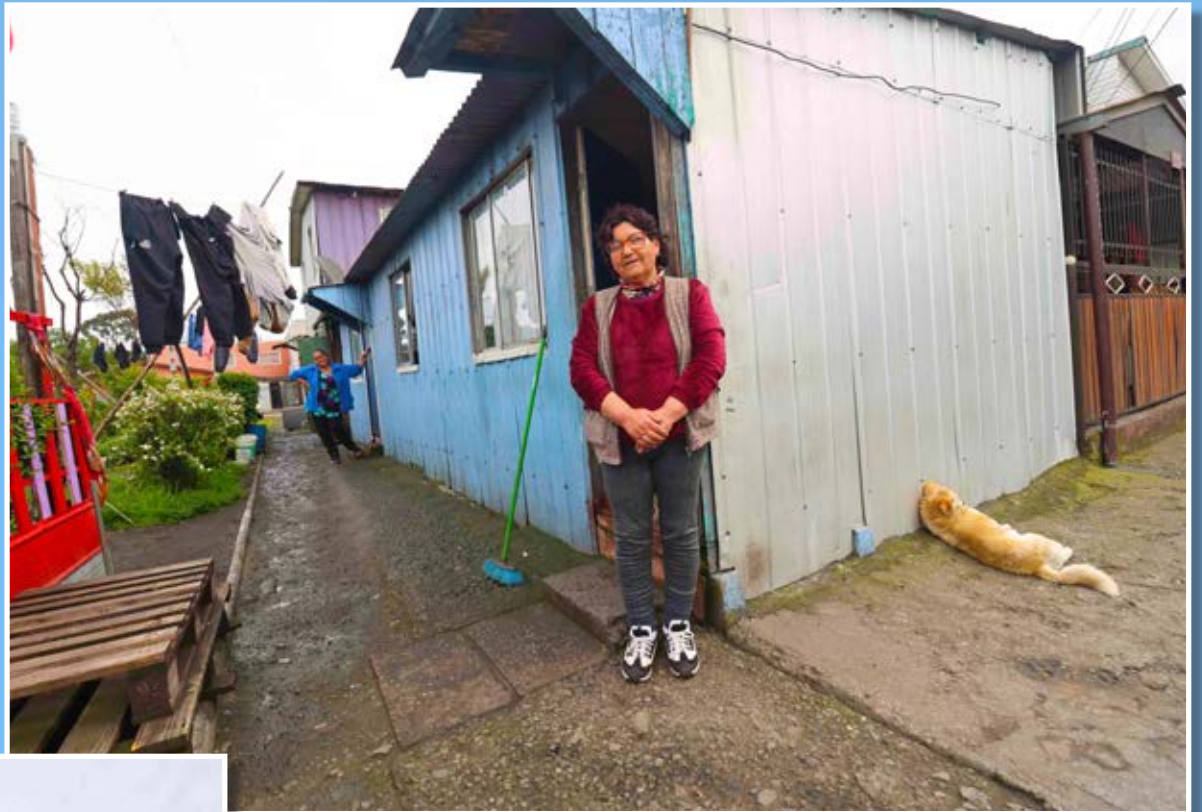
PLAZA Juan Fernández.