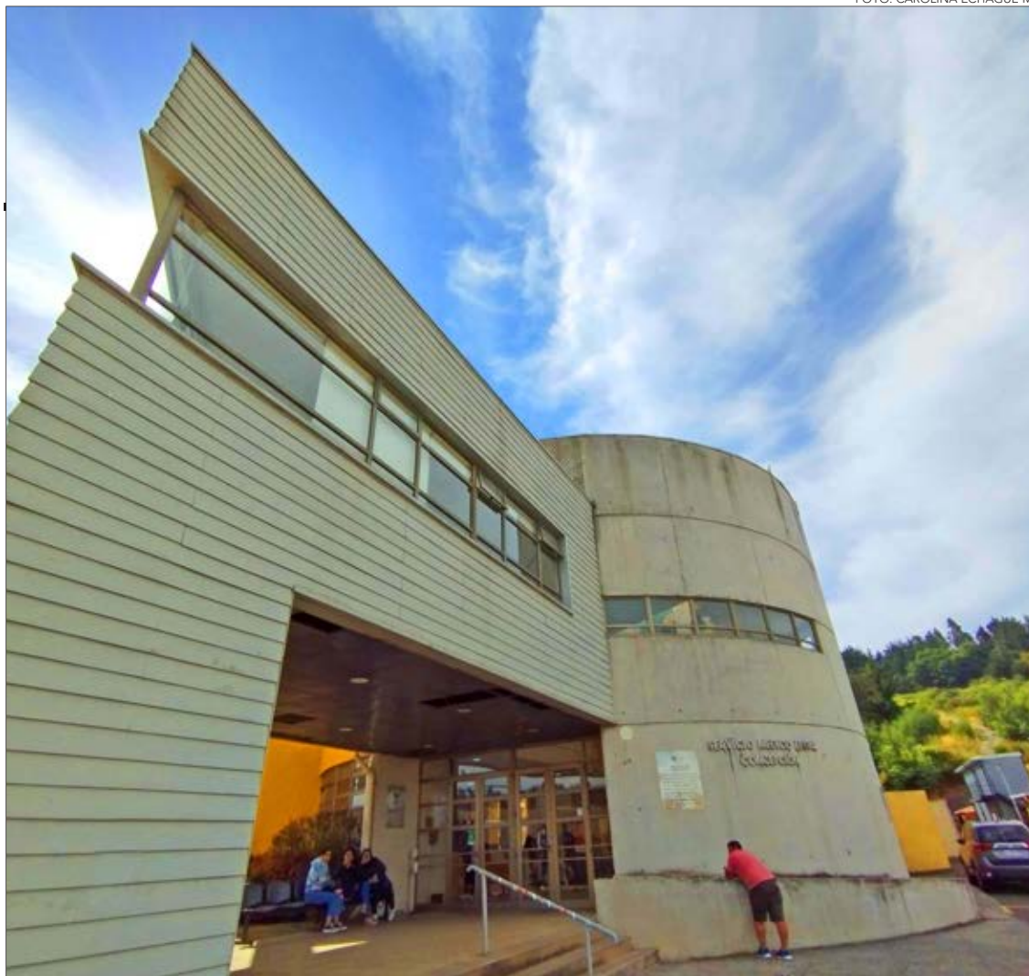
Las osamentas terminaron de ser ingresadas al SML en mayo de 2023.