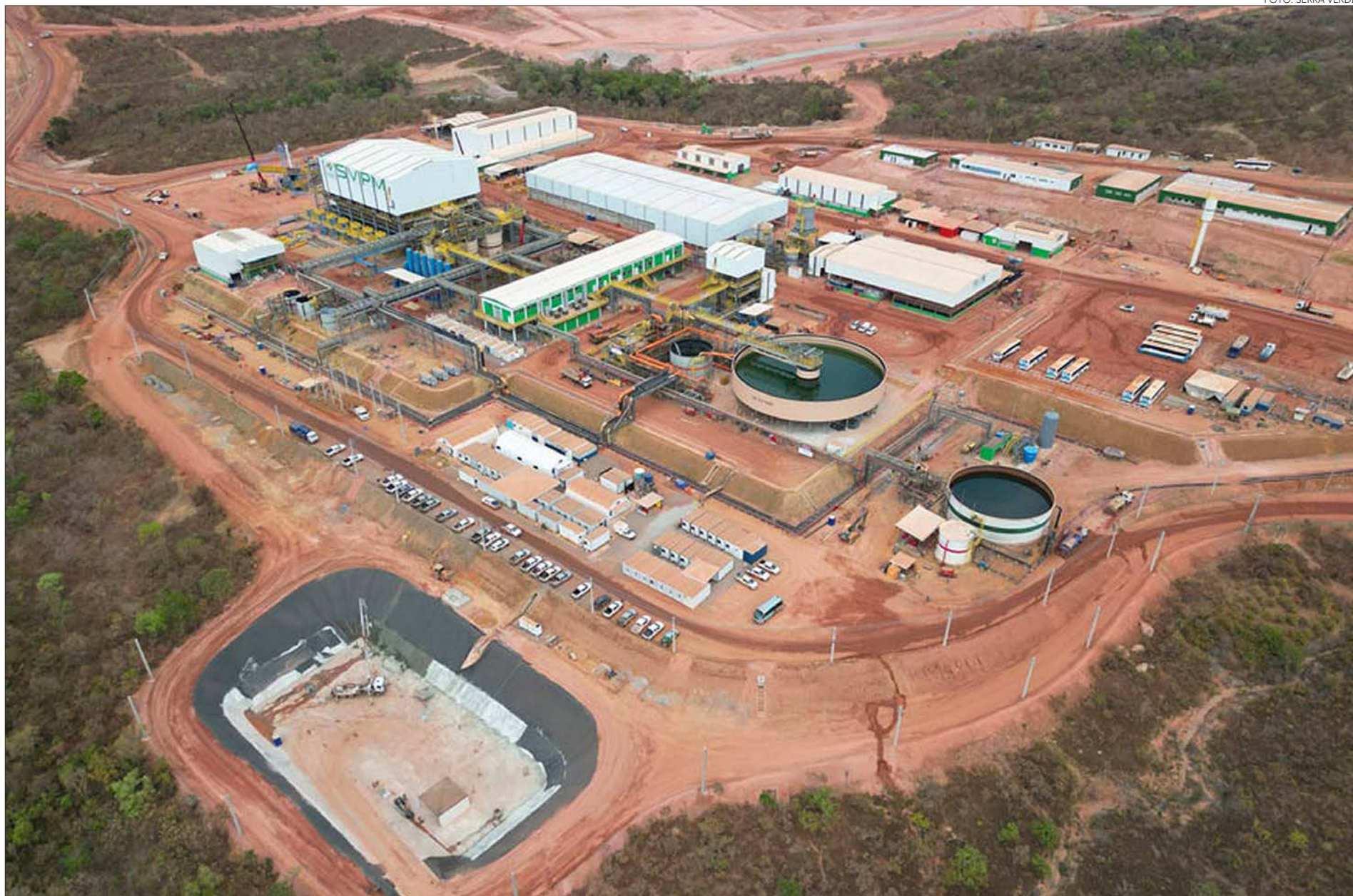
SERRA VERDE es la empresa líder de extracción de minerales en Brasil. Este centro de operaciones está ubicado en Minaçu, Estado de Goiás.