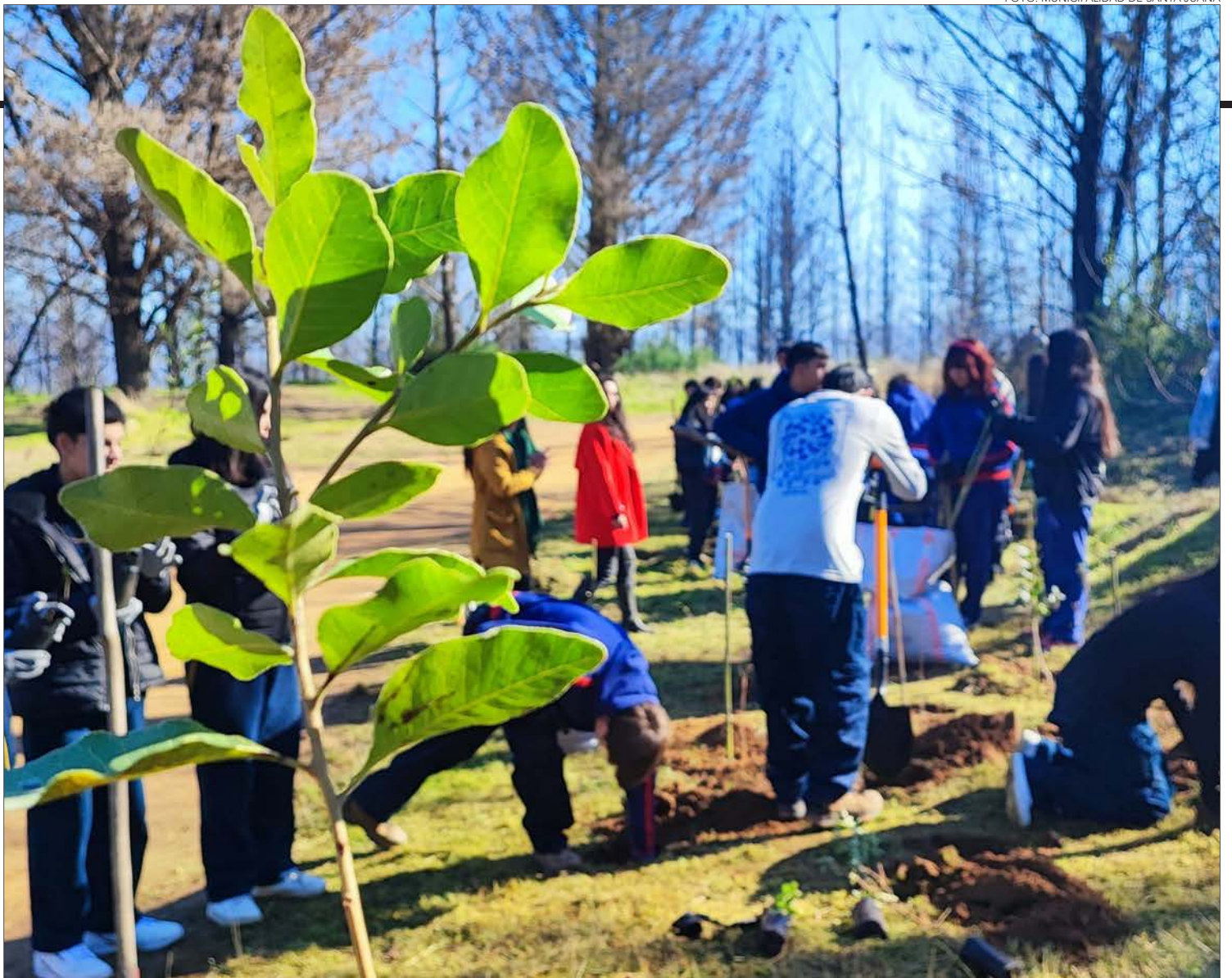
ALUMNOS DEL LICEO Nueva Zelanda junto a Conaf han ejecutado parte del plan de reforestación.

los cursos de agua y la futura infraestructura contribuirán a mitigar los efectos de los incendios forestales en un mediano a largo plazo “porque, obviamente, las plantas necesitan su tiempo (...) esperamos que no nos veamos afectados por incendios para que este trabajo no se pierda”, dijo y aclaró que no se pueden plantar árboles maduros, pues su posibilidad de supervivencia es menor.