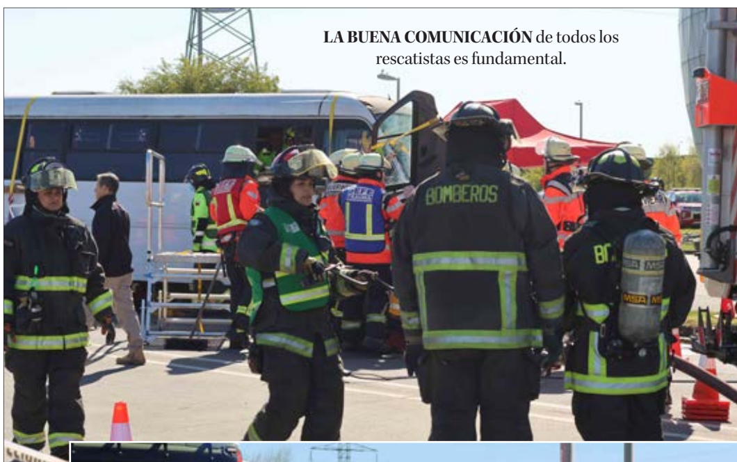
LA BUENA COMUNICACIÓN de todos los rescatistas es fundamental.

Una situación de accidente, cercana a la realidad, llevó a cabo el Cuerpo de Bomberos de Talcahuano, y otras entidades relacionadas.