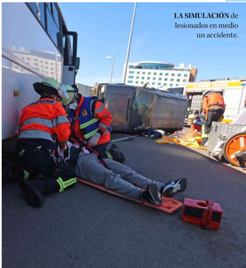
LA SIMULACIÓN de lesionados en medio un accidente.