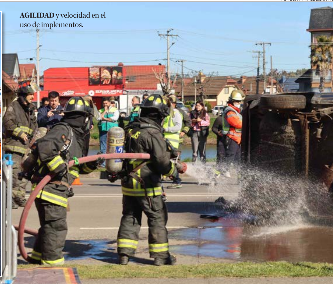
AGILIDAD y velocidad en el uso de implementos.