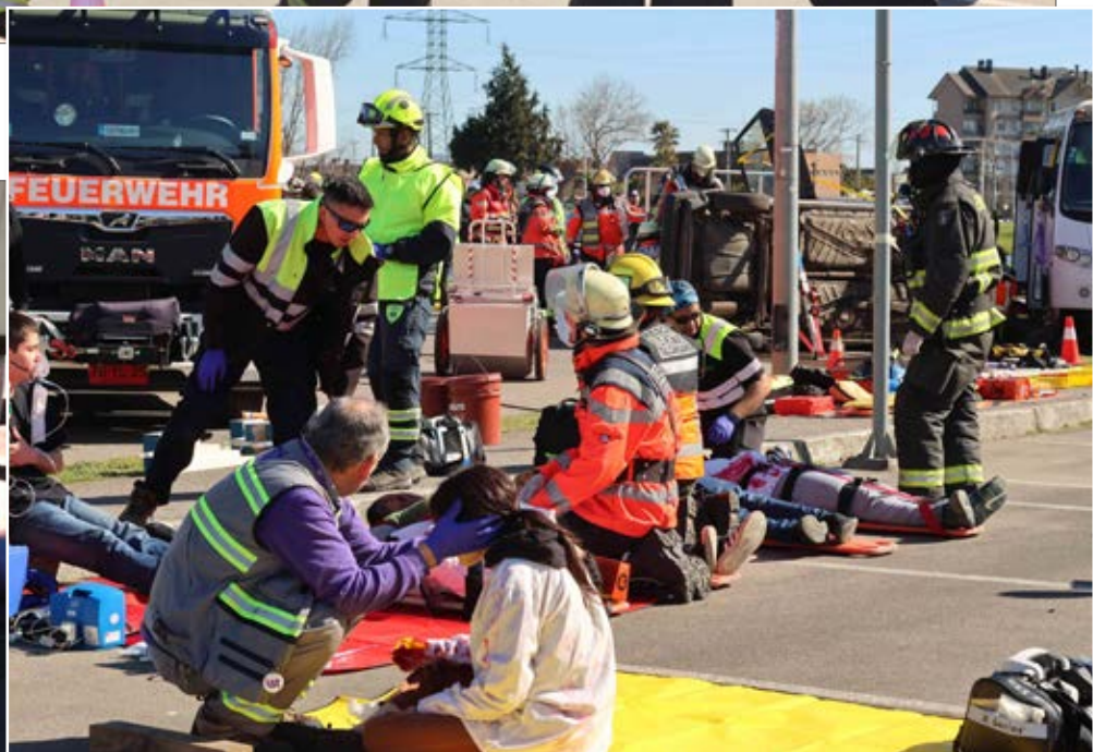
EL INICIO DE la puesta en escena sobre un accidente de tránsito.