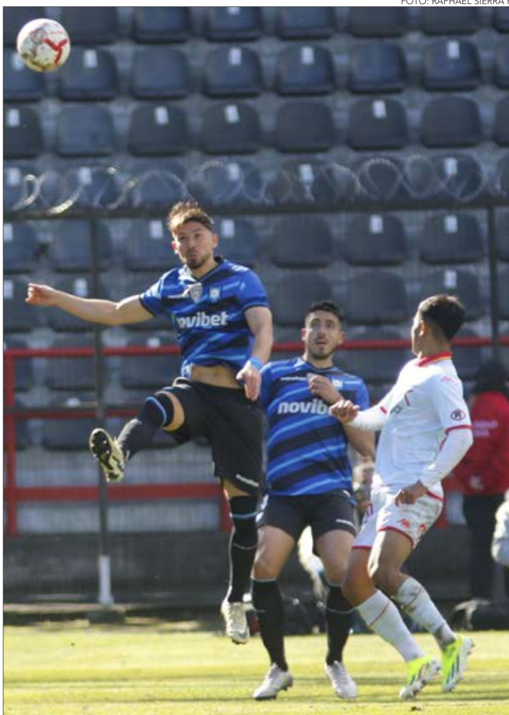
Estadio: El Alto de Nueva Imperial Horario: 15:30 horas

Jornada con historia, ya que ese mismo día, Huachipato recibirá a