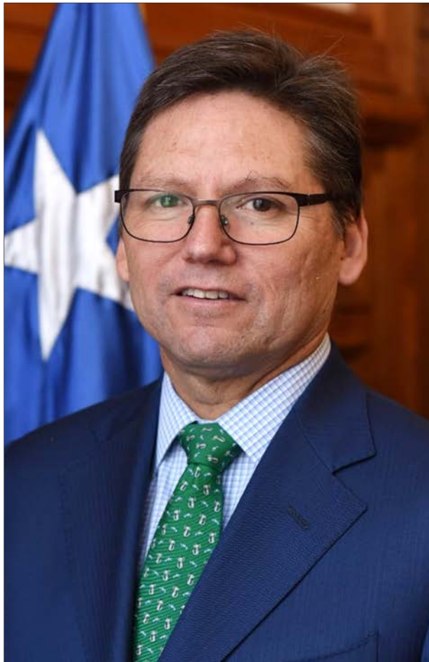
JEAN PIERRE MATUS, ministro de la Corte Suprema.