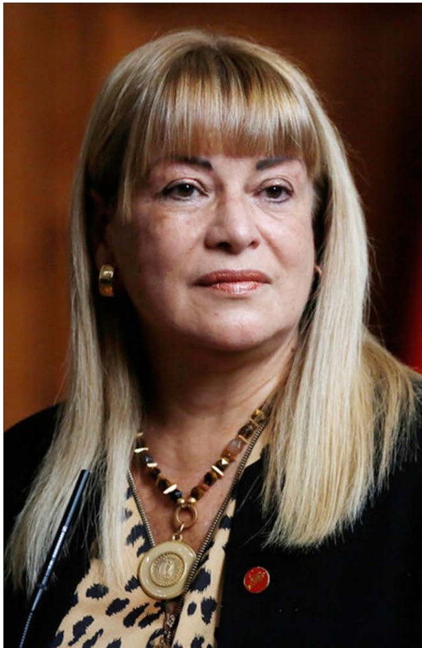
ÁNGELA VIVANCO, ministra de la Corte Suprema.