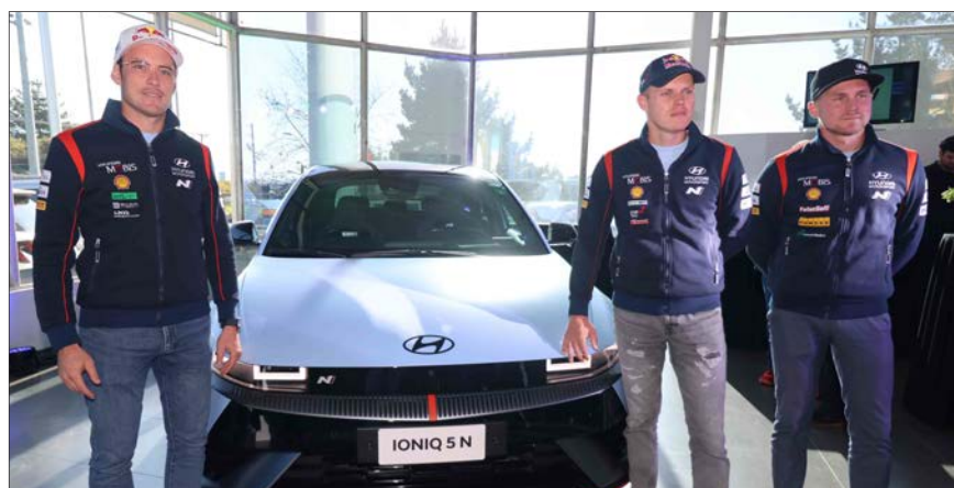
Los pilotos Thierry Neuville, Ott Tänak y Esapekka Lappi presentando a la estrella de la tarde: el Hyundai IONIQ 5 N que ya está en Chile.