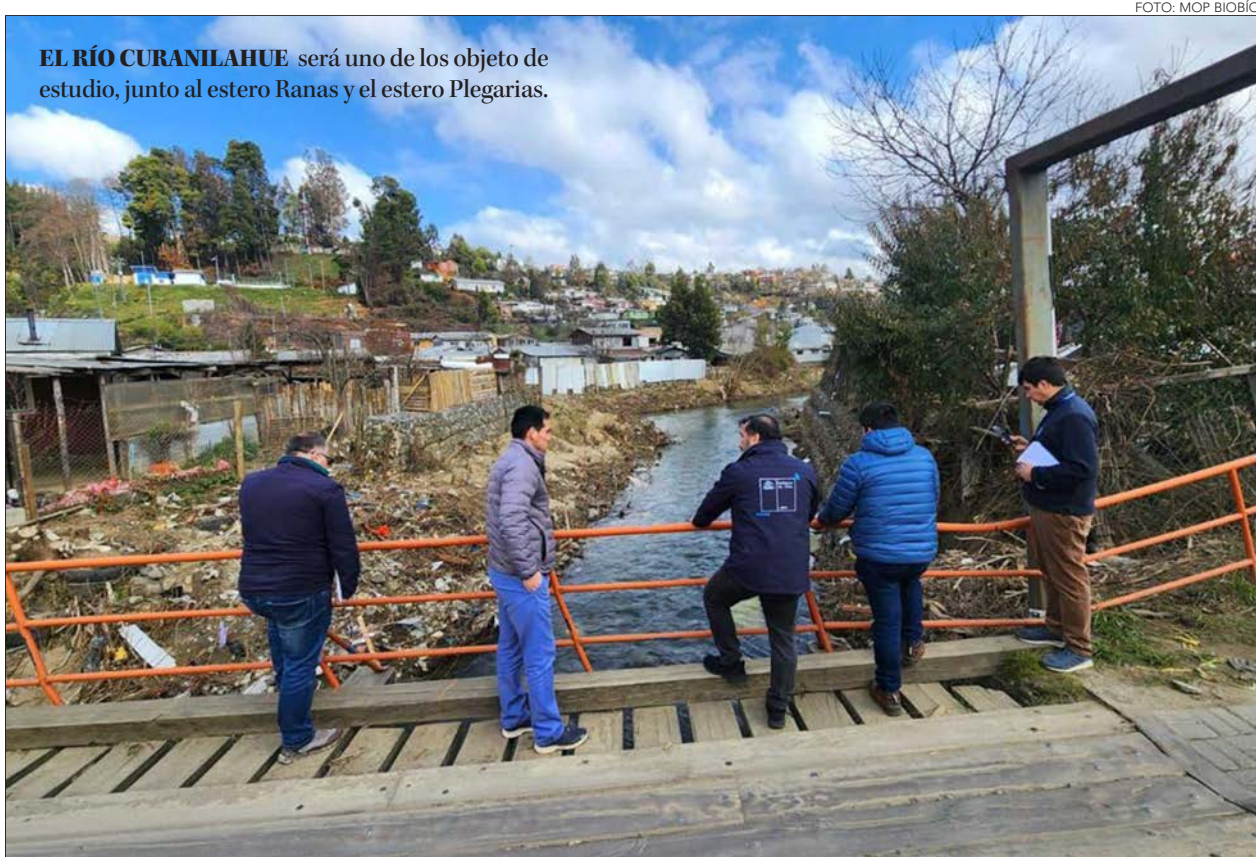
EL RÍO CURANILAHUE será uno de los objeto de estudio, junto al estero Ranas y el estero Plegarias.

“La necesidad de estos estudios tiene que ver con las inundaciones de 2023 y 2024. Y considerando que hubo un periodo de sequía bien prolongado de más de 10 años, en muchos de los sectores afectados, hubo acercamiento de la población a espacios inundables”, detalló