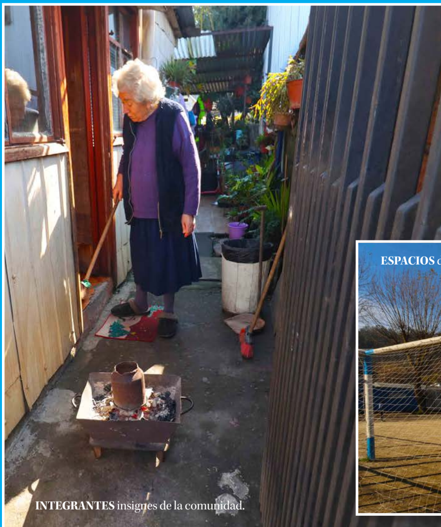
INTEGRANTES insignes de la comunidad.

Vía directa con Avenida Padre Alberto Hurtado. También se extiende hacia el Río Biobío.