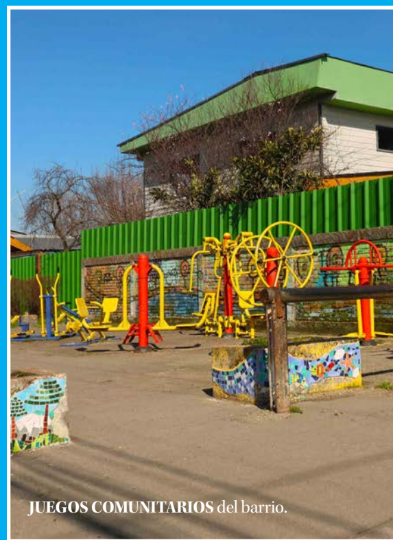
JUEGOS COMUNITARIOS del barrio.

Vía directa con Avenida Padre Alberto Hurtado. También se extiende hacia el Río Biobío.