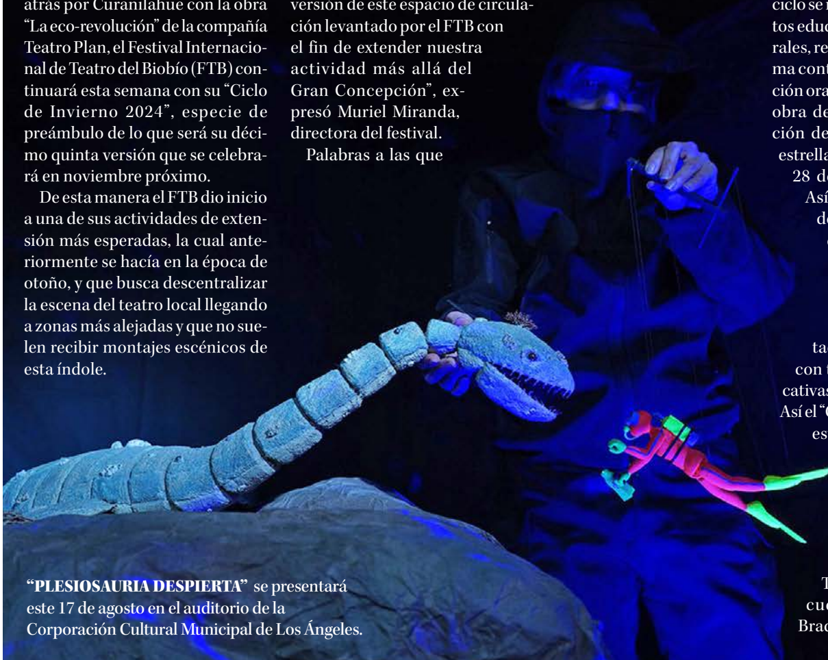
"PLESIOSAURIA DESPIERTA" se presentará este 17 de agosto en el auditorio de la Corporación Cultural Municipal de Los Ángeles.

Twitter @DiarioConce contacto@diarioconcepcion.cl