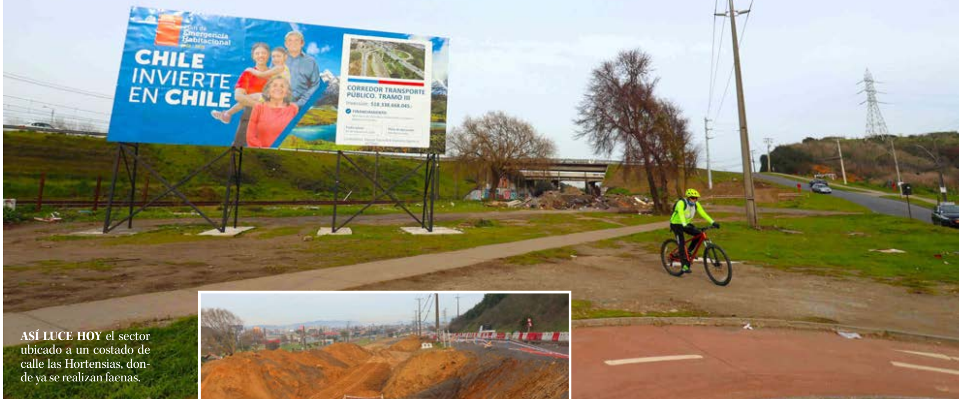
ASÍ LUCE HOY el sector ubicado a un costado de calle las Hortensias, donde ya se realizan faenas.

Como parte de Corredor de Transporte Público, que se construye entre el sector Las Golondrinas y Perales, el proyecto incluirá la pavimentación de un tramo de 300 metros que busca agilizar el ingreso al sector del Valle de San Eugenio, Villa Ensenada y Denavi Sur, entre otros.