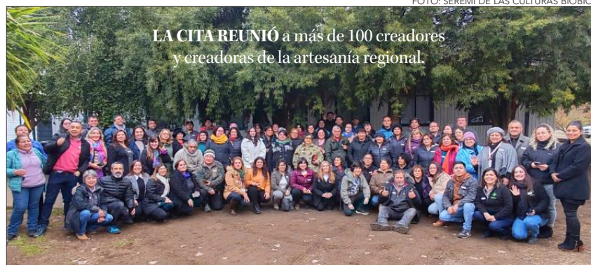
LA CITA REUNIÓ a más de 100 creadores y creadoras de la artesanía regional.

Más de un centenar de creadoras y creadores, provenientes de las 14 comunas de la Provincia del Biobío, se dieron cita hace unos días en la comuna de Quilaco en un Encuentro Provincial de Artesanos y Artesanas.