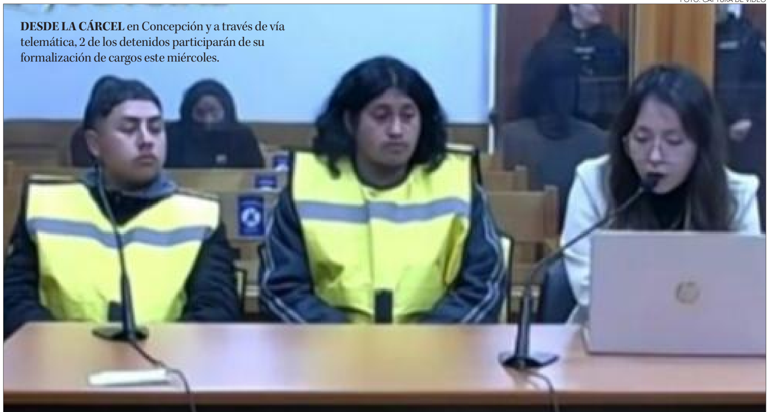
DESDE LA CÁRCEL en Concepción y a través de vía telemática, 2 de los detenidos participarán de su formalización de cargos este miércoles.

En este sentido, y tras un gigantesco operativo policial que incluyó a personas de distintas unidades y especialidades de Carabineros y el tra-