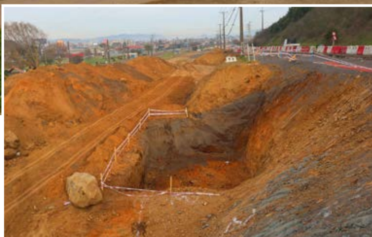
EN PLENO MOVIMIENTO de tierra se encuentra el tramo que ira paralelo a la línea férrea y que permitirá unir Colón con Las Hortensias.

Pablo Carrasco Pérez pablo.carrasco@diarioconcepcion.cl