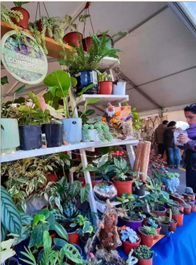
LAS PLANTAS se han transformado en protagonistas.