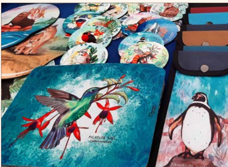
PORTACUBIERTOS, PORTAVASOS Y elementos de oficina llaman la atención de los clientes con sus atractivos diseños.