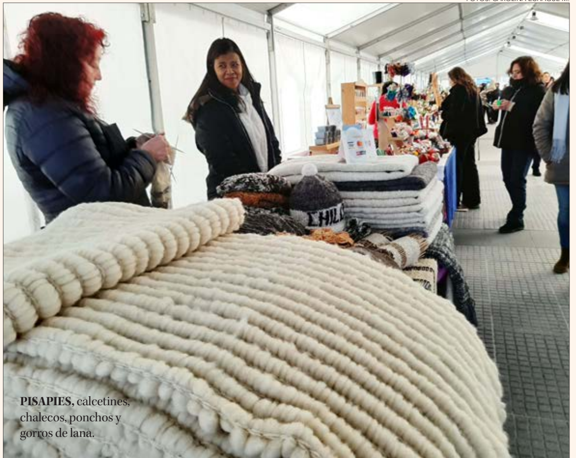
PISAPIES, calcetines, chalecos, ponchos y gorros de lana.