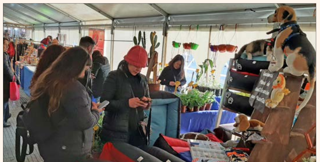
ACCESORIOS PARA MASCOTAS también son parte de la feria.