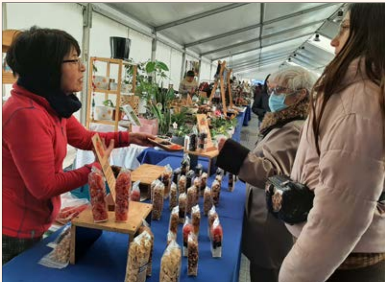
FRUTOS SECOS de producción local son un infaltable.

En la Plaza de Tribunales se desarrolla el evento que reúne distintos productos que tienen su origen en la Región del Biobío. Pinturas, tejidos, plantas y frutos forman parte de la oferta.