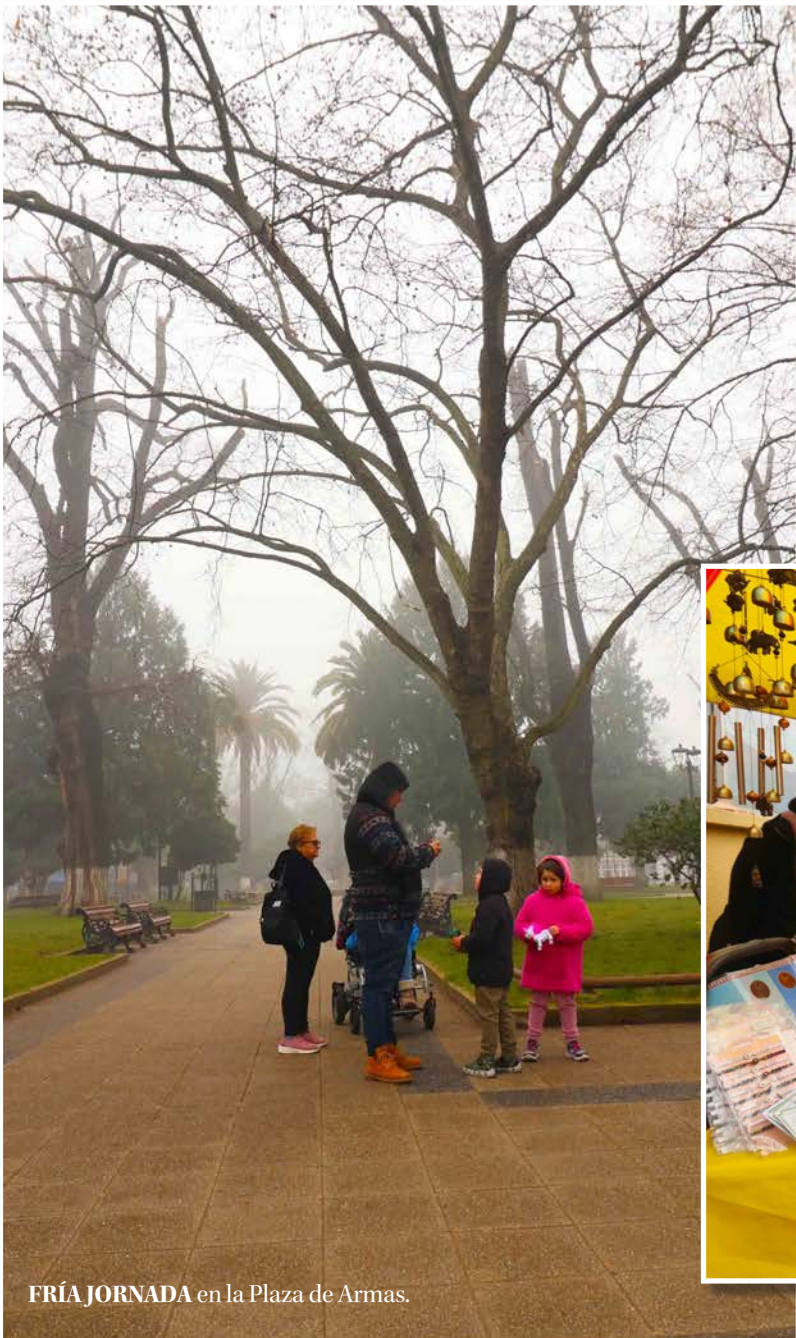
FRÍA JORNADA en la Plaza de Armas.