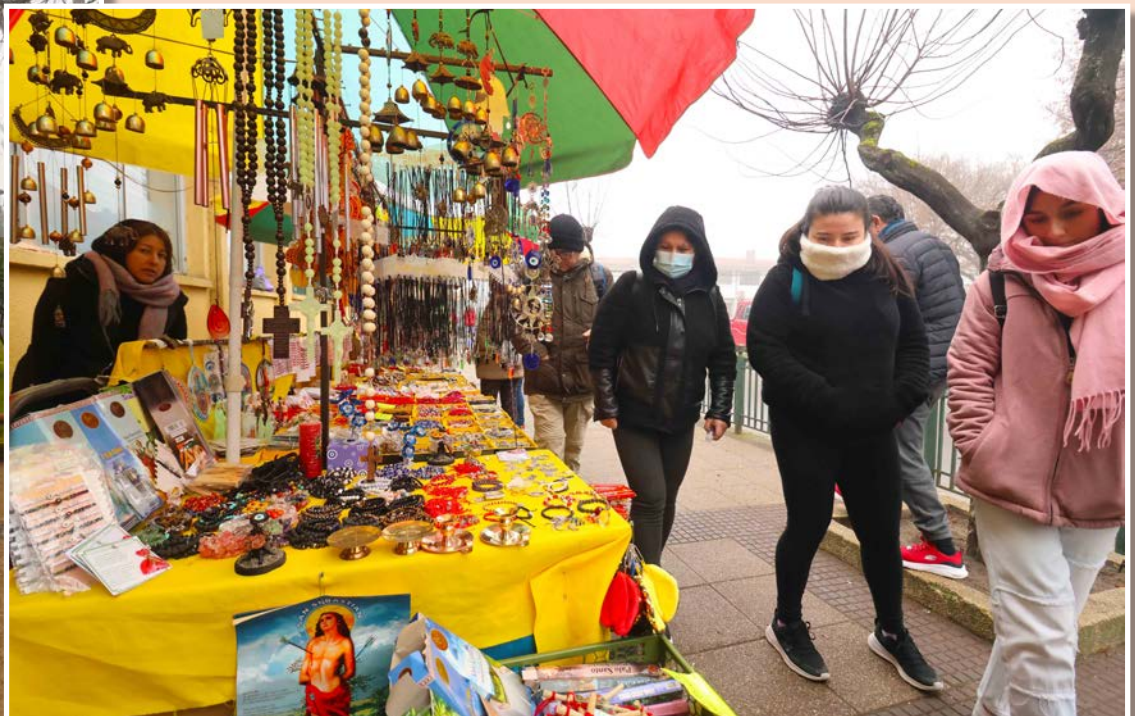
COMERCIO y venta de elementos vinculados al santuario católico.