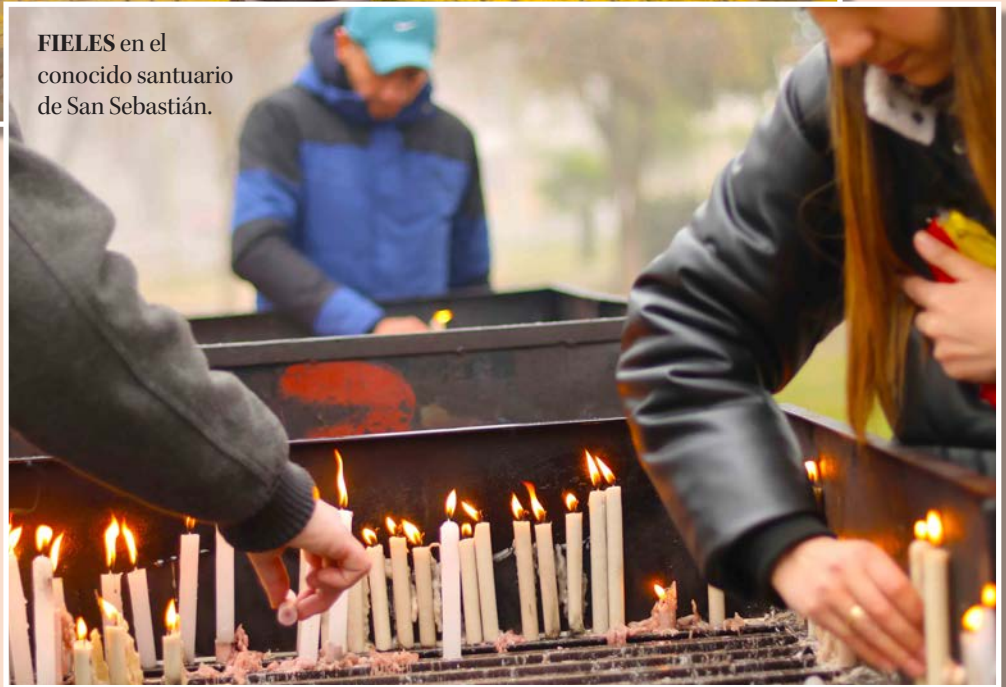
FIELES en el conocido santuario de San Sebastián.

PLACA en el paseo público, en homenaje al fallecido alcalde,