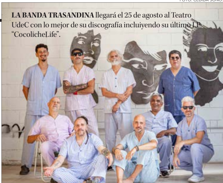
LA BANDA TRASANDINA llegará el 25 de agosto al Teatro UdeC con lo mejor de su discografía incluyendo su último LP “CocolicheLife”.