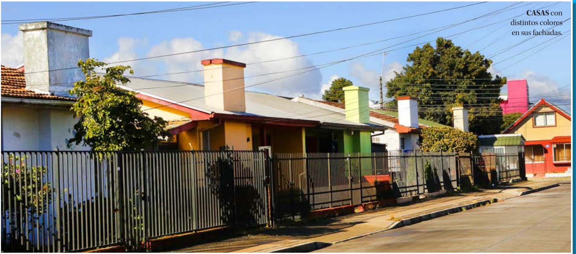
CASAS con distintos colores en sus fachadas.