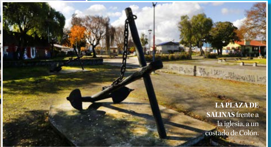
LA PLAZA DE SALINAS frente a la iglesia, a un costado de Colón.