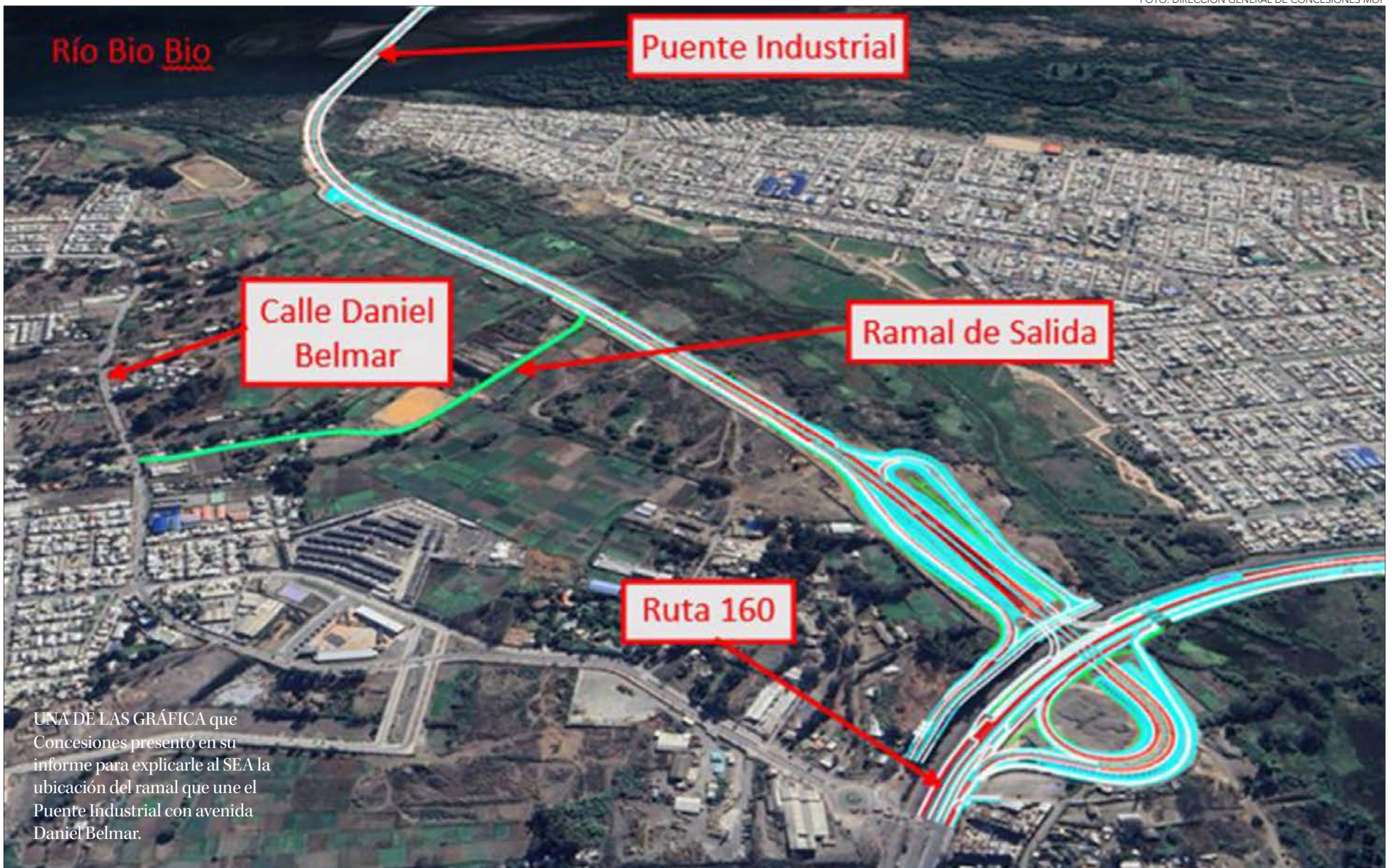
UNA DE LAS GRÁFICA que Concesiones presentó en su informe para explicarle al SEA la ubicación del ramal que une el Puente Industrial con avenida Daniel Belmar.