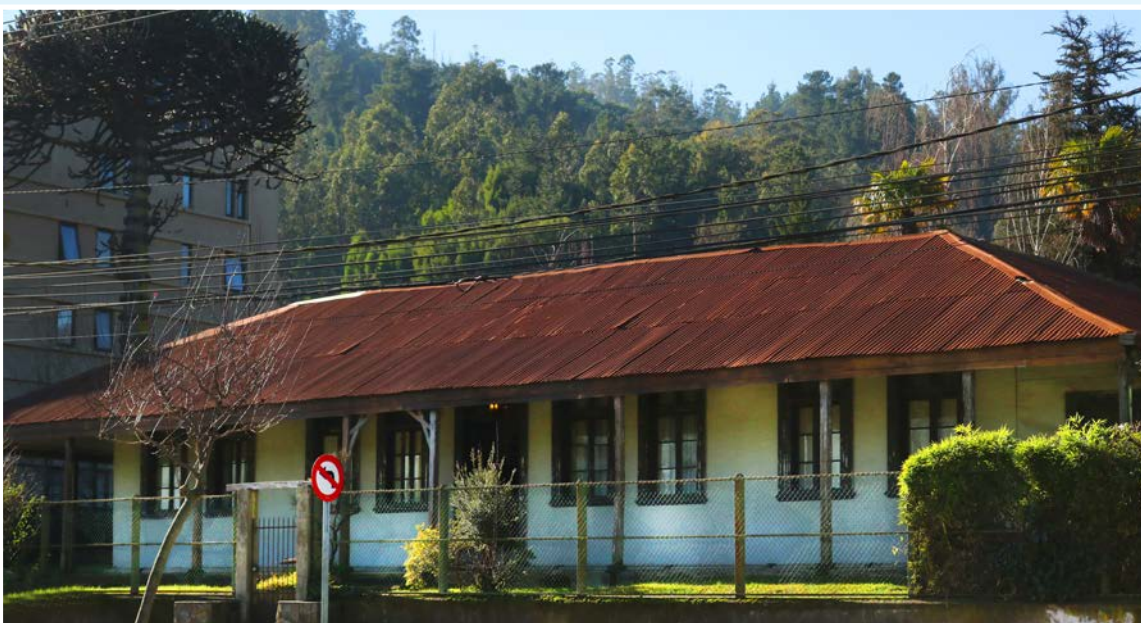
CONSTRUCCIONES más antiguas.