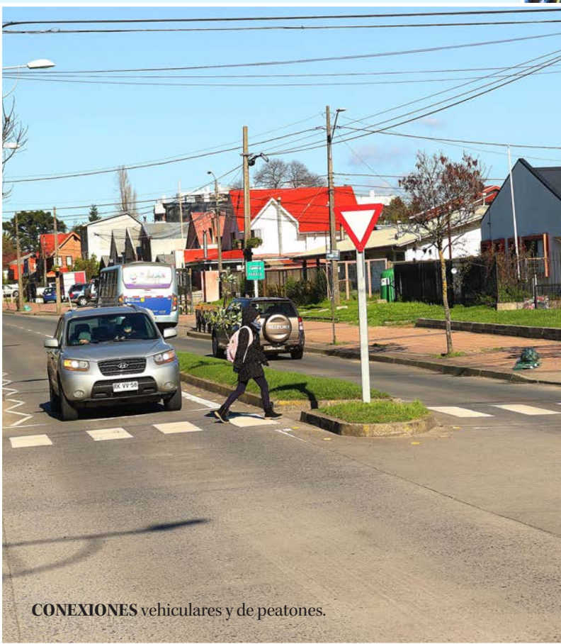
CONEXIONES vehiculares y de peatones.