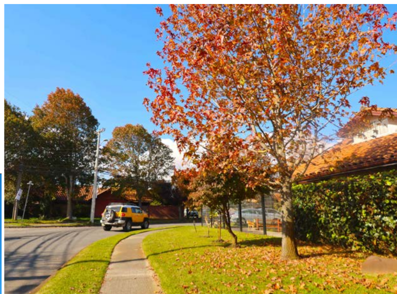
VEREDAS junto a amplios espacios verdes.

Es un símbolo verde de San Pedro de la Paz. Amplias calles y espacios en común son parte de su sello.