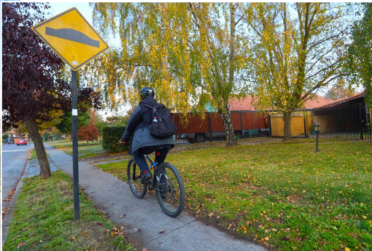
ESPECIAL para el desplazamiento en bicicleta.