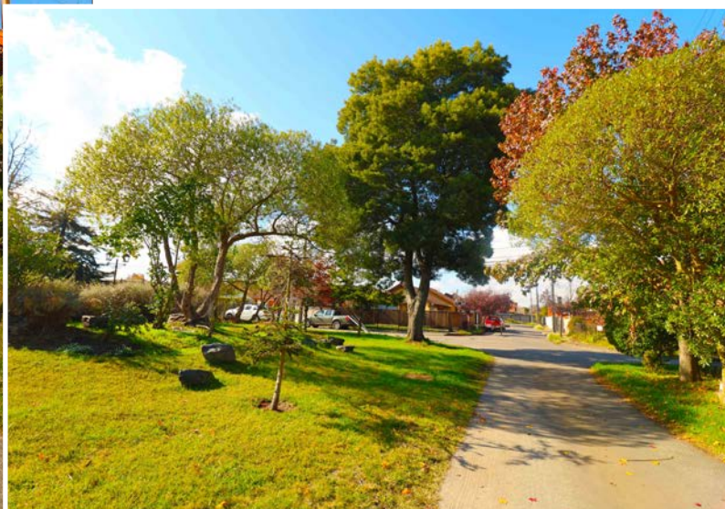
NOTORIA DISTANCIA entre la calle y el acceso a las viviendas.