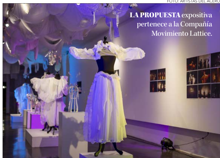
LA PROPUESTA expositiva pertenece a la Compañía Movimiento Lattice.

Twitter @DiarioConcepcion contacto@diarioconcepcion.cl