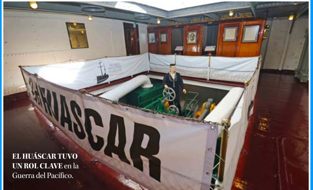
EL HUÁSCAR TUVO UN ROL CLAVE en la Guerra del Pacífico.