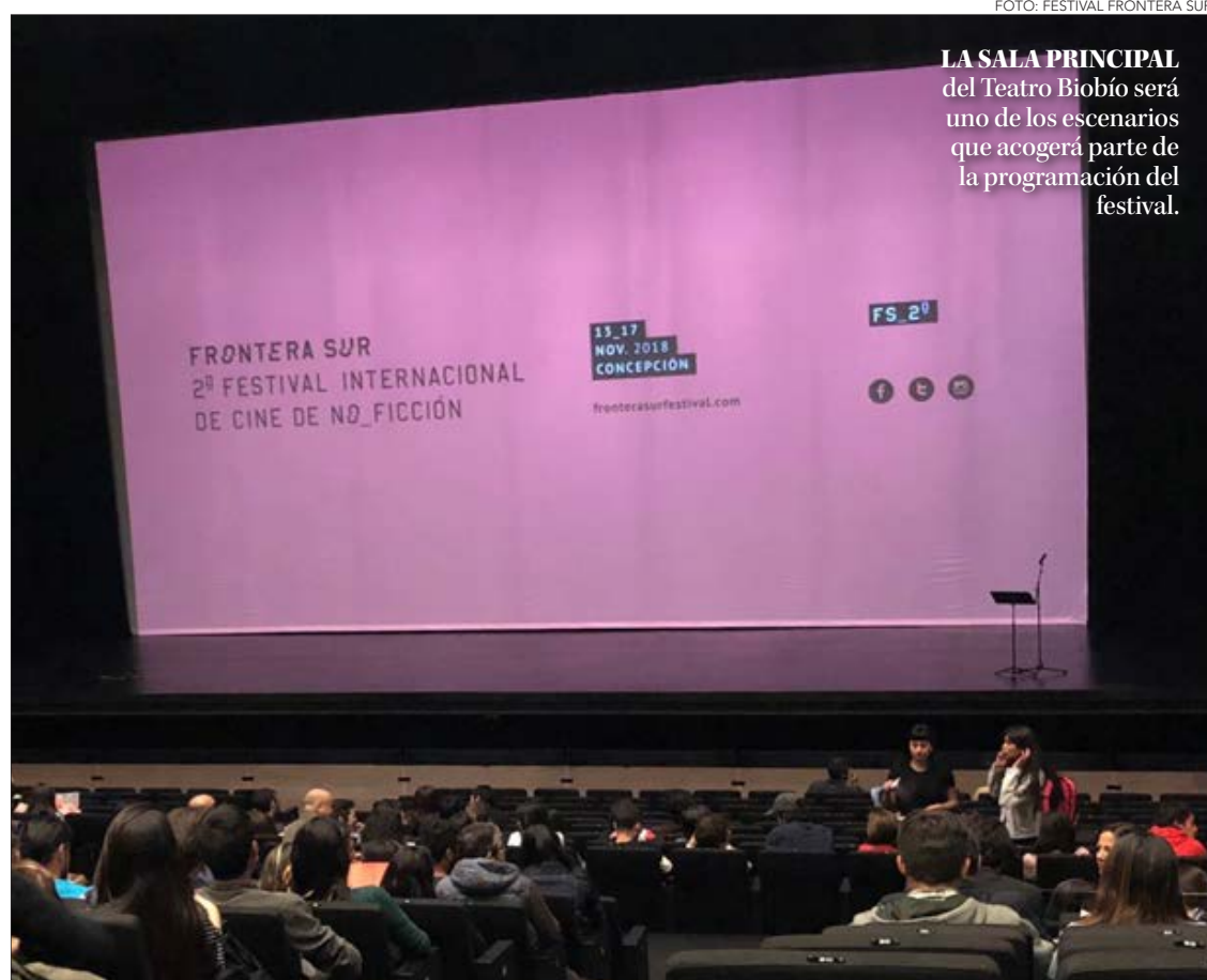
LA SALA PRINCIPAL del Teatro Biobío será uno de los escenarios que acogerá parte de la programación del festival.

Con un total de 84 películas de diversa duración -provenientes de 27 países, incluyendo más de 40 estrenos nacionales- el festival amplía el horizonte creativo, con la experimentación de realizadores que exploran y empujan los límites y lenguajes del cine. El lugar ideal donde diversos públicos, además de cinéfilos y curiosos tienen la oportunidad de ver en pan-