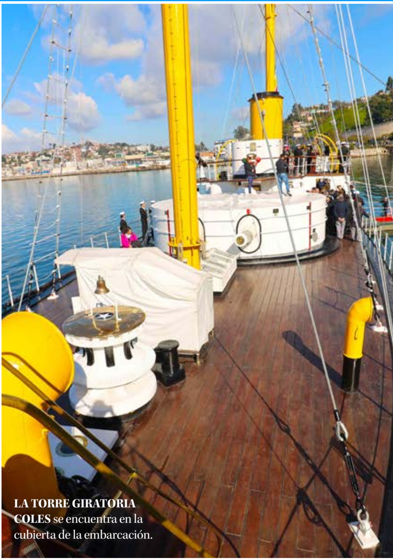
LA TORRE GIRATORIA COLES se encuentra en la cubierta de la embarcación.