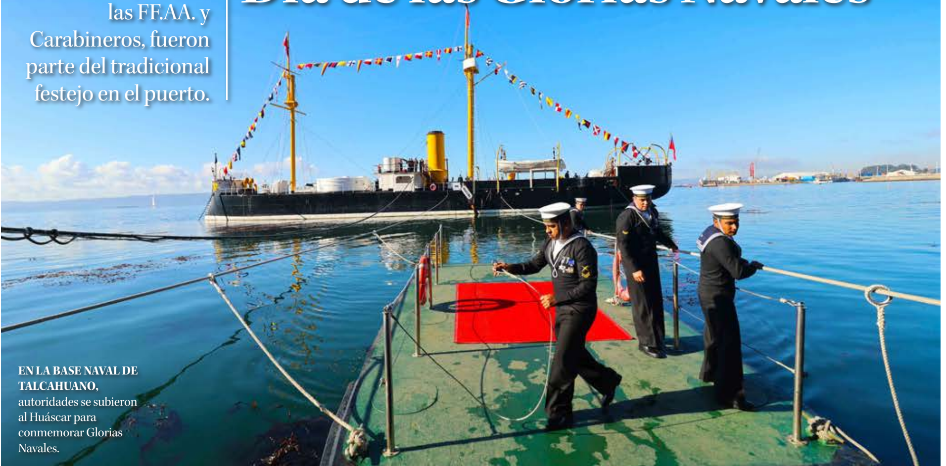
EN LA BASE NAVAL DE TALCAHUANO, autoridades se subieron al Huáscar para conmemorar Glorias Navales.