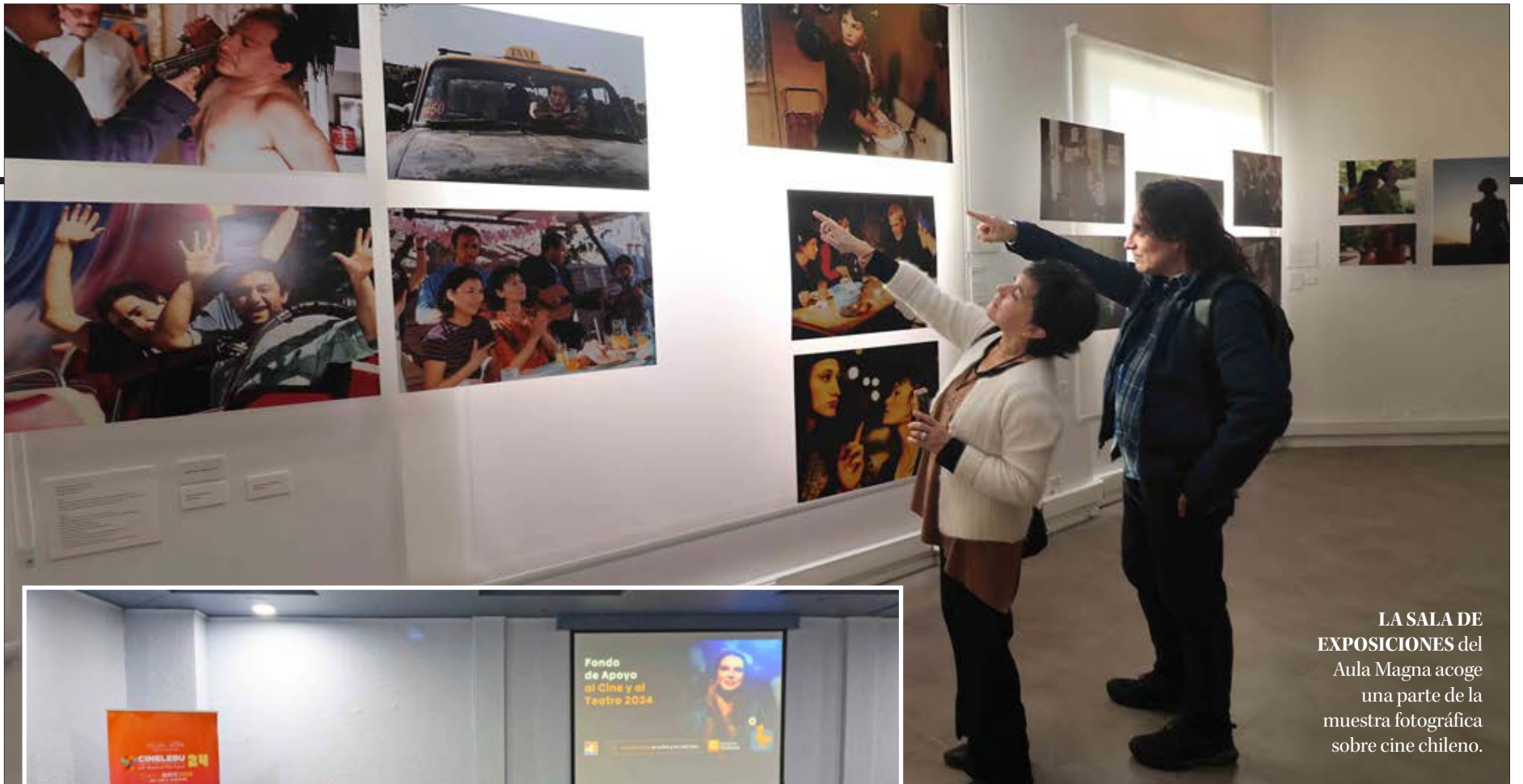
LA SALA DE EXPOSICIONES del Aula Magna acoge una parte de la muestra fotográfica sobre cine chileno.