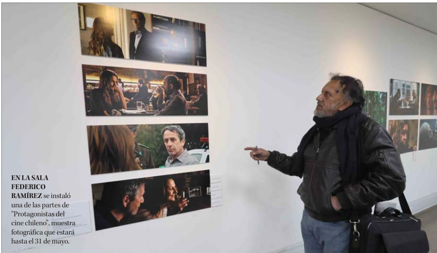
EN LA SALA FEDERICO RAMÍREZ se instaló una de las partes de "Protagonistas del cine chileno", muestra fotográfica que estará hasta el 31 de mayo.

"El programa anterior que teníamos de ayudar al cine conclu-