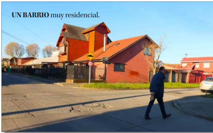
UN BARRIO muy residencial.