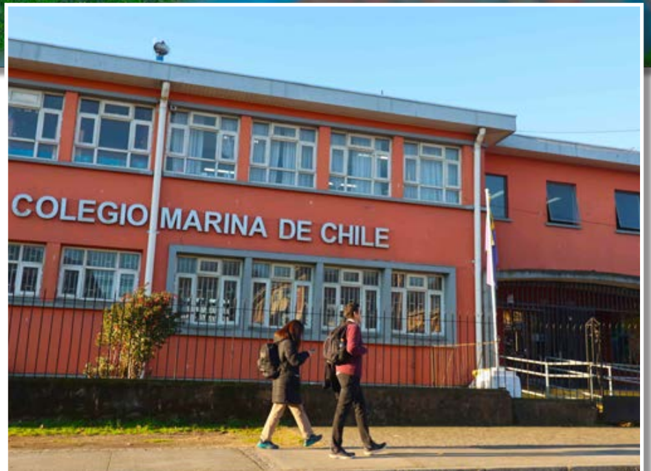
EL EMBLEMÁTICO Marina de Chile.