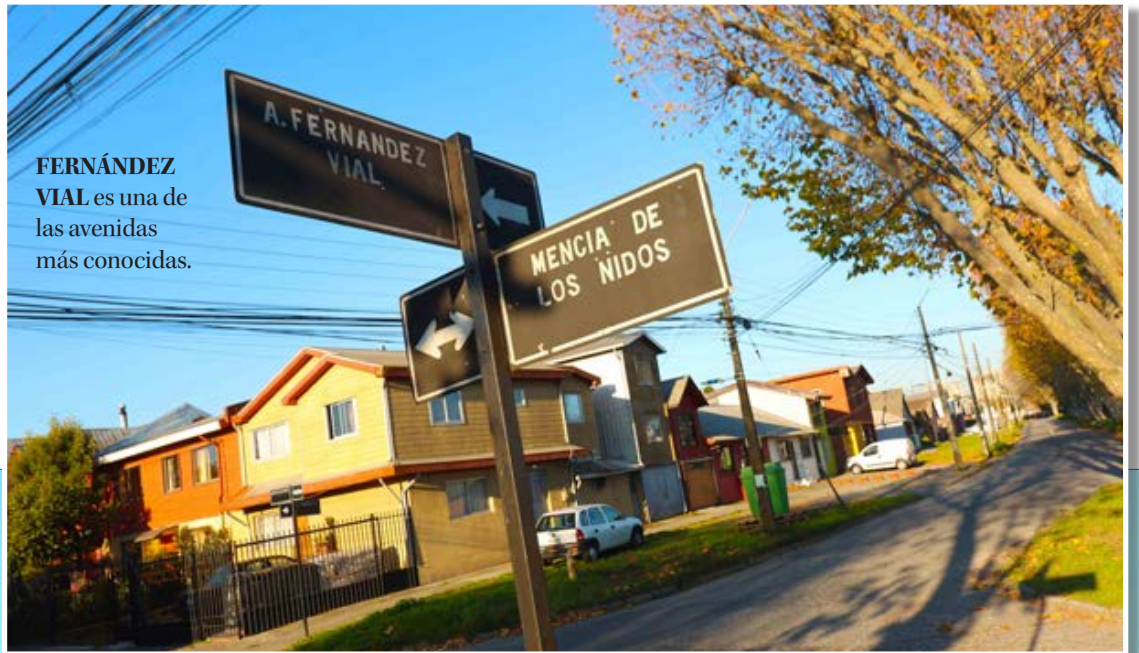
FERNÁNDEZ VIAL es una de las avenidas más conocidas.