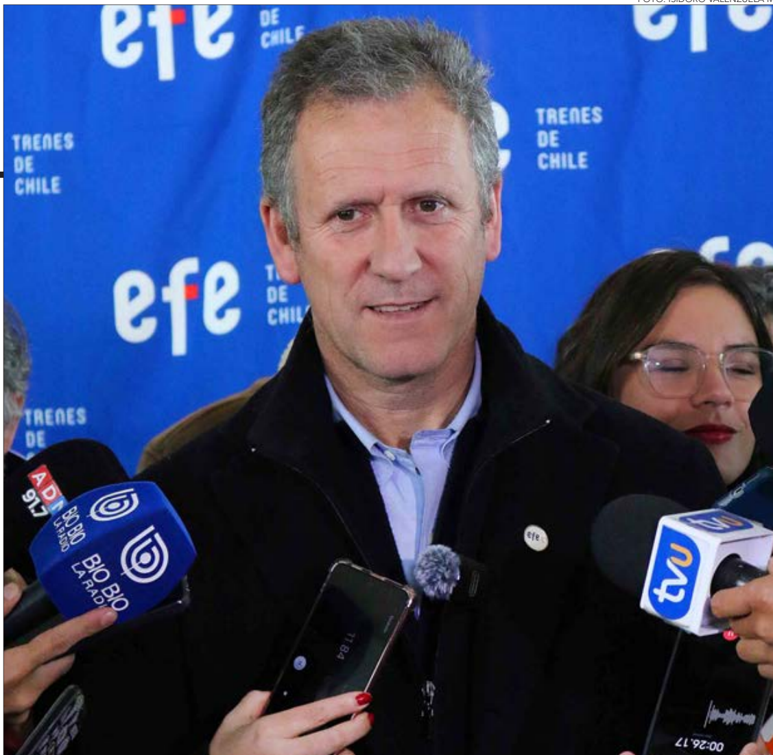
EL MINISTRO DE TRANSPORTES, JUAN CARLOS MUÑOZ, ha sido delegado como mediador por el Gobierno.

cerse presente porque “nos preocupa el empleo y por todas esas consideraciones es que tenemos un ministro acá en la zona haciendo de puente entre las partes para que encuentren un acuerdo de solución. Entendemos las preocupaciones de los trabajadores respecto a despidos y desvinculaciones, no queremos que el desempleo se incremente y también tenemos que escuchar a la empresa respecto de sus preocupaciones”.