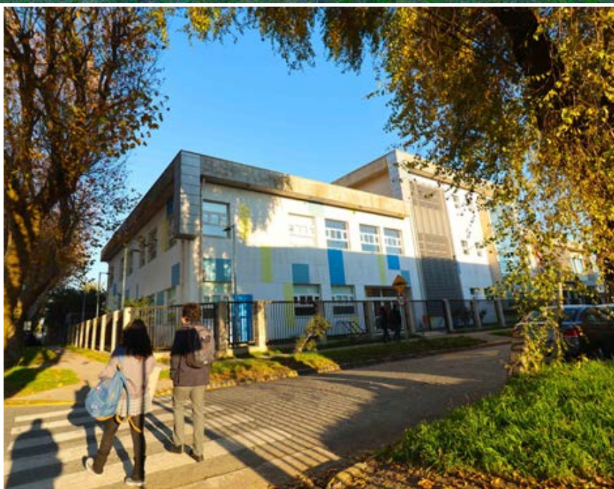
RECINTOS de salud.