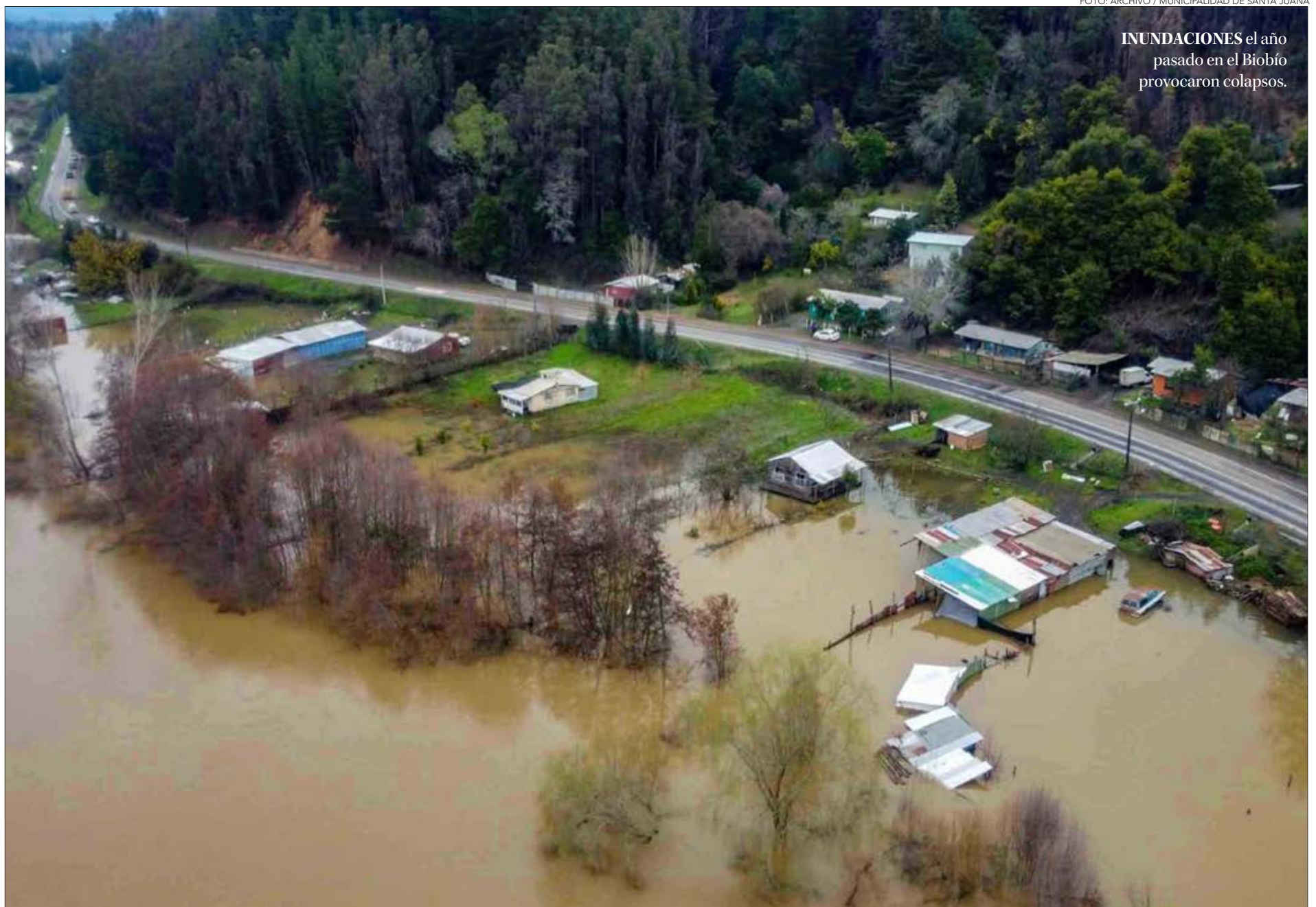
INUNDACIONES el año pasado en el Biobío provocaron colapsos.