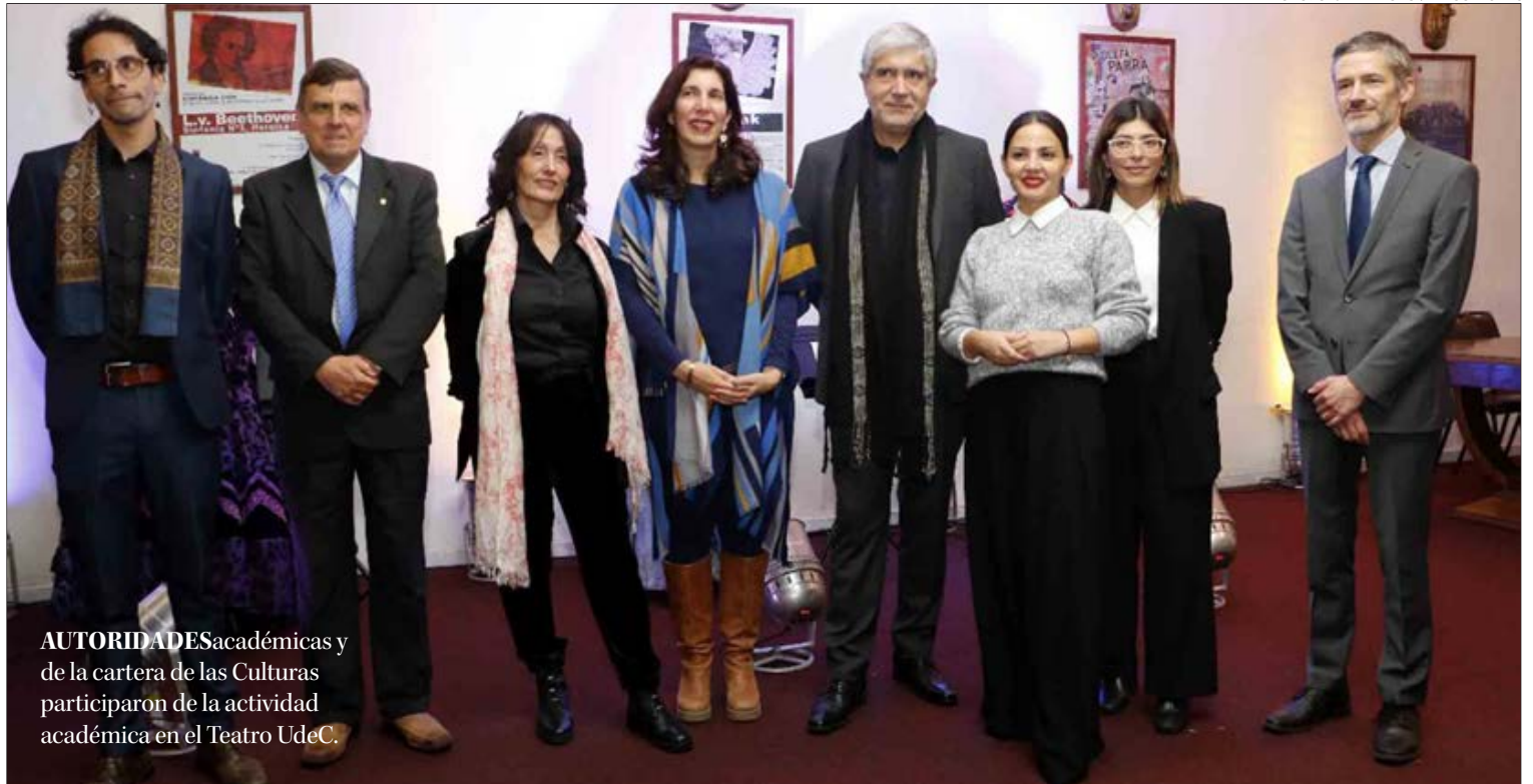
AUTORIDADES académicas y de la cartera de las Culturas participaron de la actividad académica en el Teatro UdeC.

"Existe un espacio muy propicio para la celebración de la actividad