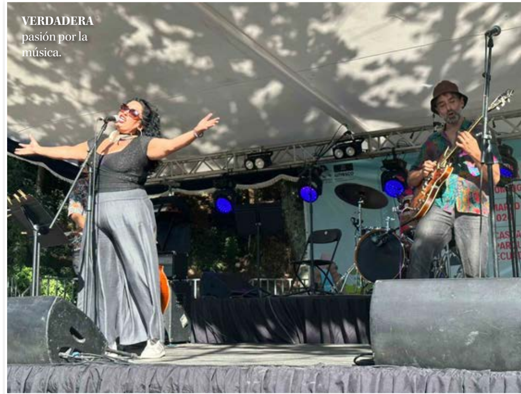
VERDADERA pasión por la música.