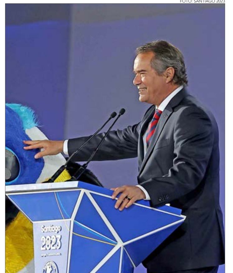
NEVEN ILIC, PRESIDENTE de Panam Sports, dio a conocer la nueva sede de los Panamericanos y Parapanamericanos de 2027.