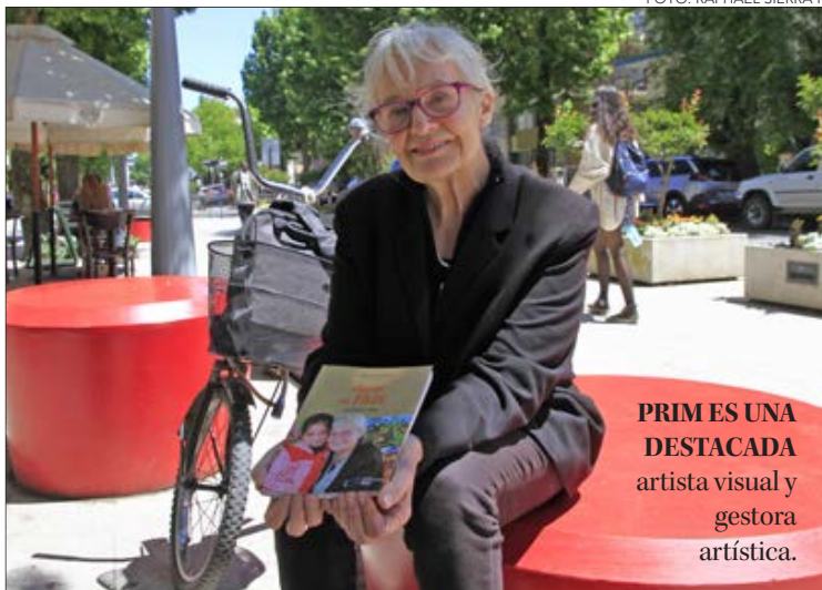
PRIM ES UNA DESTACADA artista visual y gestora artística.