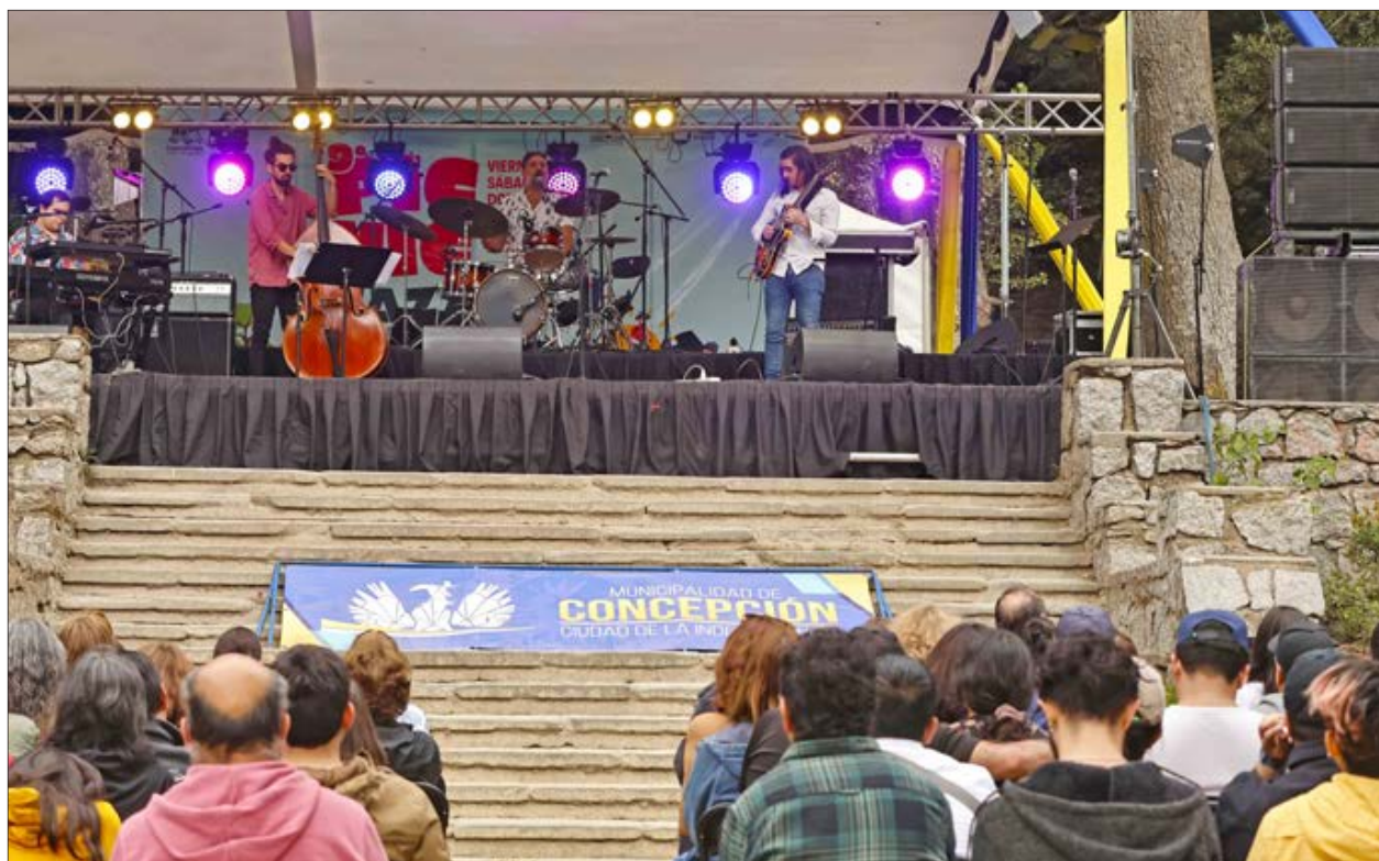
DURANTE tres jornadas se llevó adelante el evento.