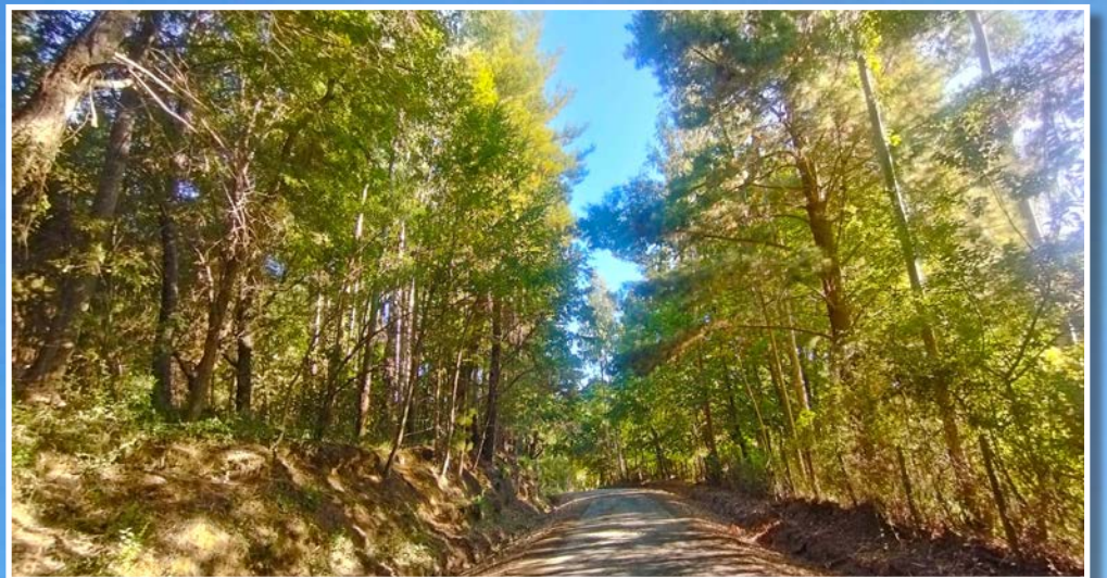
CAMINOS INTERIORES totalmente frondosos.