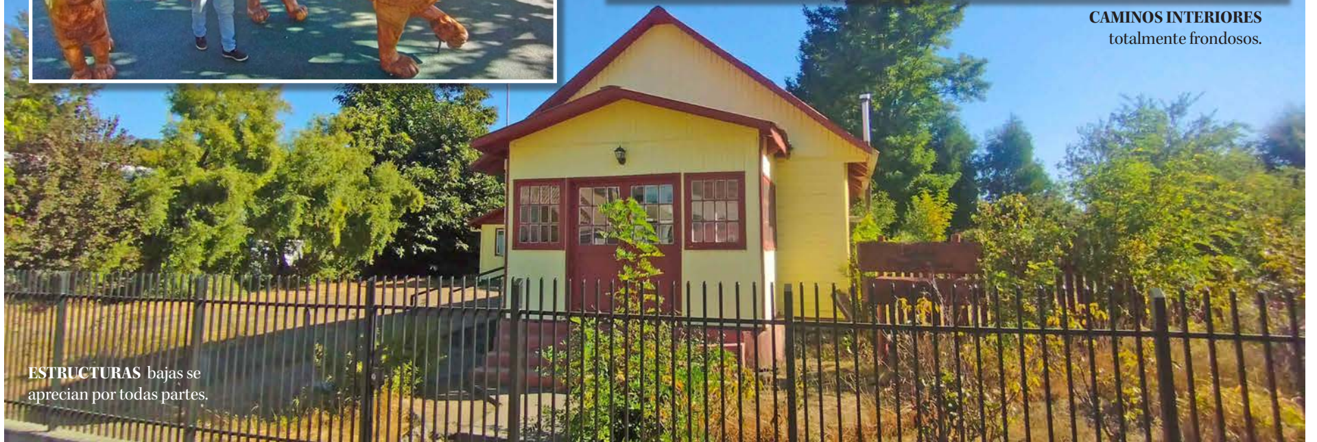
ESTRUCTURAS bajas se aprecian por todas partes.