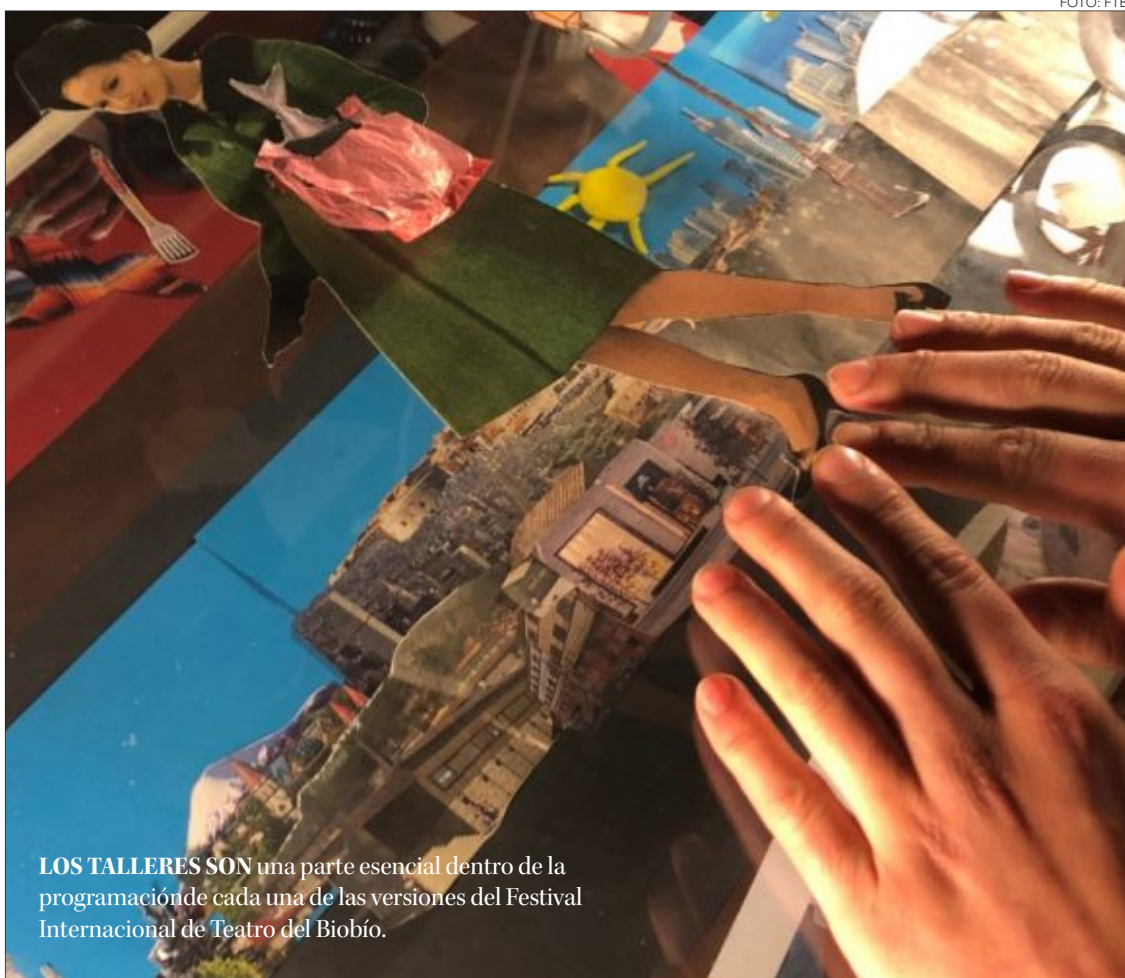
LOS TALLERES SON una parte esencial dentro de la programación de cada una de las versiones del Festival Internacional de Teatro del Biobío.

Tal como ha sido la tónica en sus últimas versiones, el inicio de la temporada 2024 de FTB será con 6 talleres dirigidos a profesionales y adeptos a las artes escénicas de un