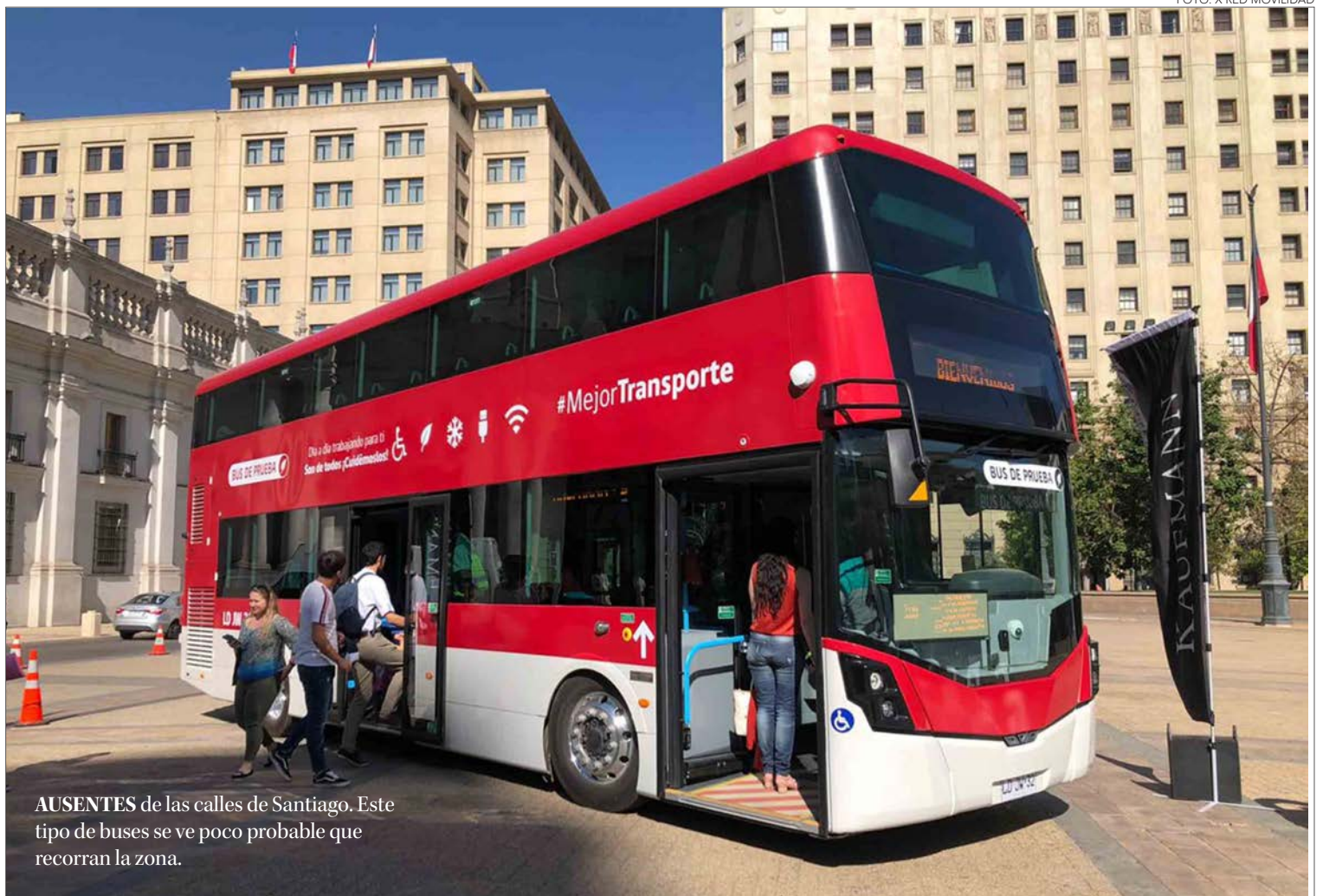
AUSENTES de las calles de Santiago. Este tipo de buses se ve poco probable que recorran la zona.