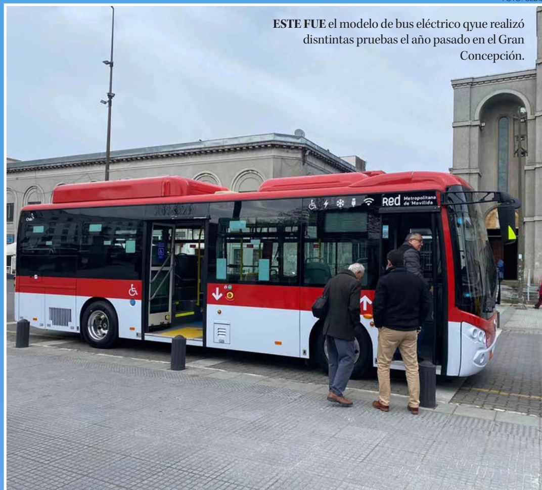
ESTE FUE el modelo de bus eléctrico que realizó distintas pruebas el año pasado en el Gran Concepción.

Además de la adquisición de los buses se deben construir dos centros de carga para esta flota, desafío no menor porque significa encontrar los terrenos adecuados para