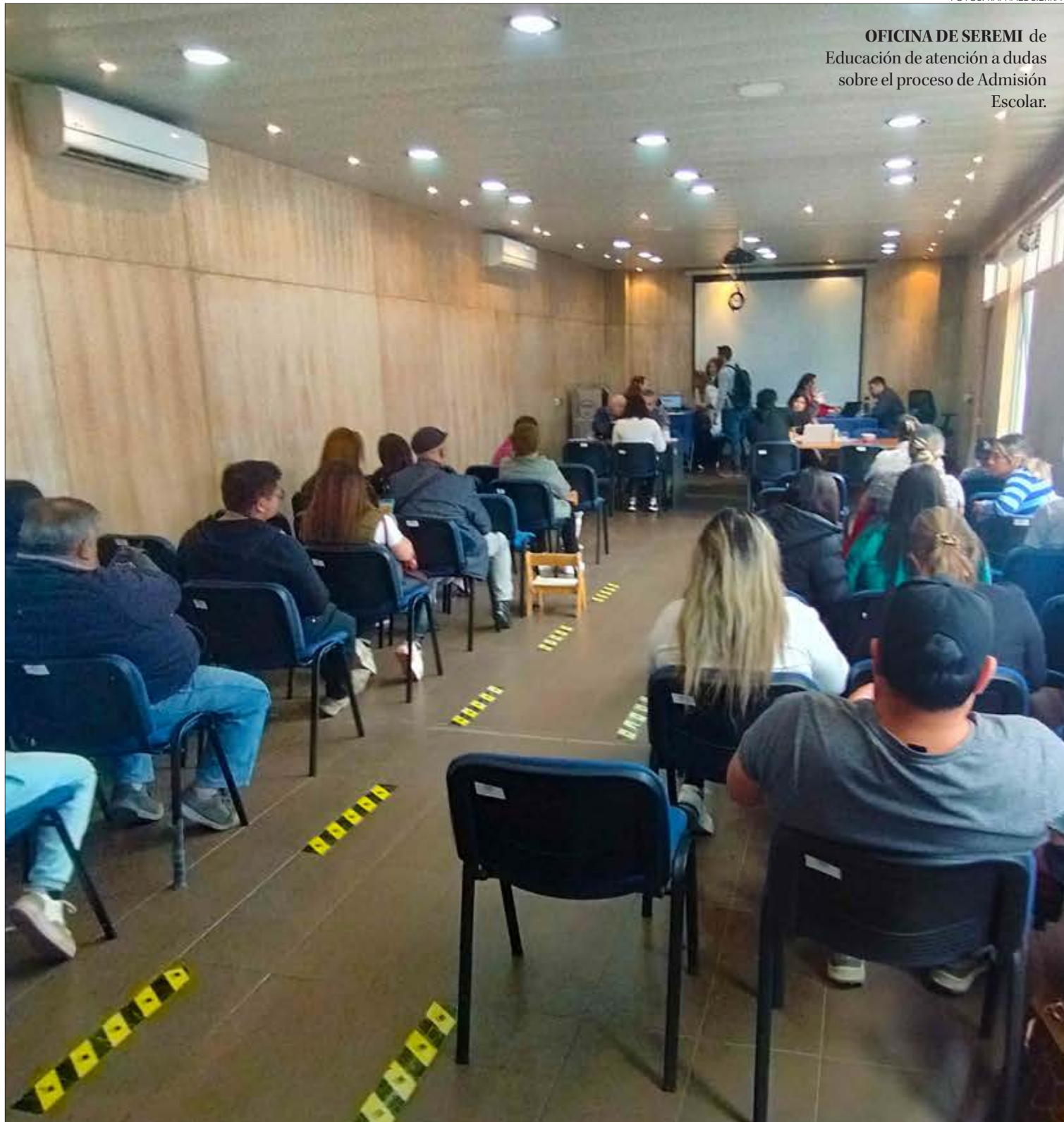
OFICINA DE SEREMI de Educación de atención a dudas sobre el proceso de Admisión Escolar.