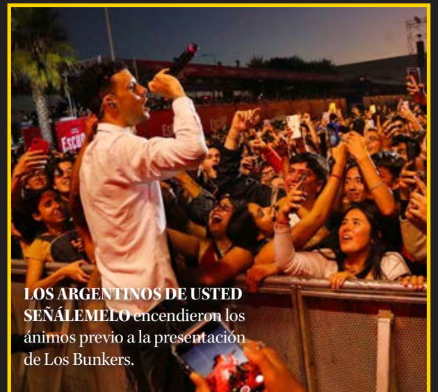
LOS ARGENTINOS DE USTED SEÑÁLEMELO encendieron los ánimos previo a la presentación de Los Bunkers.

Fue una jornada para el recuerdo e historia de este evento masivo gratuito, que por medio de propuestas de diversos estilos convocó a cerca de 150 mil personas.