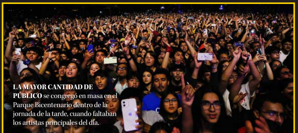
LA MAYOR CANTIDAD DE PÚBLICO se congregó en masa en el Parque Bicentenario dentro de la jornada de la tarde, cuando faltaban los artistas principales del día.