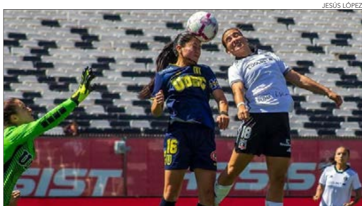
CAMPANIL VIENE de una dura derrota ante Colo Colo en Santiago.