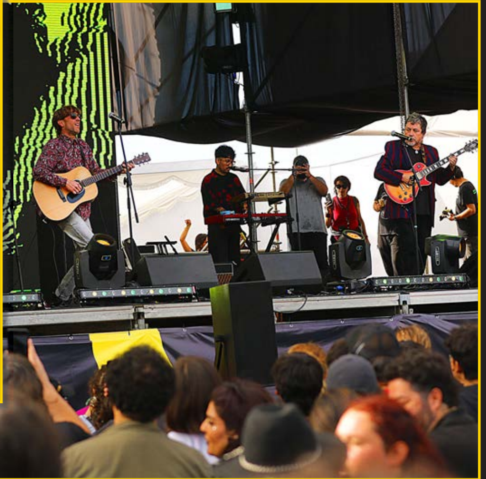
El Teatro Biobío, en su escenario principal, recibió a una variedad de propuestas musicales, las que fueron transmitidas a través de TVU.