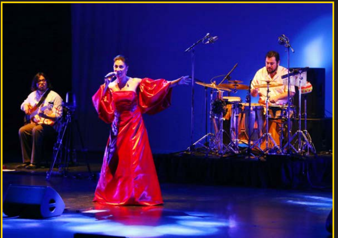
LA CANARITO Y SURCOS se hizo presente sobre el escenario principal del Teatro Biobío, siendo uno de los números más masivos y esperados del primer día de REC.

Twitter @DiarioConce contacto@diarioconcepcion.cl