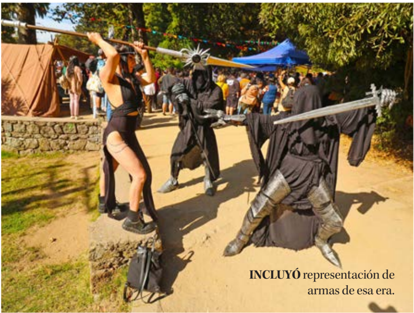
INCLUYÓ representación de armas de esa era.