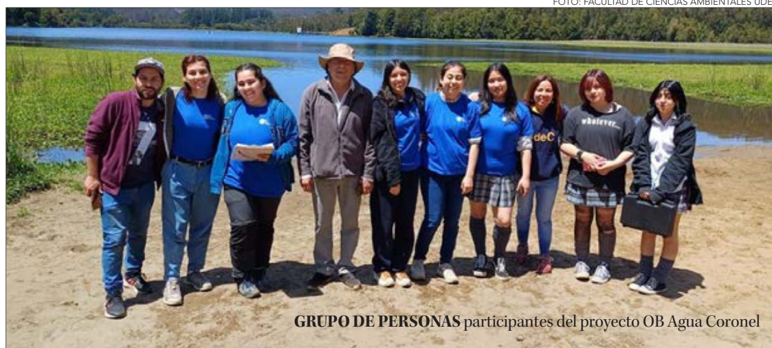
GRUPO DE PERSONAS participantes del proyecto OB Agua Coronel

La profesora añadió que para concientizar educan a los y las estudiantes en cosas tan simples como enseñarles a beber agua con filtro, cómo saber si el agua está pura o no, de las leyes que hoy en día que norman el agua potable y también de la importancia del cuidado del agua.