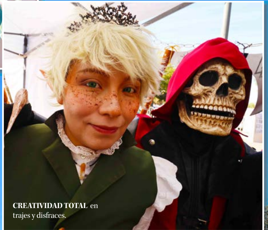
CREATIVIDAD TOTAL en trajes y disfraces.