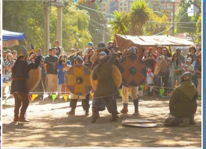
RECREACIÓN de batallas de la época.