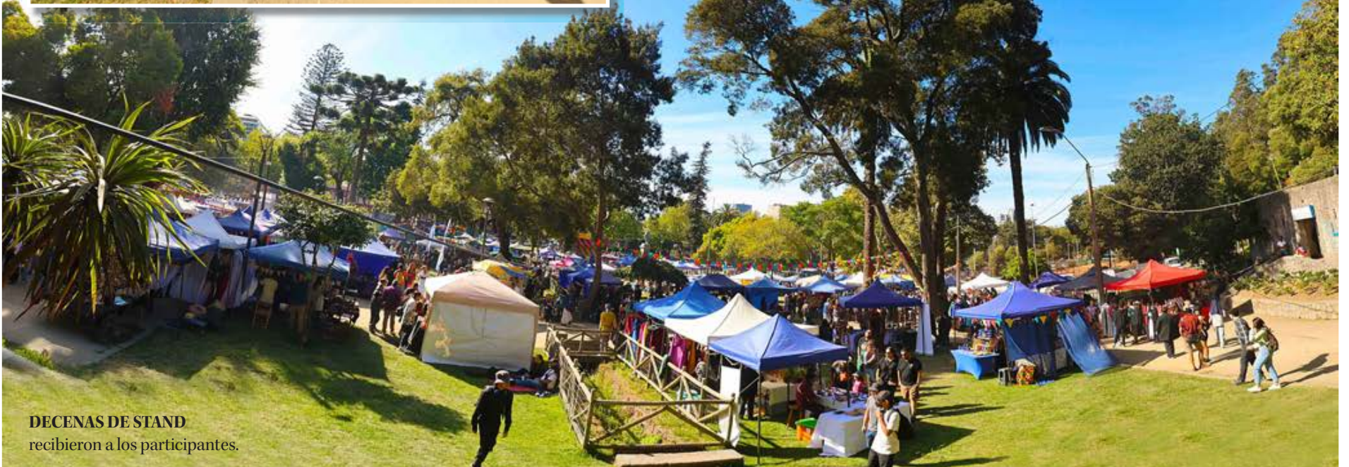
DECENAS DE STAND recibieron a los participantes.