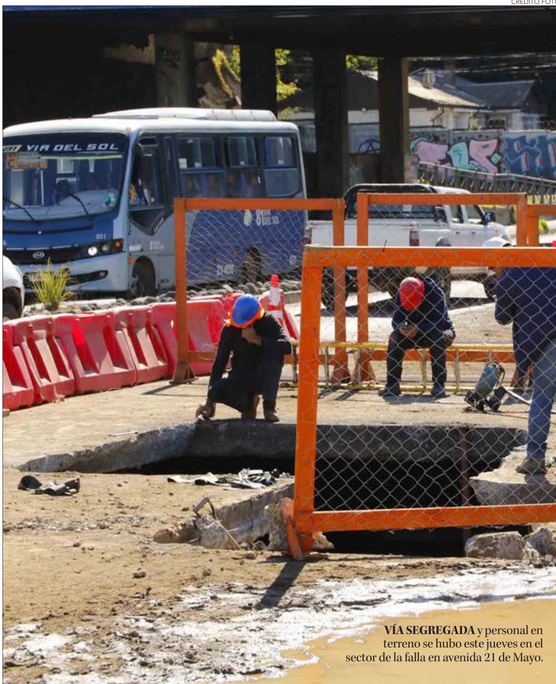
VÍA SEGREGADA y personal en terreno se hubo este jueves en el sector de la falla en avenida 21 de Mayo.

Y es que la molestia persiste en la autoridad comunal y en los representantes vecinales que critican la manera en que la sanitaria ha enfrentado todo este episodio, como lo remarcó el alcalde penquista, quien reiteró la solicitud de que se aplique la ley contra Essbio.