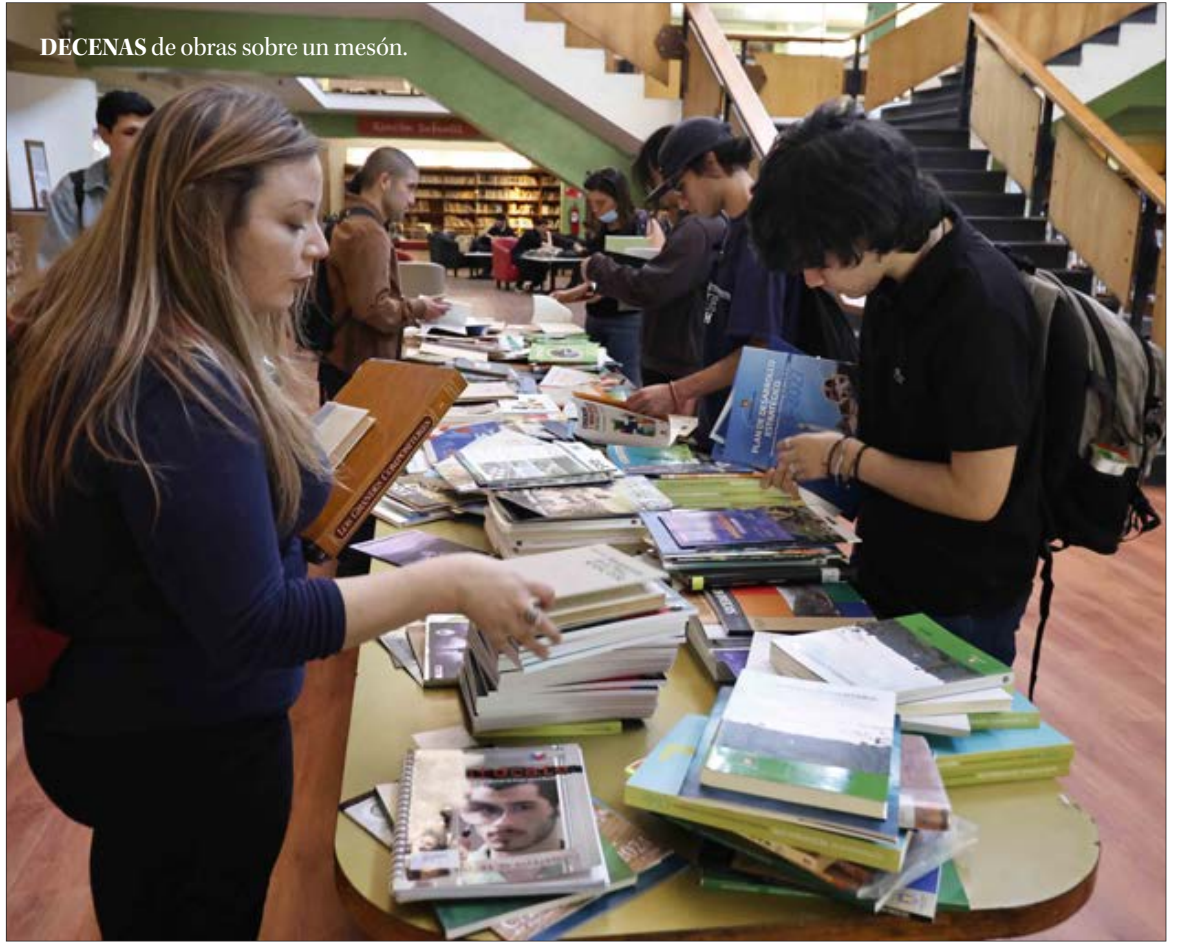
DECENAS de obras sobre un mesón.

Cientos de obras pudieron ser adquiridas por visitantes y usuarios de este espacio que se ubica junto al Parque Ecuador de Concepción.