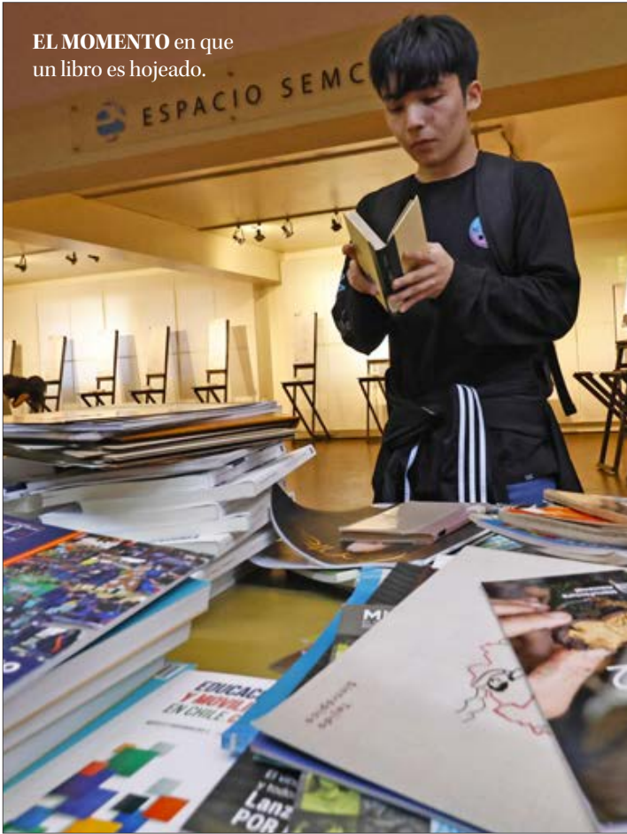
EL MOMENTO en que un libro es hojeado.