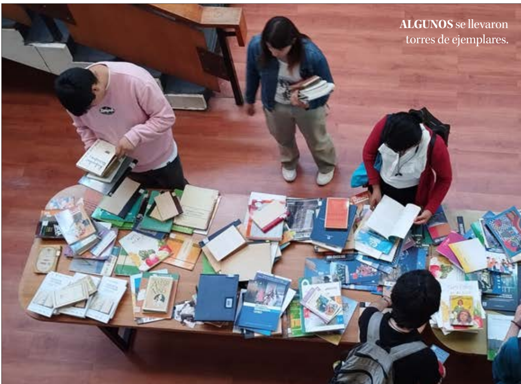
ALGUNOS se llevaron torres de ejemplares.