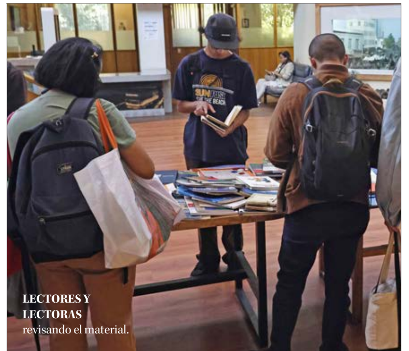
LECTORES Y LECTORAS revisando el material.