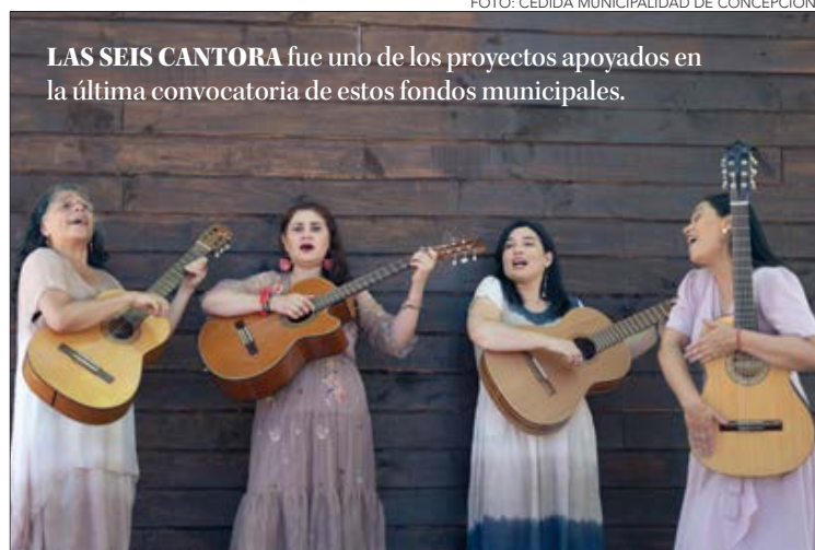
LAS SEIS CANTORA fue uno de los proyectos apoyados en la última convocatoria de estos fondos municipales.