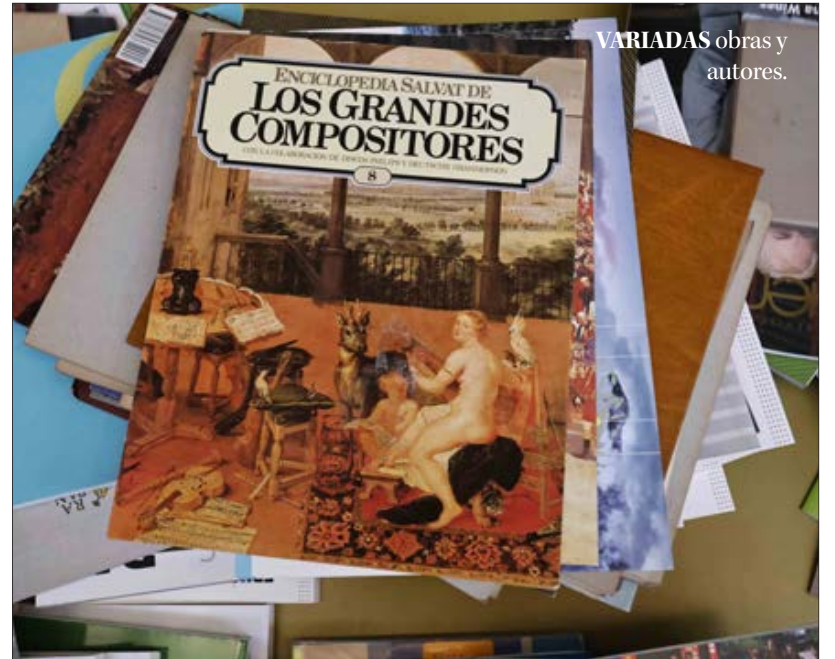
VARIADAS obras y autores.