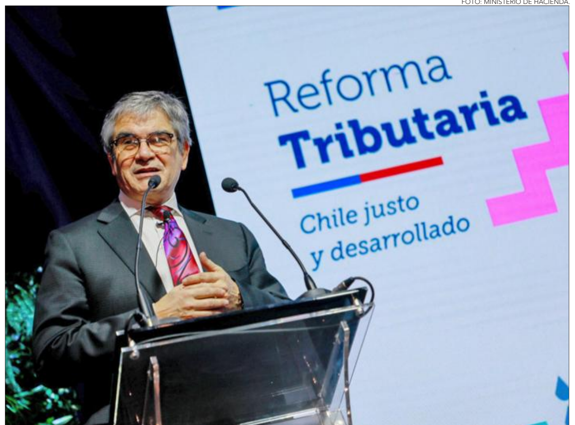
MINISTRO DE HACIENDA, Mario Marcel.