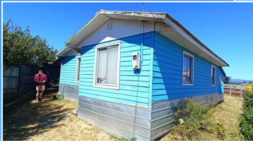
CASA CERRO LA VÍRGEN. Algunas viviendas son ofrecidas como cabañas para los veraneantes. Cabe mencionar que parte del Cerro La Virgen en Arauco también se vio afectado por los incendios forestales de 2023.