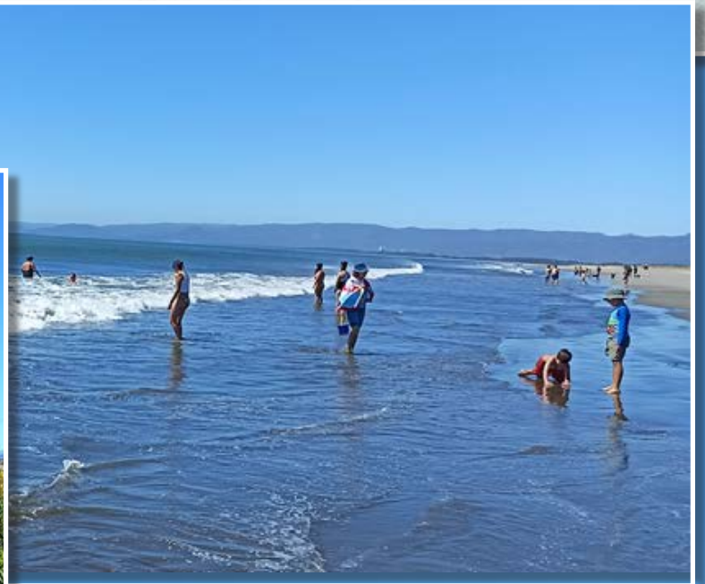
ULTIMOS DIAS DEL VERANO. Familias siguen disfrutando de las playas en Arauco aunque ya inició el año escolar, pero los fines de semana es posible continuar con la actividad de turismo.