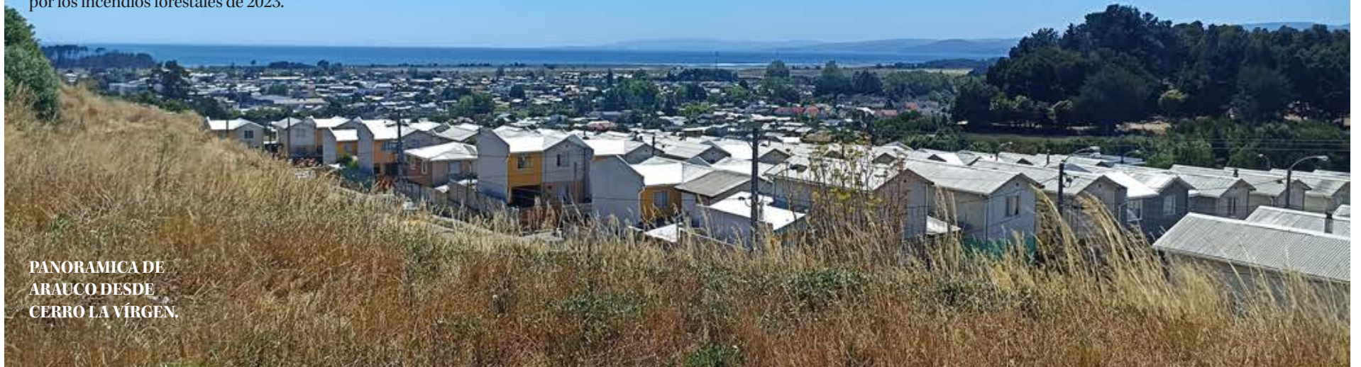
PANORAMICA DE ARAUCO DESDE CERRO LA VÍRGEN.