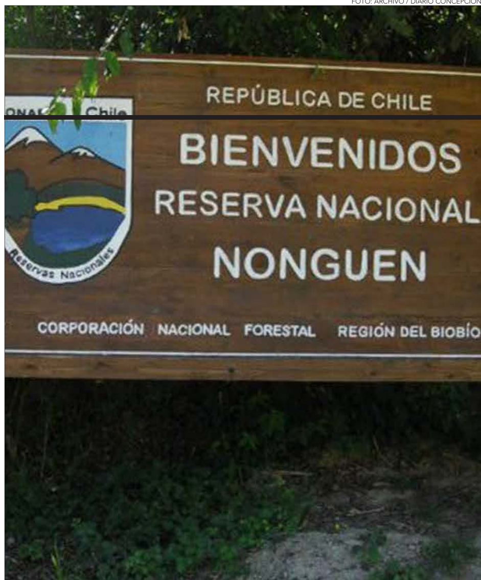
PROPUESTA DE RAMAL 3 del proyecto pasa a 586 metros del límite del Parque Nacional Nonguén, dentro del polígono de paisaje de conservación.

(Pladeco) en el eje estratégico de Medio Ambiente”.