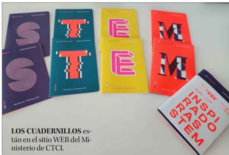
LOS CUADERNILLOS están en el sitio WEB del Ministerio de CTCL.

pero a las niñas y adolescentes les puedo decir que yo he logrado mis metas y ellas también las podrán lograr con disciplina responsabilidad, ética, trabajo en grupo, saber escuchar y con empatía”. Y enfatiza que “para mí ha sido súper importante pensar siempre que soy capaz, conociendo mis limitaciones”.