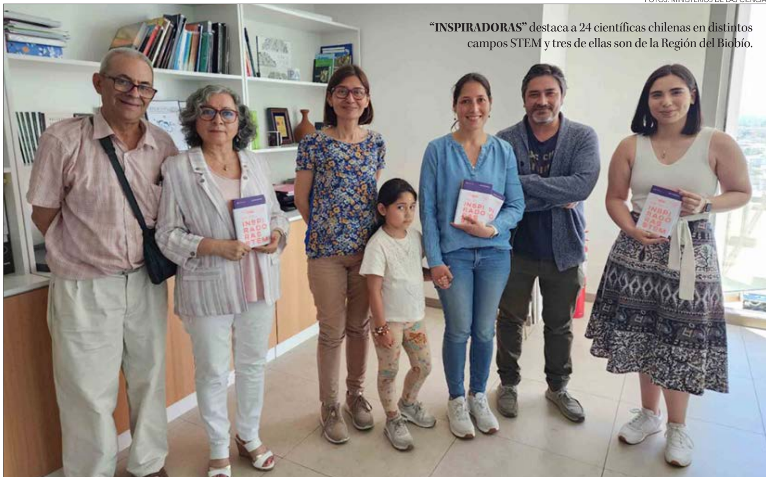
“INSPIRADORAS” destaca a 24 científicas chilenas en distintos campos STEM y tres de ellas son de la Región del Biobío.

En este sentido, plantea que “STEM es un mundo complejo”,