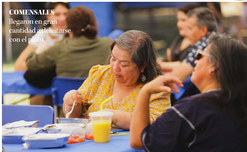
COMENSALES llegaron en gran cantidad a deleitarse con el plato.