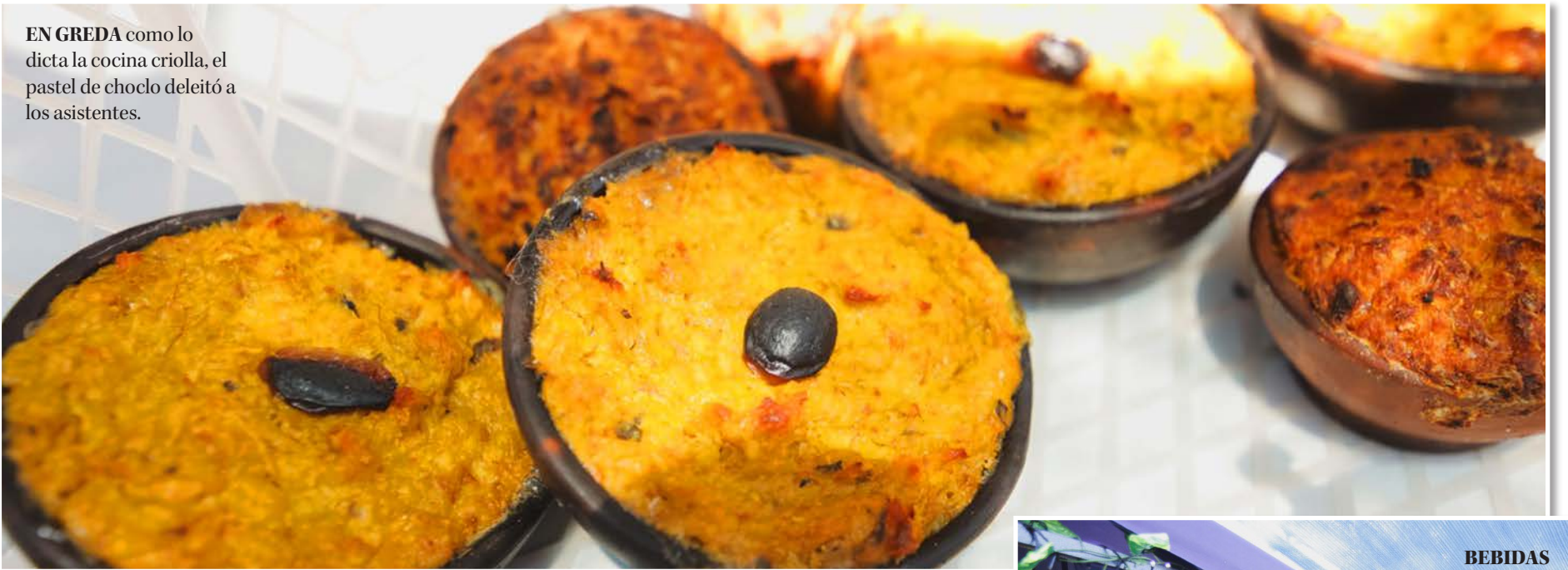
EN GREDA como lo dicta la cocina criolla, el pastel de choclo deleitó a los asistentes.