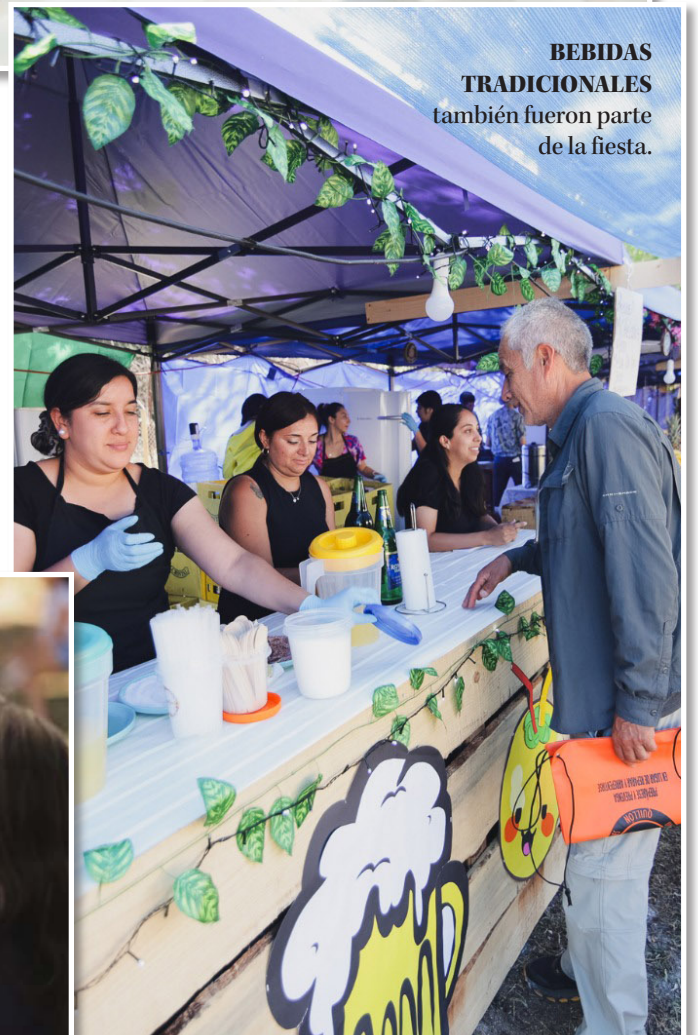
BEBIDAS TRADICIONALES también fueron parte de la fiesta.

A casi un año del incendio forestal que arrasó con el 43 por ciento de la superficie total de la comuna- balneario y al propio Santa Ana de Caimaco, vecinos del sector realizaron nueva celebración, con más de 2 mil ejemplares del tradicional plato chileno.