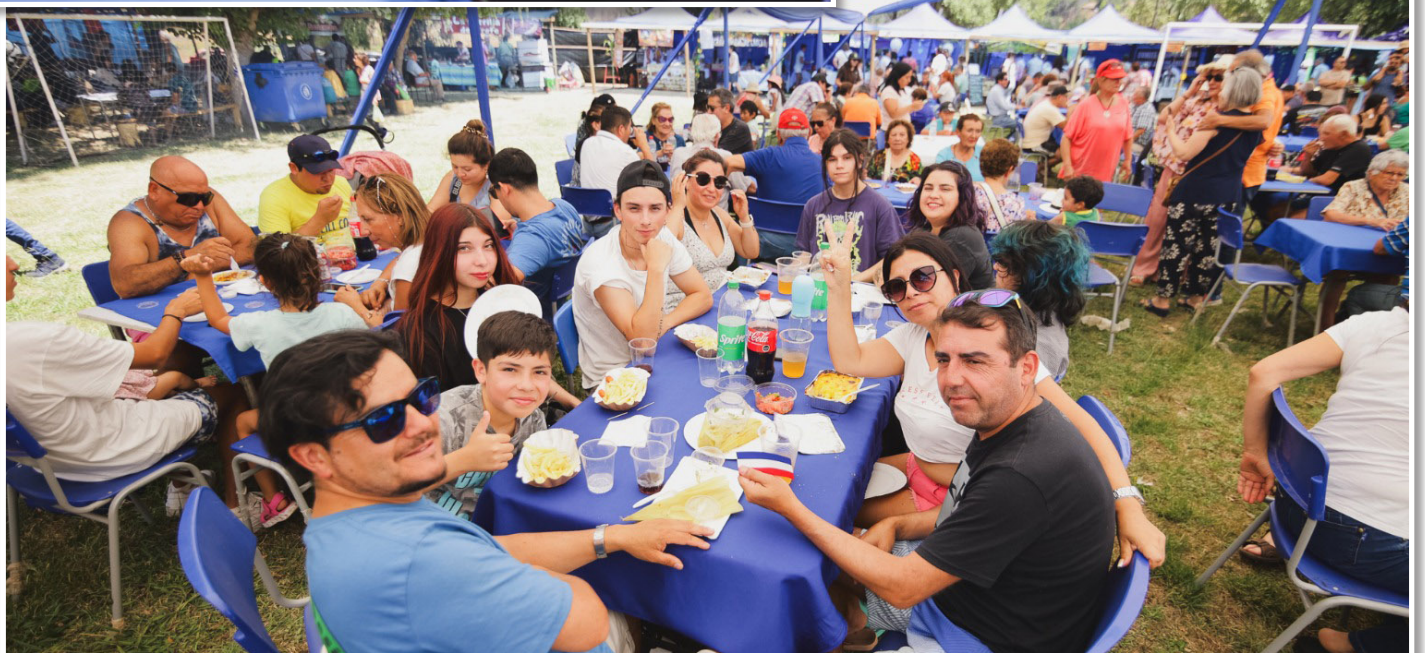
FAMILIAS se tomaron la fiesta en Quillón.