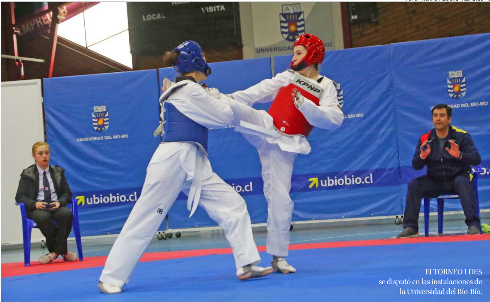
EL TORNEO LDES se disputó en las instalaciones de la Universidad del Bío-Bío.

nal, si es que hablamos del ambiente universitario, yo creo que está un poquito al debe, debería masificarse un poco más en las universidades. Se genera un buen grupo, los profesores nos conocemos todos y hay un buen ambiente en ese sentido. Pero este año varias de las casas de estudios estuvieron con poca cantidad de gente, yo creo que también este efecto de tener poca competencia igual afecta. Me parece que hay que hacernos más masivos y conocidos, no somos tan conocidos en el ambiente universitario”, analizó el entrenador.