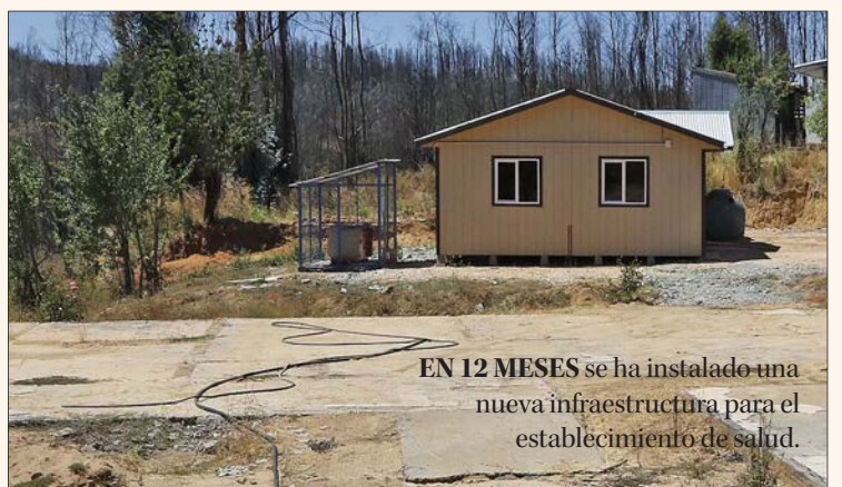
EN 12 MESES se ha instalado una nueva infraestructura para el establecimiento de salud.

OPINIONES Twitter @DiarioConce contacto@diarioconcepcion.cl