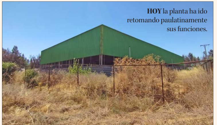
HOY la planta ha ido retomando paulatinamente sus funciones.