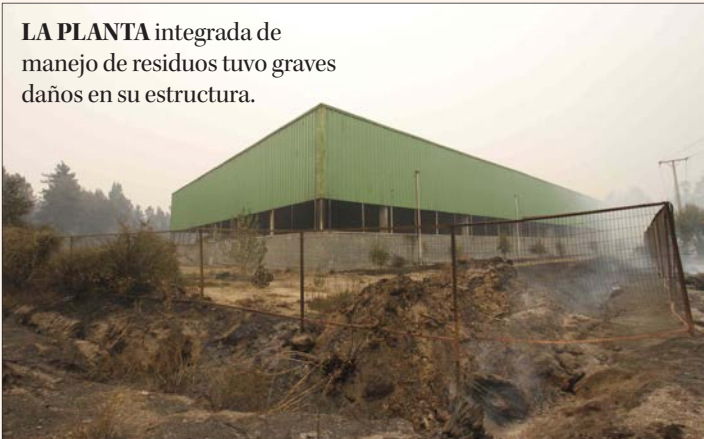
LA PLANTA integrada de manejo de residuos tuvo graves daños en su estructura.