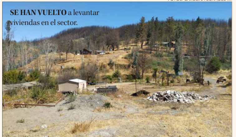
SE HAN VUELTO a levantar viviendas en el sector.