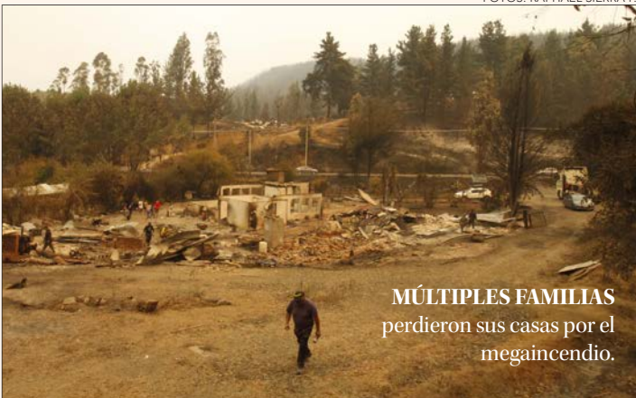
MÚLTIPLES FAMILIAS perdieron sus casas por el megaincendio.