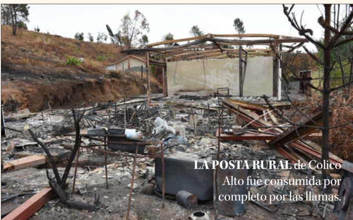
LA POSTA RURAL de Colico Alto fue consumida por completo por las llamas.

Diario Concepción contacto@diarioconcepcion.cl