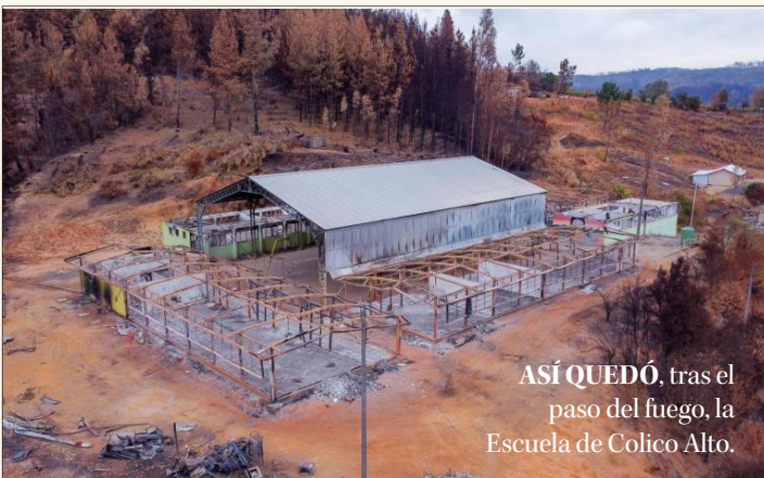
ASÍ QUEDÓ, tras el paso del fuego, la Escuela de Colico Alto.