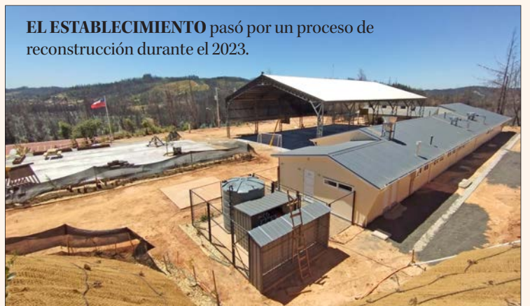
EL ESTABLECIMIENTO pasó por un proceso de reconstrucción durante el 2023.