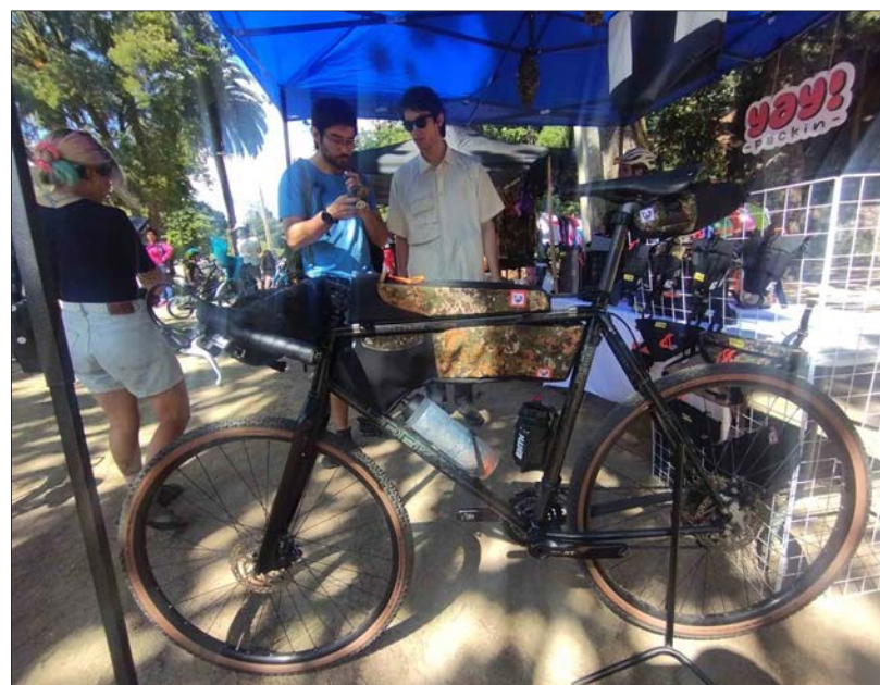
INDUMENTARIA ESPECIAL para el desplazamiento de tramos largos.