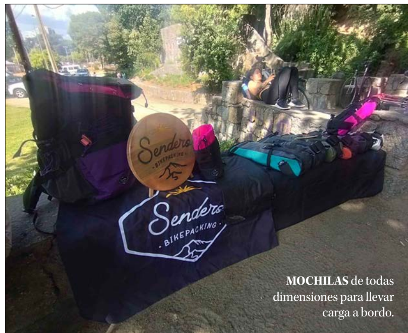
MOCHILAS de todas dimensiones para llevar carga a bordo.

En el sector “La Cascada” del Parque Ecuador, decenas de personas se dieron cita en la feria de asesoría, y venta de accesorios y repuestos.