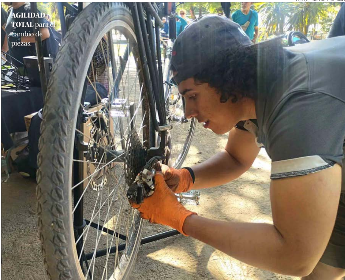
AGILIDAD TOTAL para el cambio de piezas.