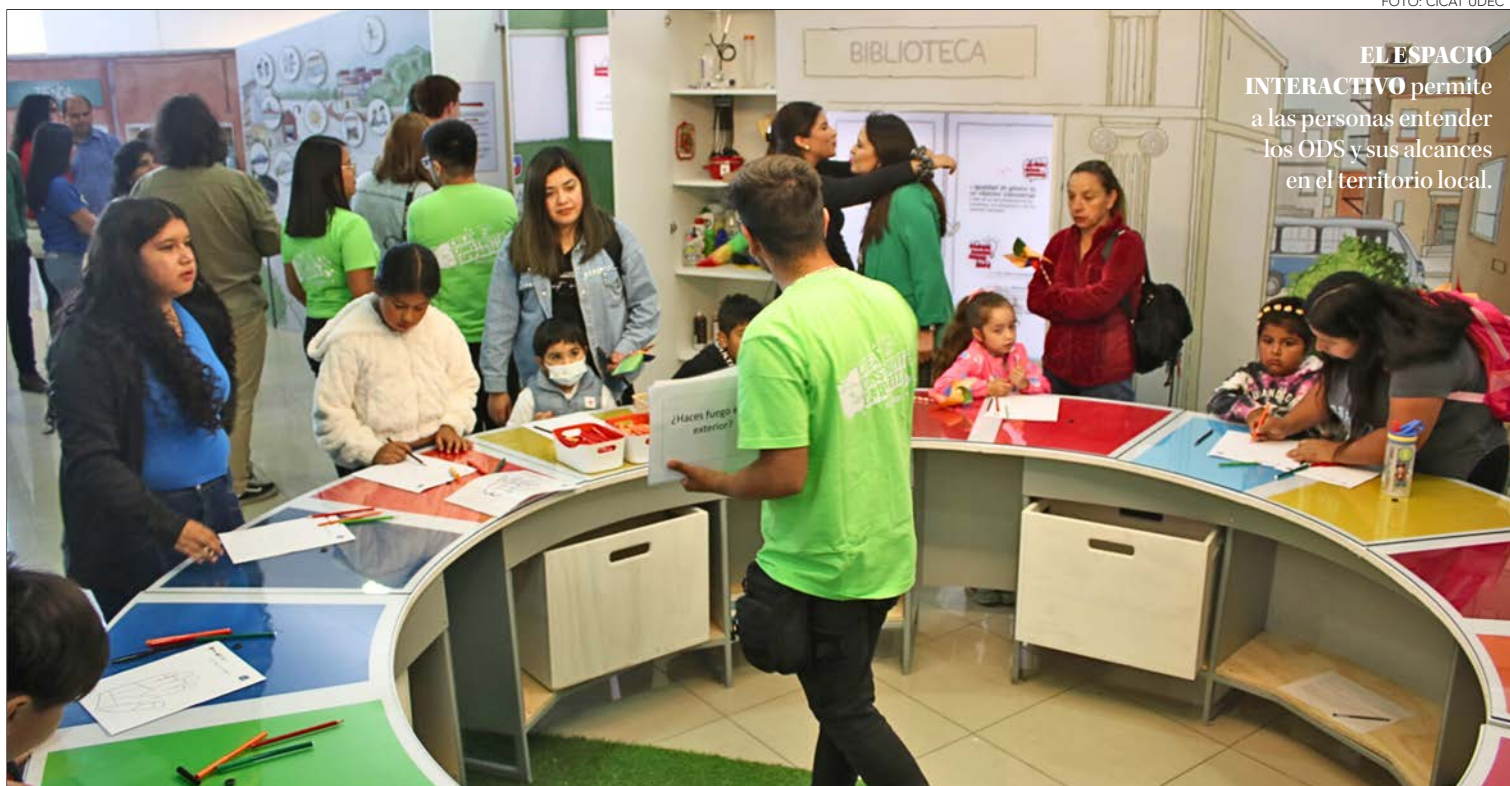
“ACCIÓN ODS: EL FUTURO SERÁ SOSTENIBLE” ES LA NUEVA MUESTRA DISPONIBLE

“Creo que el trabajo de acercar a la comunidad cuáles son los ODS