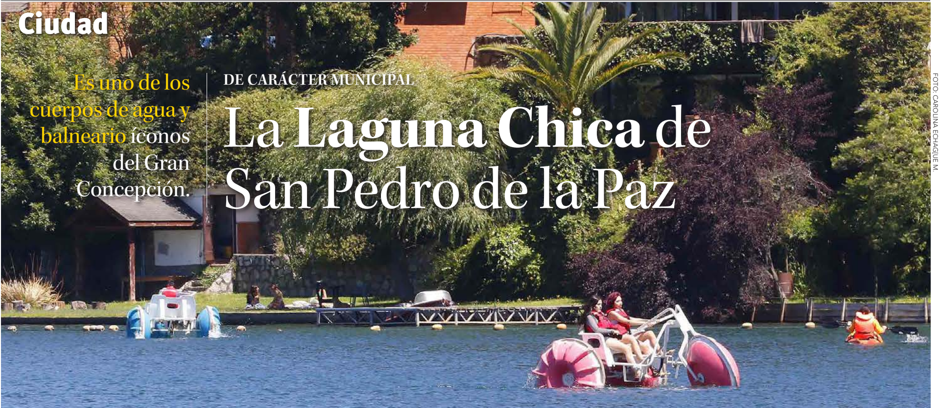
DEPORTES acuáticos en el lugar.