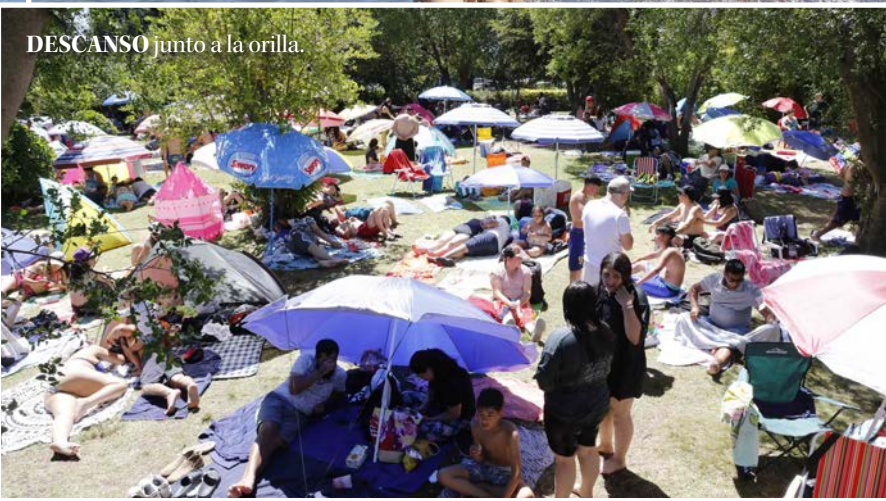
DESCANSO junto a la orilla.