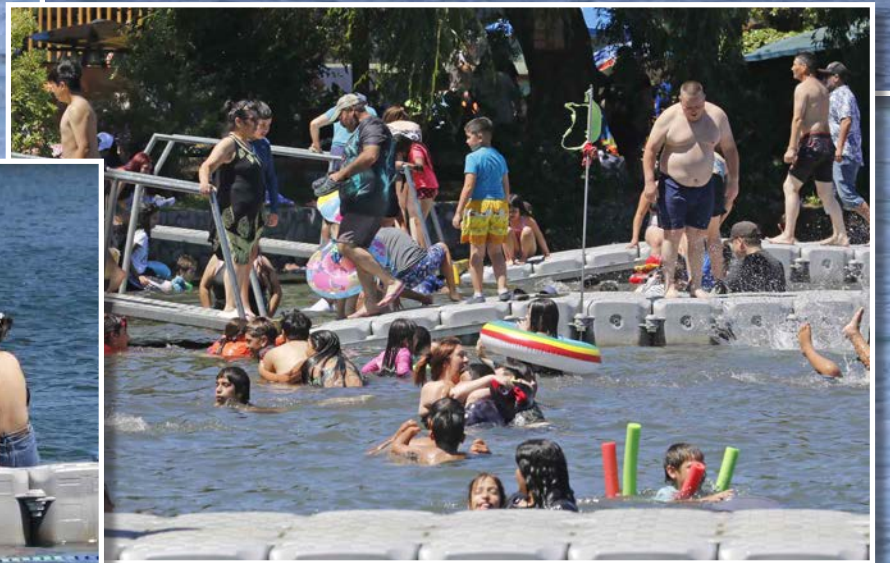
MUCHO PÚBLICO durante todo el verano.