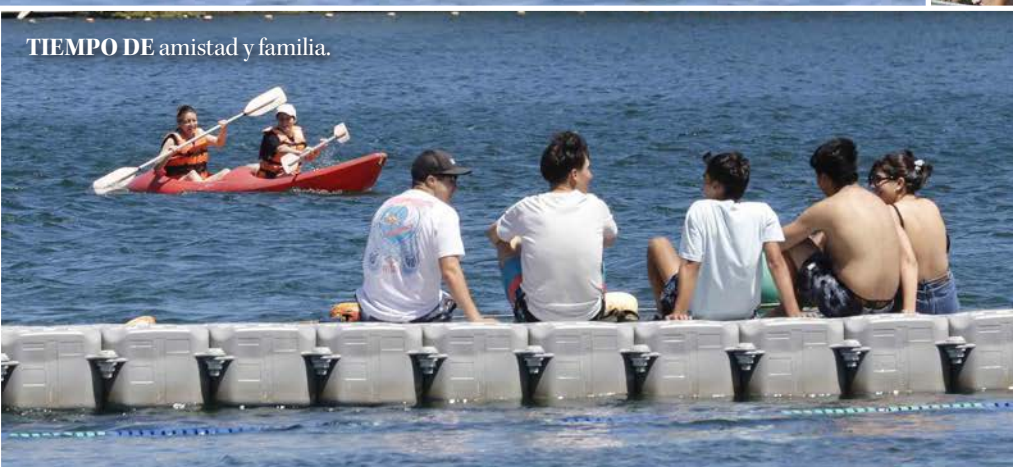
TIEMPO DE amistad y familia.