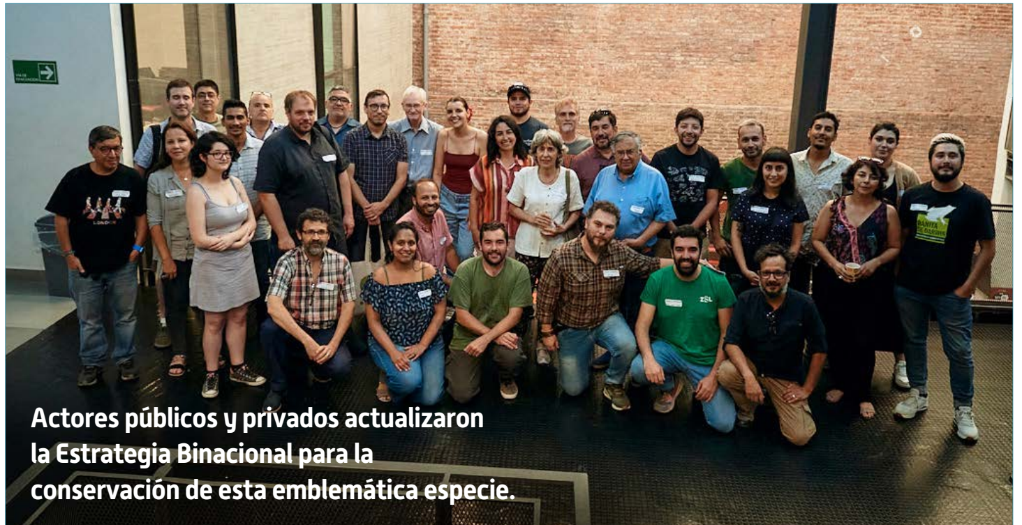
Actores públicos y privados actualizaron la Estrategia Binacional para la conservación de esta emblemática especie.