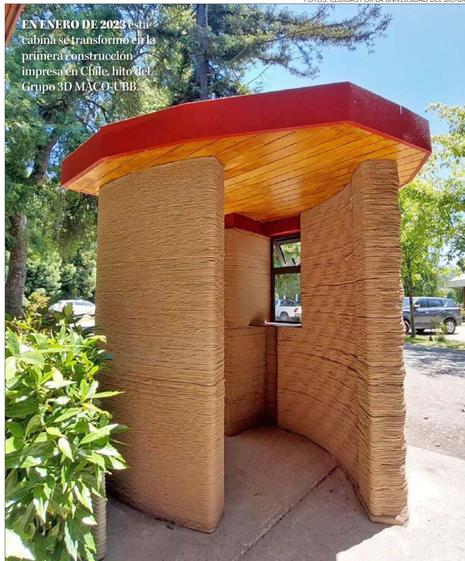
EN ENERO DE 2023 esta cabina se transformó en la primera construcción impresa en Chile, hito del Grupo 3D MACO-UBB.

La adquisición de "Atenea-UBB" se enmarca en un impulso al área que partió durante 2018 en la institución académica penquista y completa un importante repertorio de equipos de construcción aditiva que alberga el PEP Lab del Citec UBB.