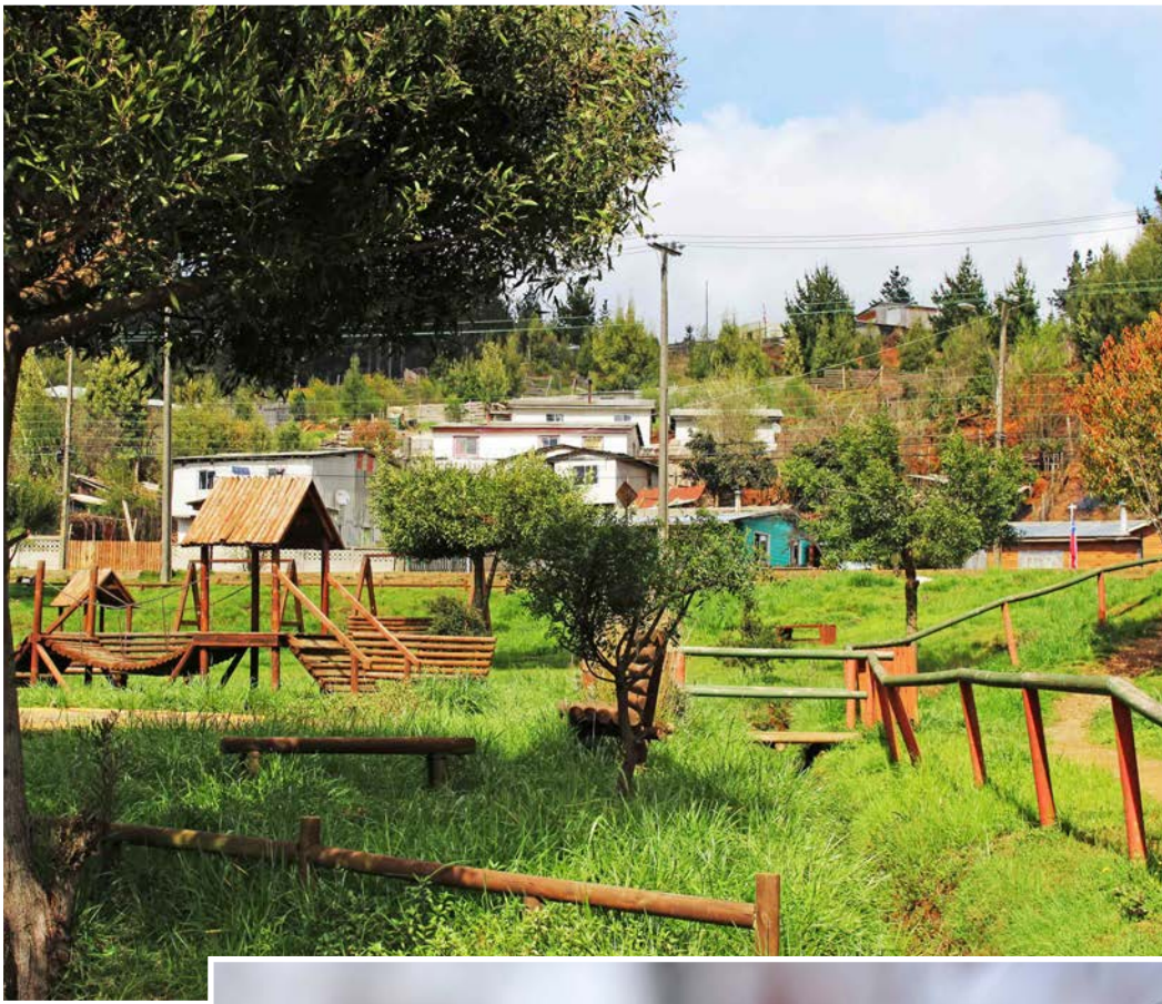
ESPACIOS PÚBLICOS marcados por el intenso verde.

A más de 90 kilómetros de Concepción, la comuna es parte de la historia carbonífera de la Región.