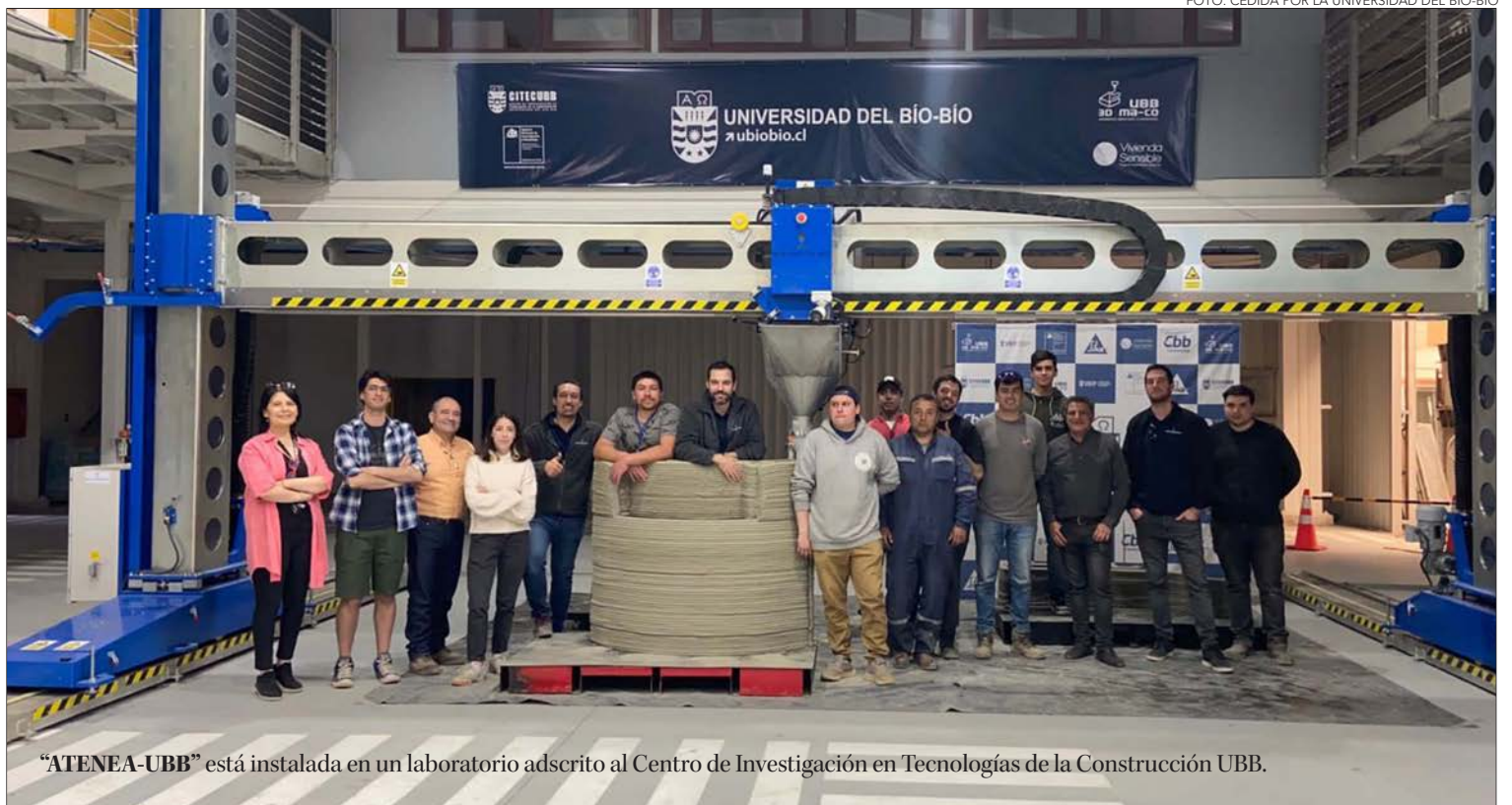
"ATENEA-UBB" está instalada en un laboratorio adscrito al Centro de Investigación en Tecnologías de la Construcción UBB.