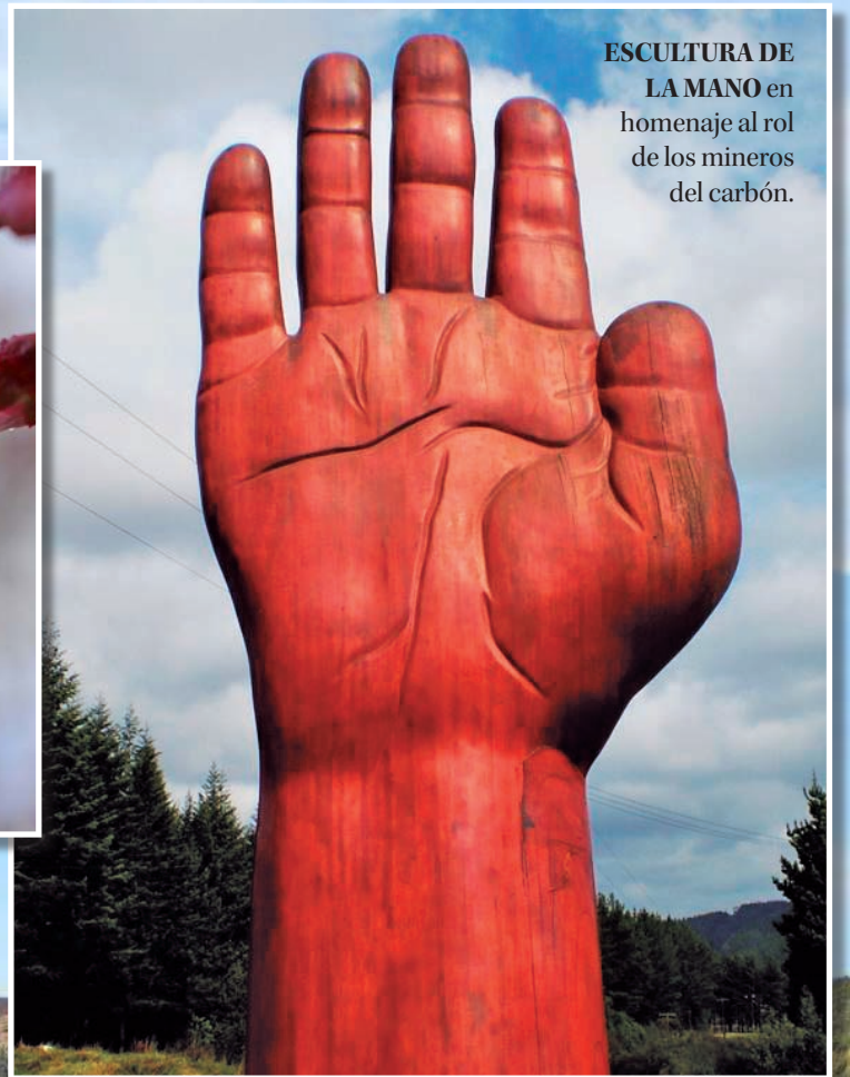
ESCALERA DE LA MANO en homenaje al rol de los mineros del carbón.