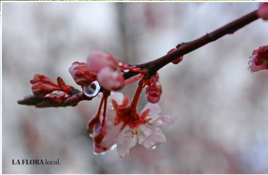
LA FLORA local.