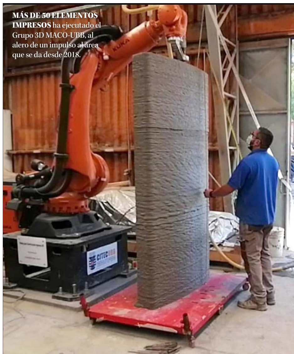
MÁS DE 50 ELEMENTOS IMPRESOS ha ejecutado el Grupo 3D MACO-UBB, al alero de un impulso al área que se da desde 2018.