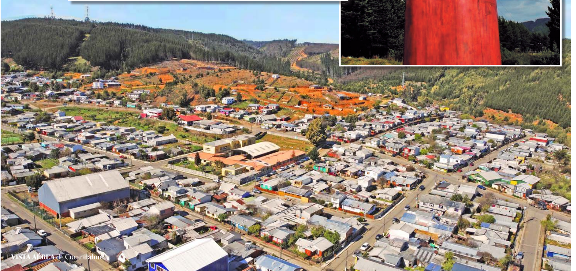
VISTA AÉREA de Curanilahue