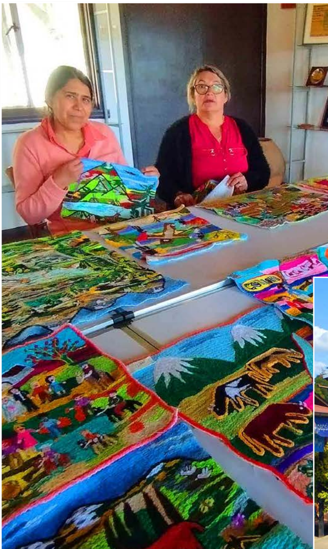
TEJIDOS y manualidades con sello local.

En la Ruta a Cabrero, ya a la altura de Florida se encuentra esta localidad. El acceso al agua es una de las mayores preocupaciones de esta comunidad.