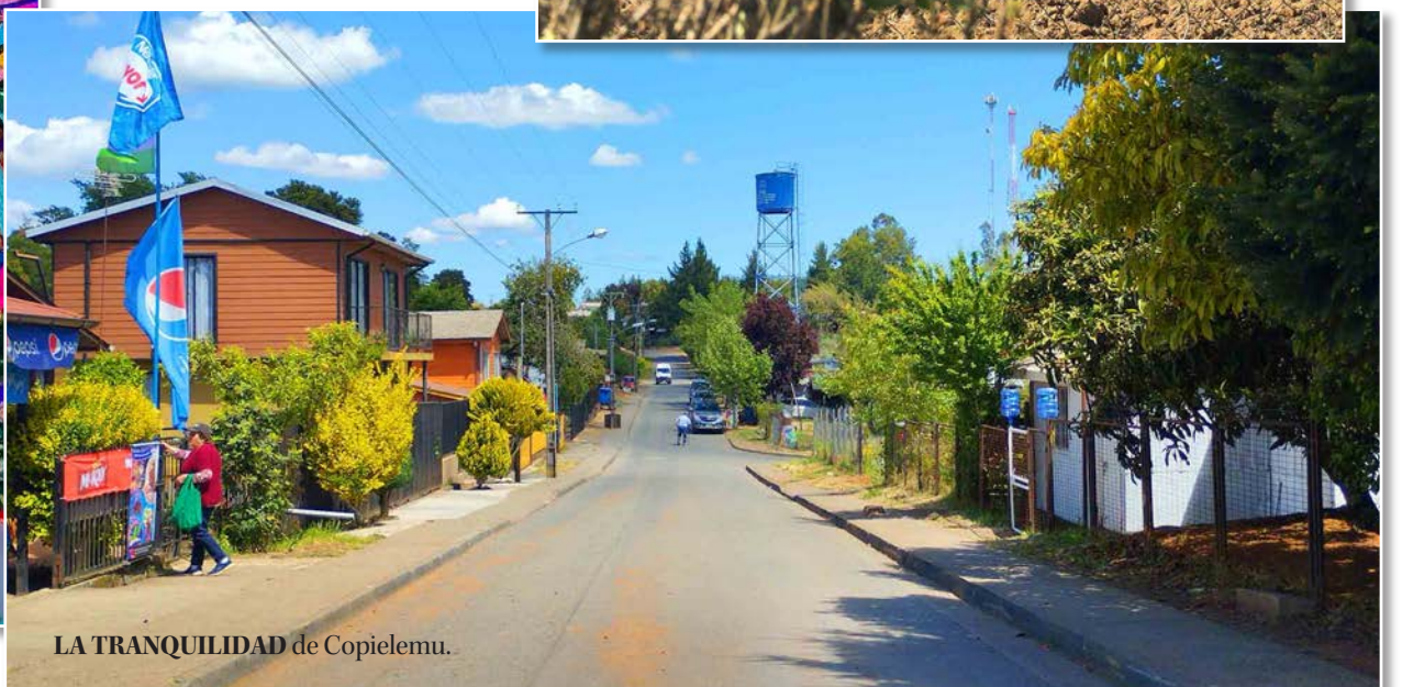
LA TRANQUILIDAD de Copiulemu.