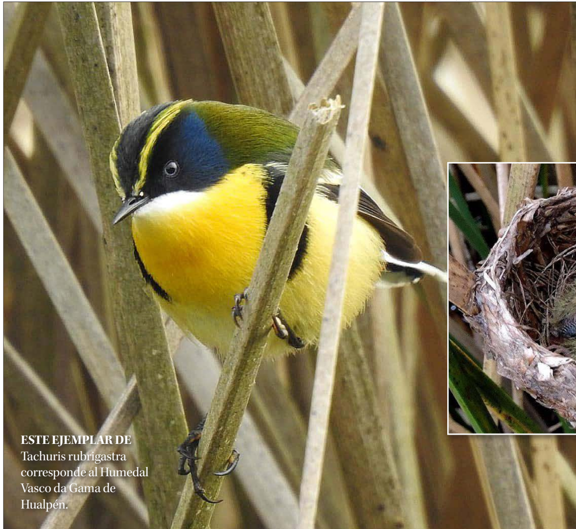
ESTE EJEMPLAR DE Tachuris rubrigastra corresponde al Humedal Vasco da Gama de Hualpén.