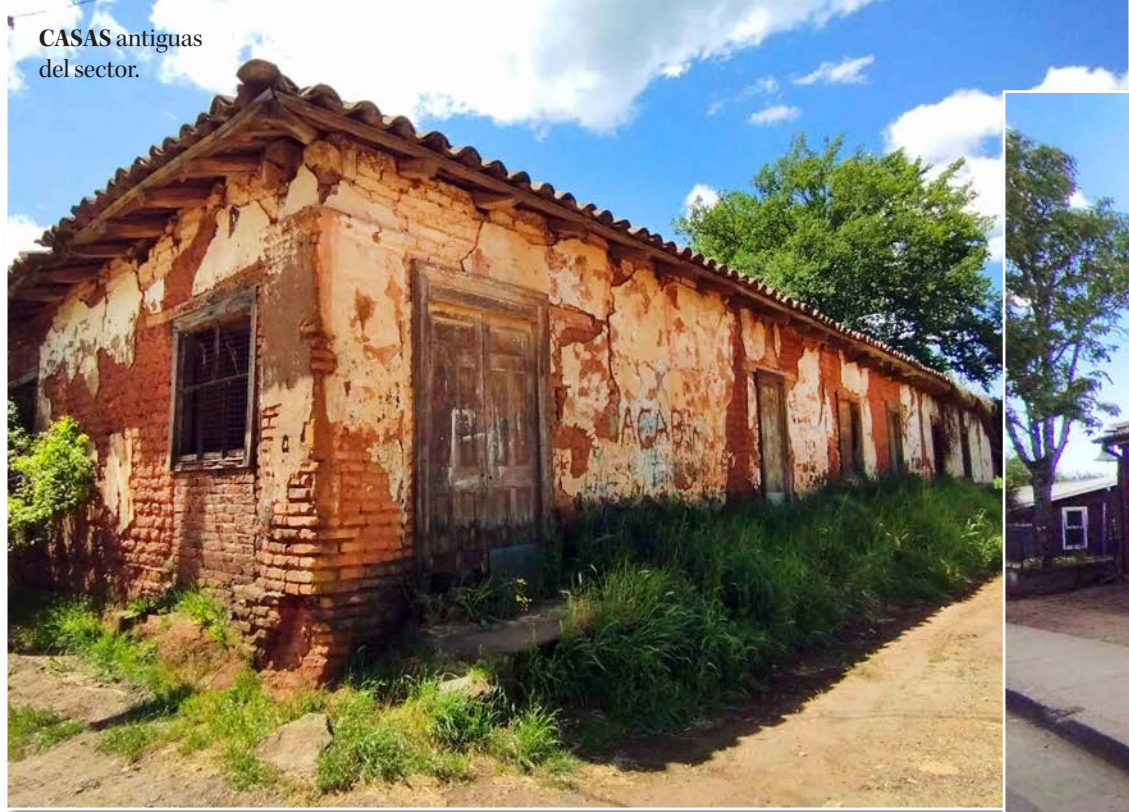
CASAS antiguas del sector.