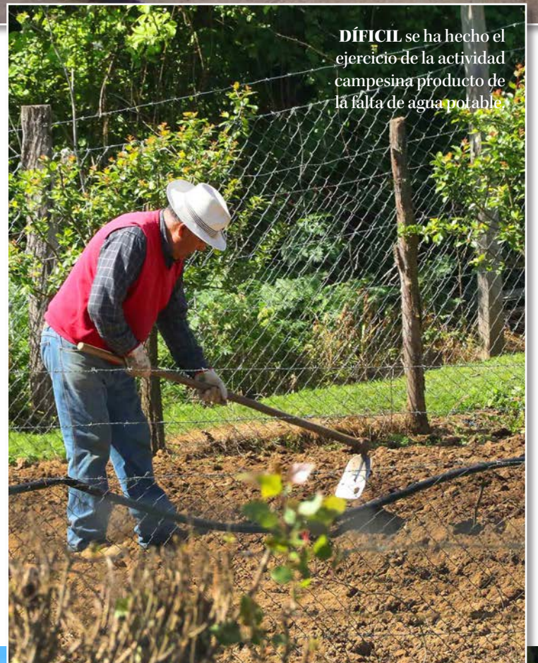
DÍFICIL se ha hecho el ejercicio de la actividad campesina producto de la falta de agua potable.

En la Ruta a Cabrero, ya a la altura de Florida se encuentra esta localidad. El acceso al agua es una de las mayores preocupaciones de esta comunidad.