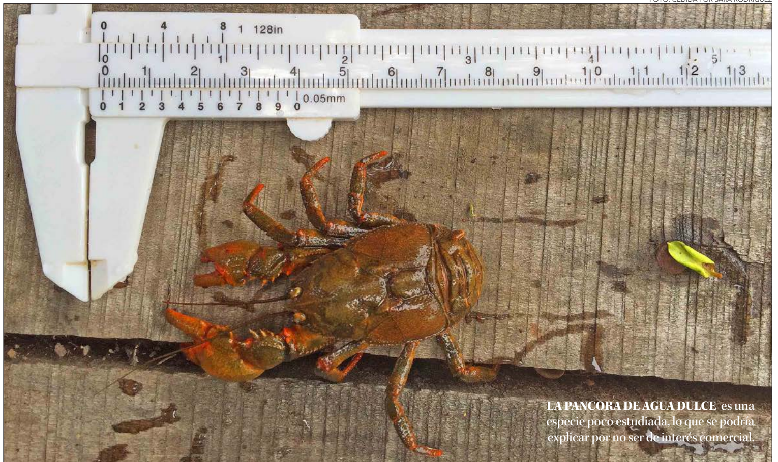
LA PANCORA DE AGUA DULCE es una especie poco estudiada, lo que se podría explicar por no ser de interés comercial.