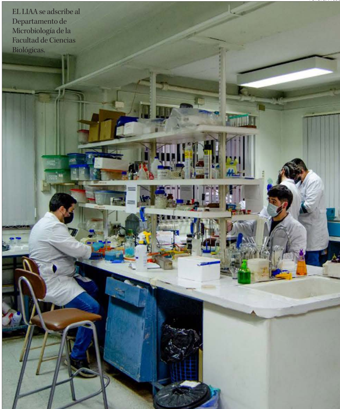
EL LIAA se adscribe al Departamento de Microbiología de la Facultad de Ciencias Biológicas.