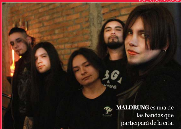
MALDRUNG es una de las bandas que participará de la cita.

Esta sería la quinta versión de esta instancia, la cual nació puntualmente el año 2016 y luego de diferentes pausas, estallido social y pandemia incluida, vuelve a concretarse en suelo sampedrino con entrada totalmente liberada y abierto para todo público.