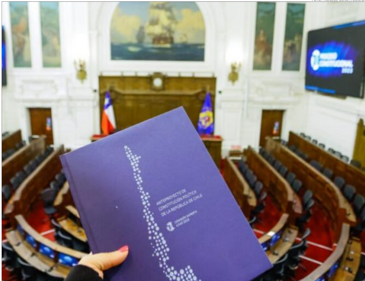
FOTO: PROCESO CONSTITUCIONAL

DESPLIEGUE DE CAMPAÑA “CHILE VOTA INFORMADO”