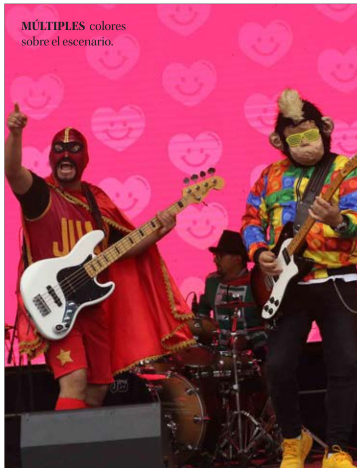
MÚLTIPLES colores sobre el escenario.