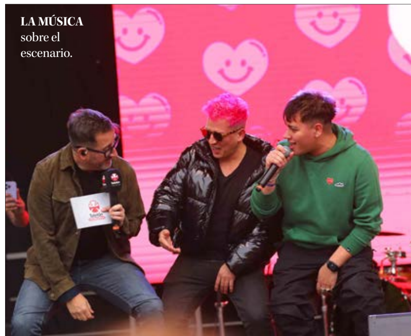
LA MÚSICA sobre el escenario.

Actos artísticos, música, y participación del público marcaron la jornada junto a la Plaza Independencia.