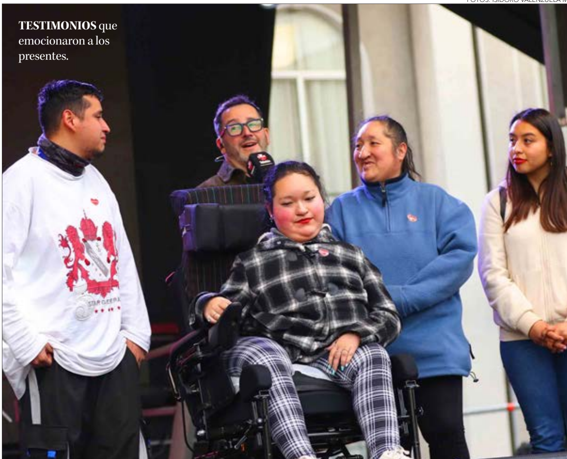
TESTIMONIOS que emocionaron a los presentes.