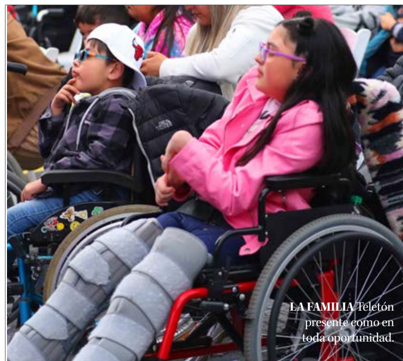
LA FAMILIA Teletón presente como en toda oportunidad.