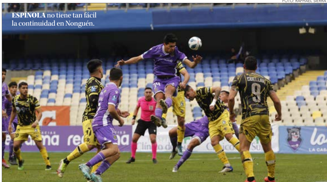
ESPÍNOLA no tiene tan fácil la continuidad en Nonguén.

Deportes Concepción sigue en movimiento a una semana y media de cerrar el campeonato.