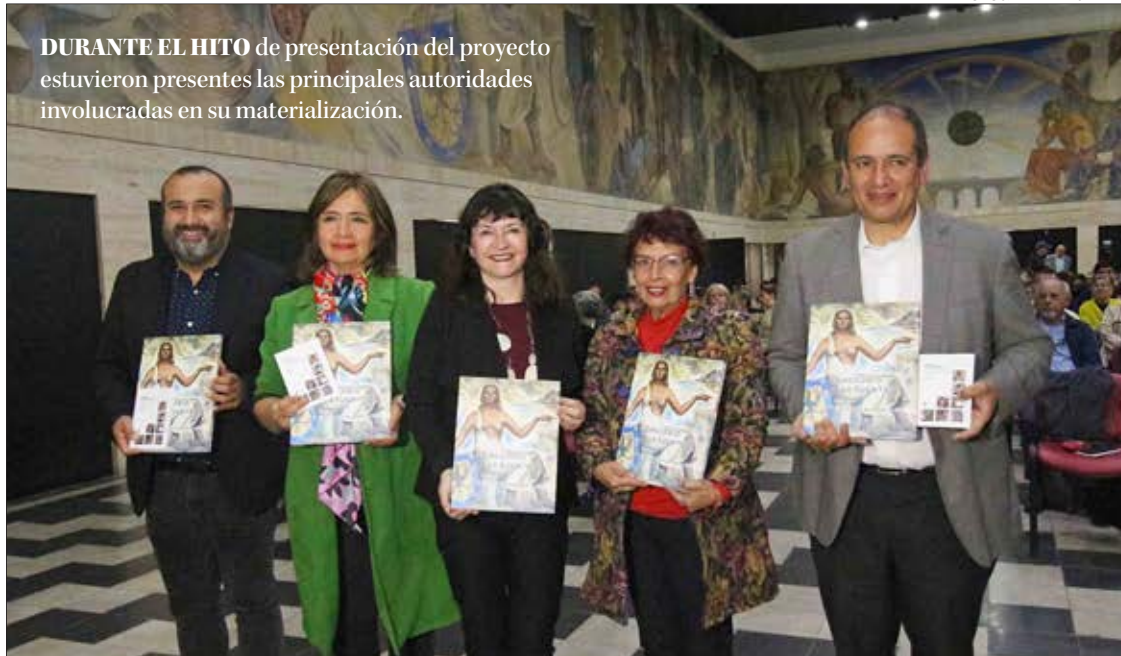
DURANTE EL HITO de presentación del proyecto estuvieron presentes las principales autoridades involucradas en su materialización.