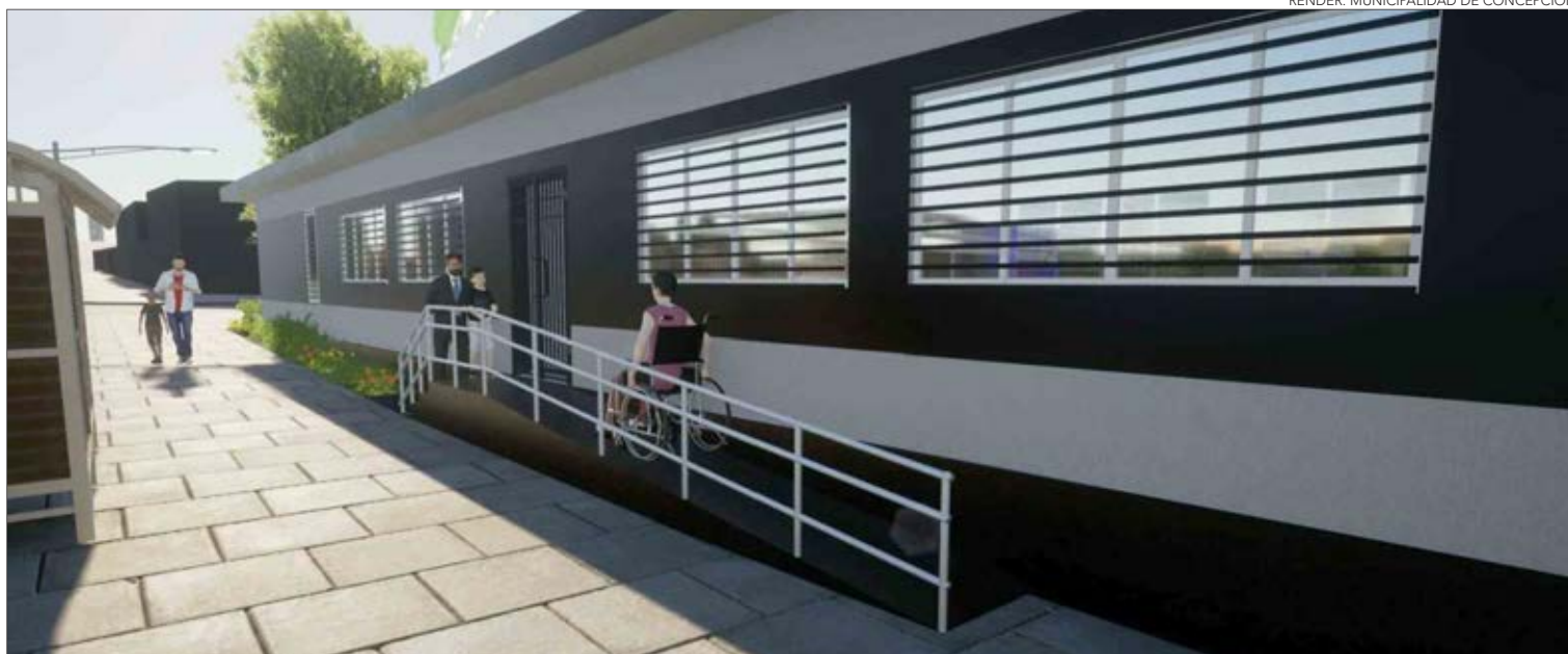
RENDER: MUNICIPALIDAD DE CONCEPCIÓN