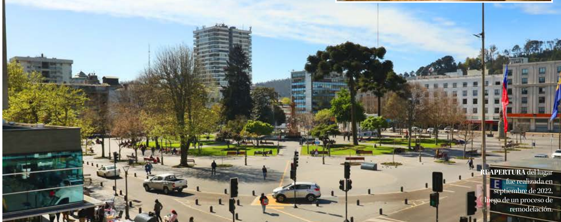
REAPERTURA del lugar fue realizada en septiembre de 2022, luego de un proceso de remodelación.