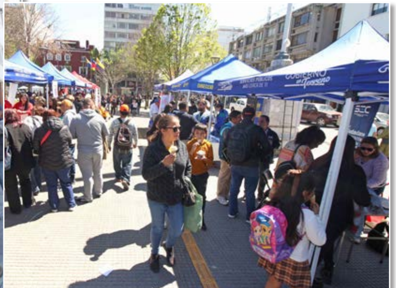
VARIAS INSTITUCIONES estuvieron presentes con sus stands.