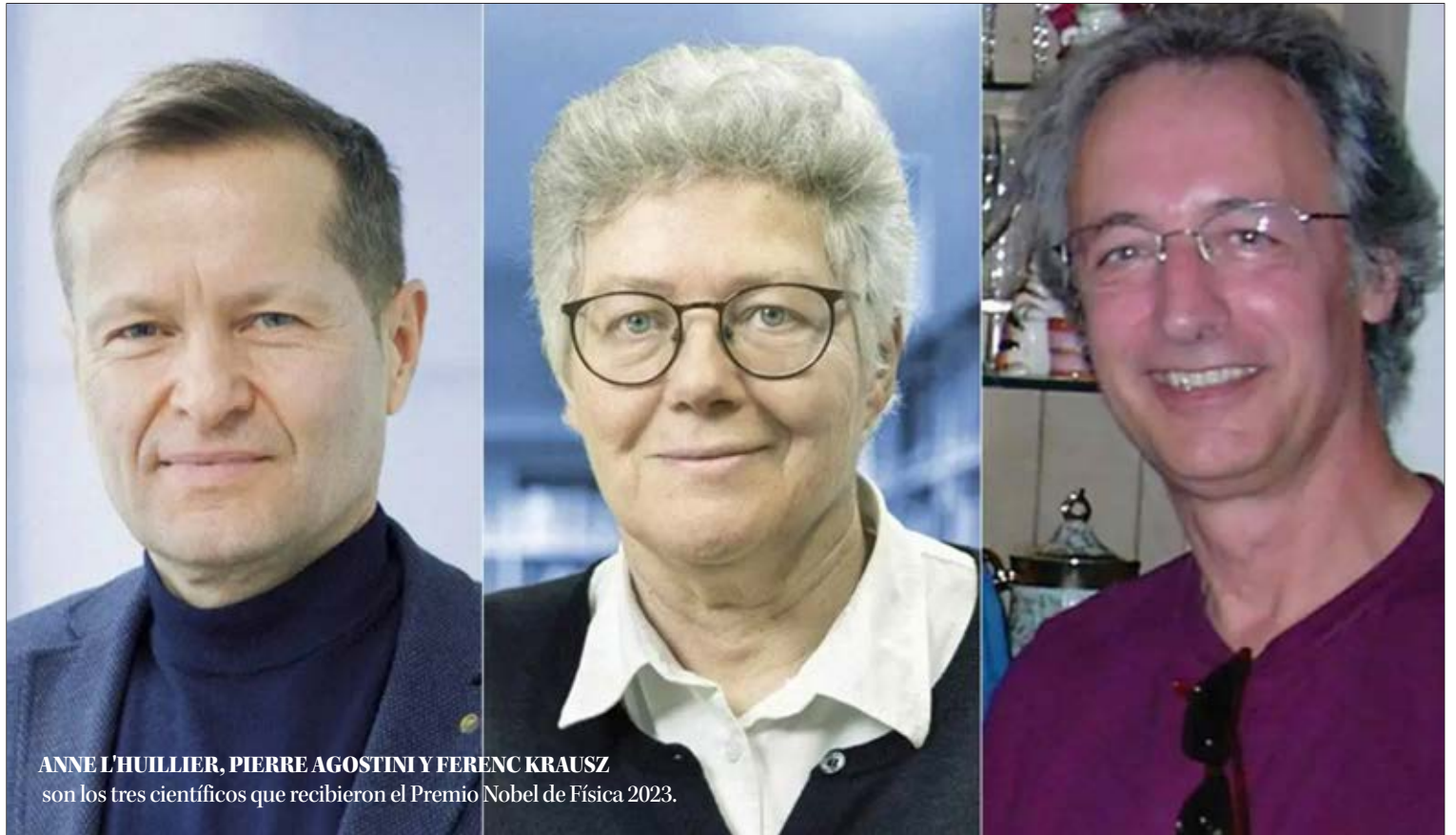
ANNE L'HUILLIER, PIERRE AGOSTINI Y FERENC KRAUSZ son los tres científicos que recibieron el Premio Nobel de Física 2023.

Hasta los resultados de los trabajos de los Nobel de Física 2023 que “generaron un método para producir pulsos de luz muy cortitos, del orden del attosegundo”, apunta. Con su avance, afirma que “lograron llevarnos de un régimen de la materia a otro, donde