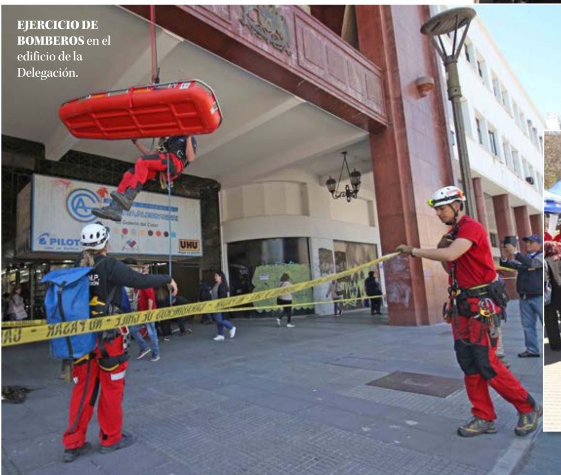
EJERCICIO DE BOMBEROS en el edificio de la Delegación.