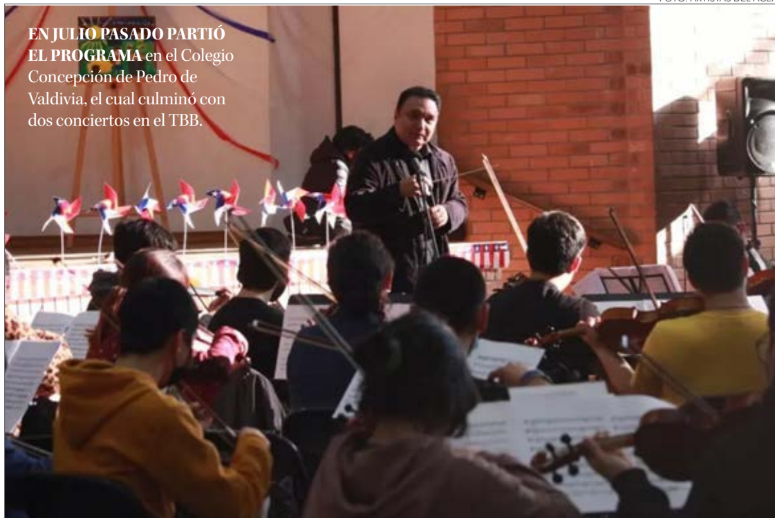
EN JULIO PASADO PARTIÓ EL PROGRAMA en el Colegio Concepción de Pedro de Valdivia, el cual culminó con dos conciertos en el TBB.