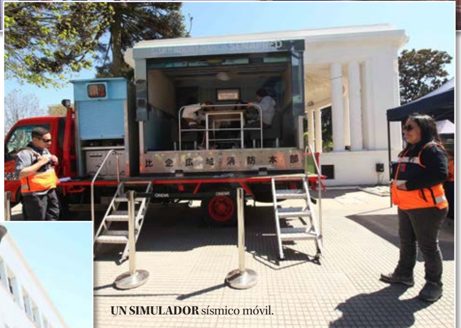
UN SIMULADOR sísmico móvil.