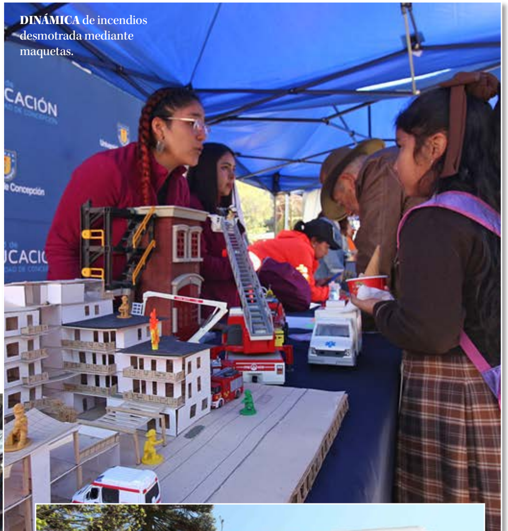
DINÁMICA de incendios desmotrada mediante maquetas.