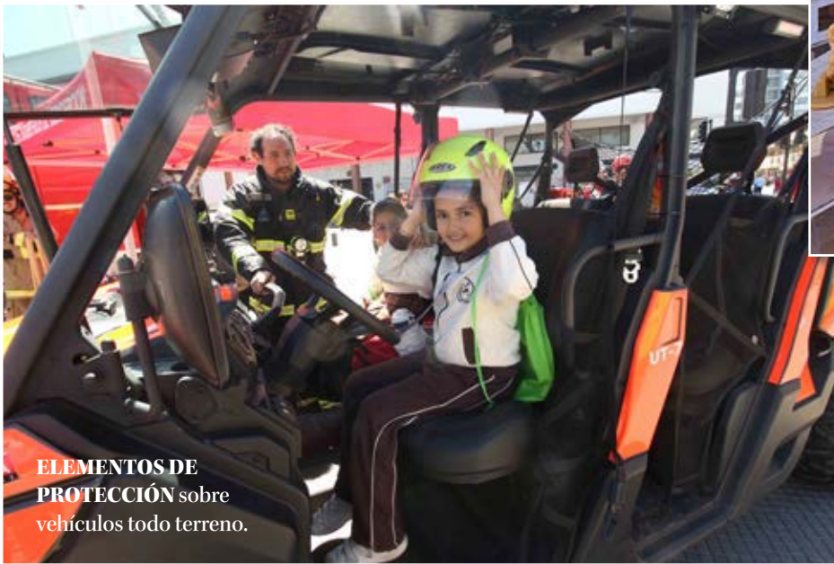
ELEMENTOS DE PROTECCIÓN sobre vehículos todo terreno.